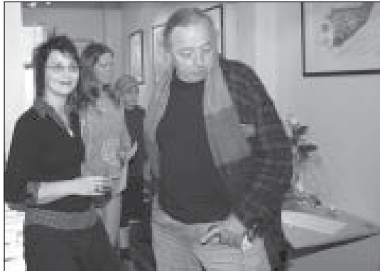
Marsibil sýnir nú í fyrsta sinn á Ísafirði.