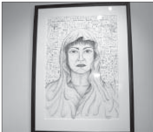
Eitt verkanna á sýningunni.