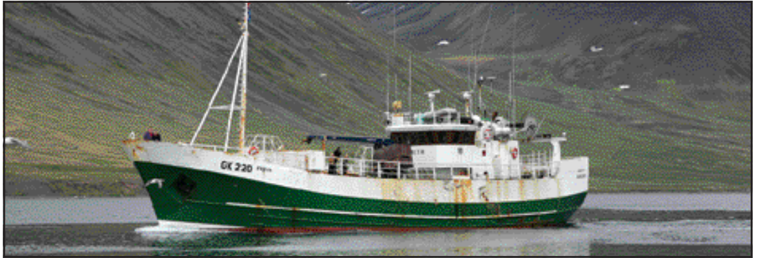
Hið nýja skip „Siggí Þorsteins“ siglir inn í höfnina á Flateyri á föstudag.