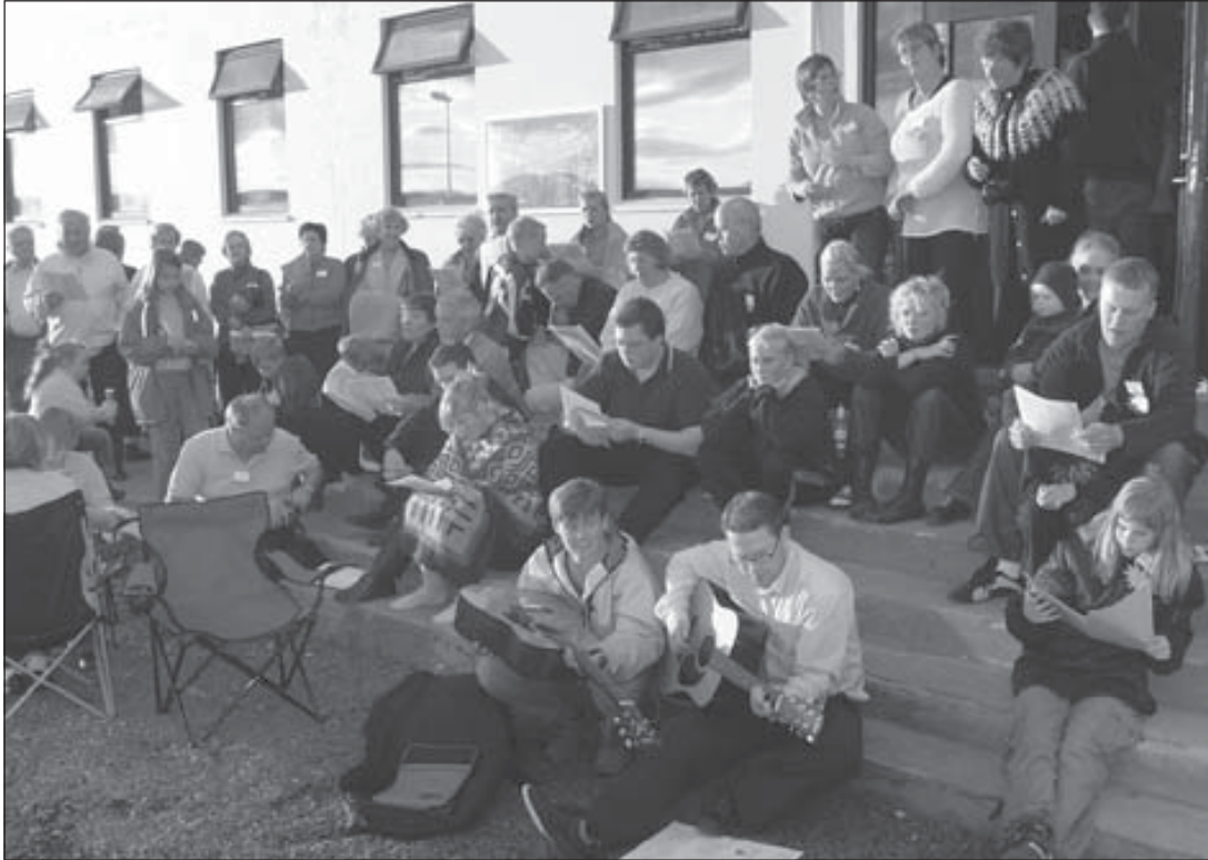
Gromsasar héldu kvöldvöku utandyra á föstudagskvöldið enda veður með ágætum.