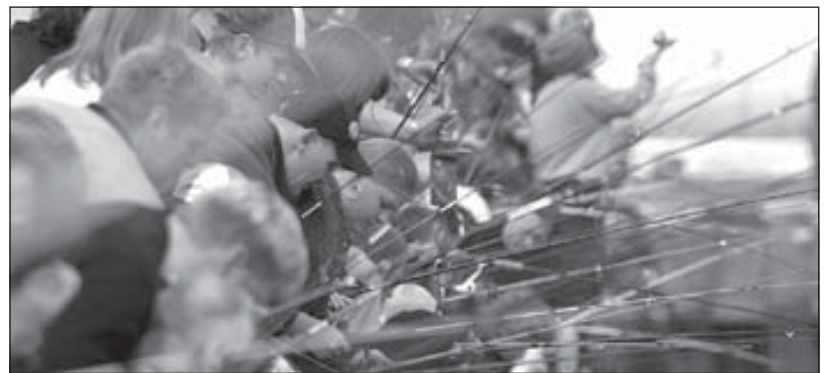
Frá mansakeppni Sæluhelgarinnar í fyrra.

Verðlaun verða veitt fyrir allar keppnisgreinar og eru þau gefin af útgerðum og öðrum Mansavinum á Suðureyri. Merki Sæluhelgarinnar verður selt á 1.000 krónur og veitir aðgang að öllu nema dansleiknum á laugardagskvöld og leiksýningum. – thelma@bb.is