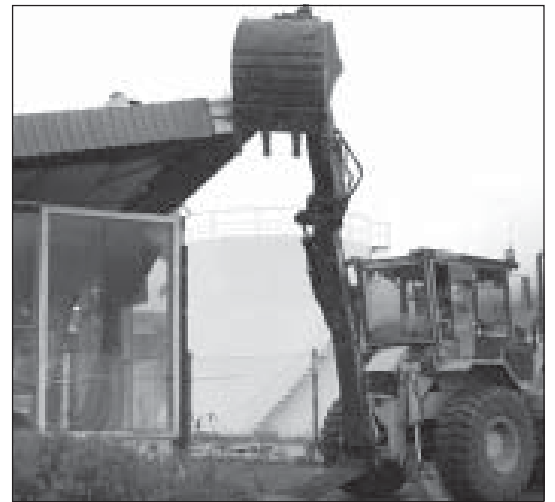
Vinnuvél leggur til atlögu við húsið.

Starfsmenn Ísafjarðarbæjar hófu á þriðjudag handa við að rífa húsið við Mjósund 2 á Ísafirði. Húsið þarf að hverfa þar sem það er fyrir breytingum sem fyrirhugaðar eru við gatnamót Aðalstrætis og Pollgötu. Húsið var upphaflega reist á Torfnesi og hýsti þá bensinstöð Esso auk leigubílastöðvar og vörubílastöðvar. Hét húsið þá Esso-Nesti og var helsti viðkomustaður bæjarbúa í mörg ár, sérstaklega þeirra af yngri kynslóðinni. Var þar rekin myndarleg sjoppa með öllu tilheyrandi. Þegar byggingaframkvæmdir hófust við nýtt sjúkrahús á Ísafirði á áttunda áratug síðustu aldar varð húsið að víkja og var