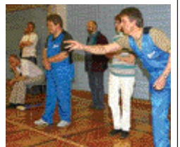
Frá síðasta móti.

Hið árlega fyrirtækjamót íþróttafélagsins Ívars verður haldið í október. Ákveðið var að fresta mótinu þar sem ekki var hægt að halda það í byrjun mars, eins og upphaflega var ákveðið, vegna Íslandsmóts fatlaðra í sundi. Vegna fjölda áskorana frá þátttakendum fyrirtækjamótsins undanfarin ár var ákveðið á stjórnarfundi að halda mótið fyrstu helgina í október. Vonast stjórnin til að áhugafólk um Boccia fjölmenni á mótið í haust. Mótið verður nánar auglýst þegar nær dregur.