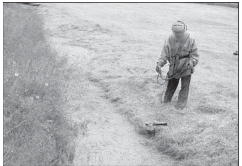
Sláttumaður að störfum.

Bæjarráð Ísafjarðarbæjar hefur samþykkt að ganga til samninga við tvö fyrirtæki um slátt á opnum svæðum í Ísafjarðarbæ en verkið var boðið út fyrir skömmu og bárust tilboð frá níu aðilum. Jóhann B. Helgason bæjar- tæknifræðingur lagði til að tekið yrði tilboðum Gröfu-