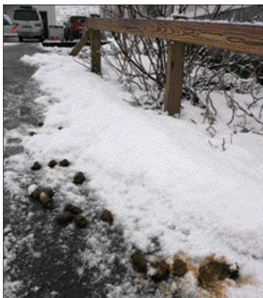
Hundaskítur í Urðavegsbrekkunni.

Nokkrir bæjarbúar á Ísafirði hafa haft samband við vefinn og kvartað sáran undan hundaskít sem liggur víða á gangstéttum í bænum. Hefur Urðavegsbrekkan sérstaklega