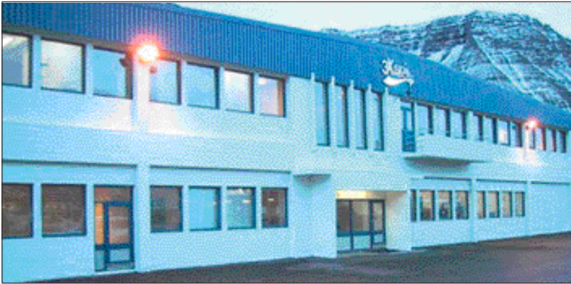
3X-Stál á Ísafirði.

Vinnueftirlit ríkisins hefur fengið til liðs við sig fjögur fyrirtæki á Vestfjörðum við þróun á áhættumati. „Ég hef fengið fyrirtæki af fimm stöðum á landinu til að taka þátt í tilraunaverkefni til að finna út hvaða aðferðir eru