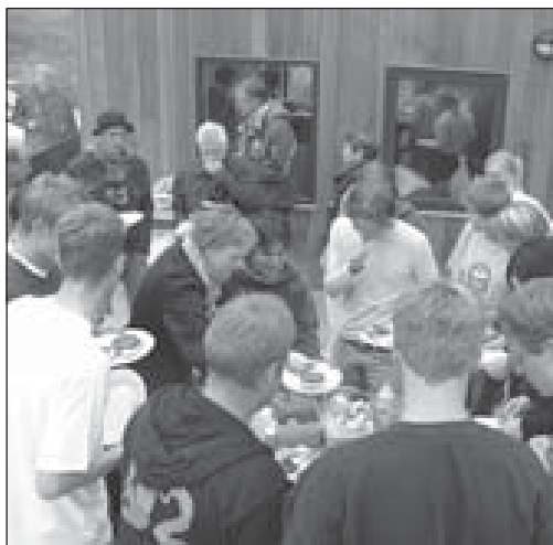
Frá norrænu vinabæjarmóti á Ísafirði 2002.

Bæjarráð Ísafjarðarbæjar hefur samþykkt tillögu menningarmálanefndar um að ungmenni frá Ísafjarðarbæ taki þátt í vinabæjamóti ungmenna sem haldið verður í vinabænum Túnbergi í Noregi frá 27. ágúst til 2. september í haust. Í boðsbréfi sem barst frá Túnbergi segir