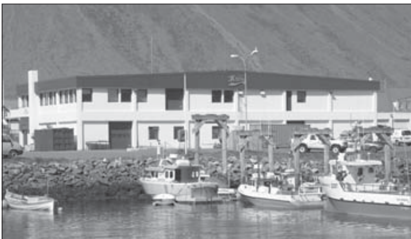
3X-Stál á Ísafirði.

3X-Stál tekur þátt í sjávarútvegssýningunni „North Atlantic Fish Fair“ sem haldin verður í Þórshöfn í Færeyjum dagana 3.-5. maí. Er þetta í fyrsta sinn sem fyrirtækið tekur þátt í þessari sýningu. „Tiltölulega stutt er síðan