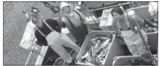
Sjóstangveiðimenn landa afla.

Undanfarnar vikur hafa staðið yfir viðræður við þýska ferðaþjónustutækið Vögler's Angelreisen í Hamborg um sölu á sjóstangaveiðiferðum til Vestfjarða. Í framhaldi af þeim var komist að þeirri