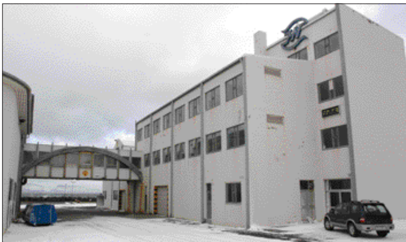
Norðurtangahúsið að Sundstræti 36.

Umhverfisnefnd Ísafjarðarbæjar gerir ekki athugasemd við að notkun hússins að Sundstræti 36 á Ísafirði, sem áður hósti hluta af starfsemi Norðurtangans, verði breytt. Tryggvi Guðmundsson sendi nefndinni ósk um að breyta efri hæðum hússins í íbúðir en á jarðhæð verði bílgeymslur og iðnaðarhúsnæði. Í bókun nefndarinnar kemur fram að hún geri ekki athugasemd við fyrirhugaða breytingu en bendir á að væntanlegur hús-eigandi þurfi að sækja um og kosta breytingu á aðal- og deiliskipulagi vegna þessa.