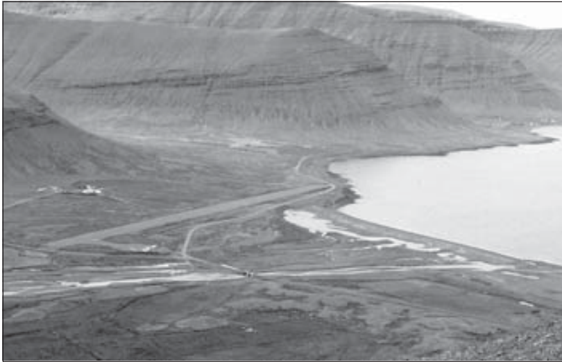
Pingeyrarflugvöllur í Dyrafirði.

Á árunum 2005-2008 verður varið 232 milljónum króna til framkvæmda á flugvöllum á Vestfjörðum. Þetta kemur fram í samgönguáætlun sem Sturla Böðvarsson samgönguráðherra lagði nýverið fram á Alþingi. Stærstur hluti þessara fjárveitinga fara í framkvæmdir við flugvöllina á Ísafirði og Þingeyri eða um 200 milljónir króna.