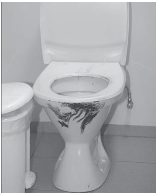
Þessi mynd var tekin skömmu eftir að verslunarmiðstöðin opnaði.

Almenningssalernum í skelfilegrar umgengni. Ítrekað hafa vaskar og klósettskálar hefur nú verið lokað vegna