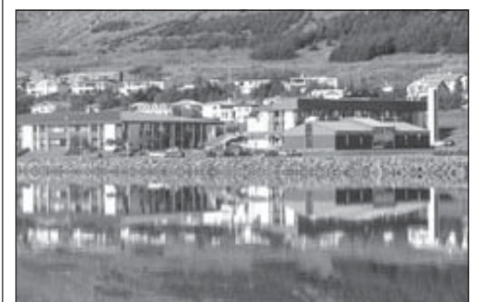
Menntaskólinn á Ísafirði.

Bæjarráð Ísafjarðarbæjar samþykkti í síðustu viku að leggja til við bæjarstjórn að í fjárhagsáætlun næsta árs verði gert ráð fyrir styrk til listaverkakaupa í tilefni þess að 100 ár eru liðin frá því að kennsla í iðngreinum hófst á Ísafirði.