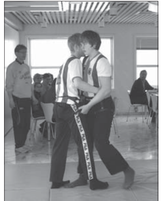
Glímt í Stjórnsýsluhúsinu.

Starfsmönnum Stjórnsýsluhússins á Ísafirði var boðið upp á kynningu á glímu í síðustu viku þar sem fjórir ungir menn sem skipa glímusveit HSV bruguðu á leik. „Þeir sýndu ýmis brögð og kynntu þessa íþrótt sem ekki hefur verið iðkuð á Ísafirði síðan um 1950. Þar áður hafði hún ekki verið stunduð síðan um síðustu aldamót. Segja má að hún hafi því verið stunduð á Ísafirði með hálfri aldar millibili“, segir Hermann