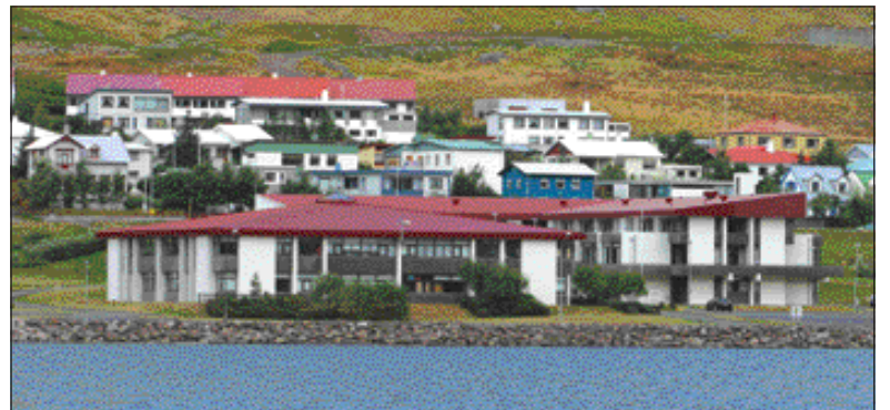
Menntaskólinn á Ísafirði.

Borist hefur yfirlýsing formanns og varaformanns Félags framhaldsskólakennara. Yfirlýsingin fer hér á eftir í heild: „Við undirrituð gerum alvarlegar athugasemdir við frétt Svæðisútvarpsins á Ísafirði, 7. apríl sl. þar sem greint er frá fundi formanns og varaformanns Félags framhaldsskólakennara með skólameistara Menntaskólans á Ísafirði 7. apríl sl. og um þá staðhæfingu í frétt Svæðisútvarpsins „að svo virðist sem sættir hafi náðst“ á þeim fundi. Vegna ofangreindrar fréttar viljum við taka fram: