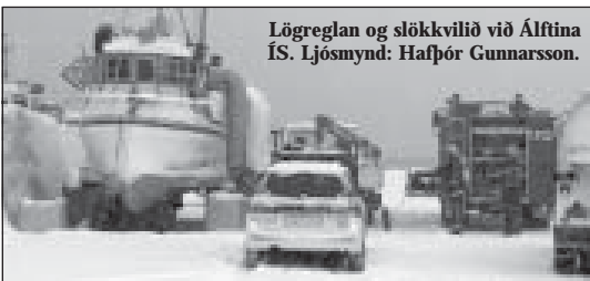
Lögreglan og slökkvilið við Álfina ÍS.

Talsvert fleiri farþegar fóru um Ísafjarðarflugvöll árið 2004 en síðustu þrjú ár þar á undan, að því er fram kemur á vef Leiðar ehf. Samkvæmt bráðabirgðatölum Flugmálastjórnar var fjöldi farþega síðasta ár 45.393 sem er 13,3 % aukning frá árinu áður þegar farþegar voru 40.060. Fjöldi farþega um völlinn var mestur á árunum 1994 til 2000 þegar hann fór aldrei niður fyrir 52.000. Metár var 1997 og var þá fjöldinn samtals 60.480. Ef 45.393 farþegar fara um flugvöllinn á einu ári þýðir það að meðalfjöldi farþega hvern dag er 124 - 62 í hvora átt.