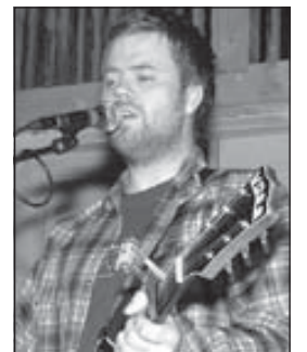
Mugison verður á Hróarskeldu í sumar.

Mugison hefur boðað komu sína á Hróarskelduhátíðina í Danmörku í sumar. Tónlist Mugison er lýst á vef hátíðarinnar sem spuna og tilraunum úr samsuðu af hljómoreiðu og ljúfu rokki. Einnig hefur goðsögnin, og fyrrverandi forsprakki hljómsveitarinnar Beach Boys, Brian Wilson boðað komu sína á hátíðina. Þrjú nöfn frá Skandinavíu hafa einnig bæst við listann og er það hinn sænski Dungen, pönkhljómsveitin Skambankt frá Noregi og blúsrókkarinn Björn Berge.