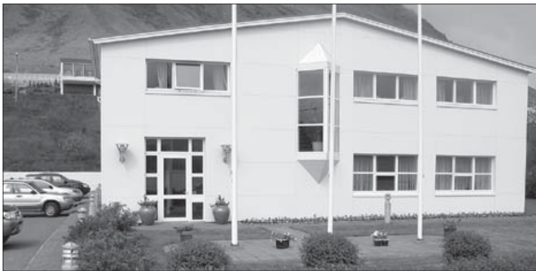
Höfuðstöðvar Orkubús Vestfjarða hf., á Ísafirði.

Af framansögðu má ráða að á næstu vikum reyni á áður nefnt samkomulag frá árinu 2001 og þau loforð sem gefin hafa verið um hugsanlega sameiningu. – hj@bb.is