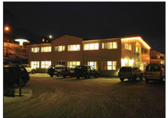
Höfuðstöðvar Orkubús Vestfjarða á Ísafirði.

sameinuðu fyrirtækjum verði breytt í hlutafélag, þó eigi fyrir en á árinu 2008. Segja ráðuneytin að með hlutafélagavæðingunni séu sköpuð skilyrði fyrir aðkomu nýrra fjárfesta að fyrirtækinu. Sjá einnig bls. 7.