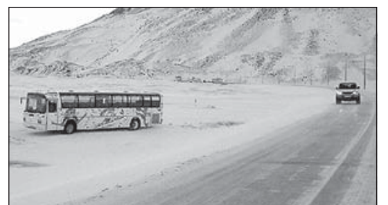
Eins og sjá má náði ökumaðurinn að stýra rútunni af veginum og koma í veg fyrir veltu.

Áður höfðu hljómsveitir á borð við Black Sabbath og Green day skráð sig til leiks. – thelma@bb.is