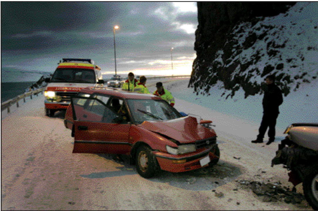
Frá slysstæð við krossinn á Óshlíð.