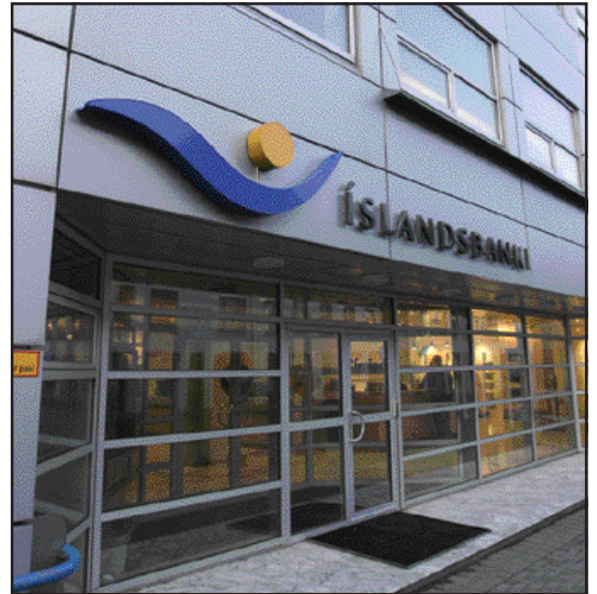
Íslandsbanki er til húsa í Stjórnsýsluhúsinu á Ísafirði.

menn sem ráðnir verða á næstu vikum bætast við starfsmannafjöldann og er gert ráð fyrir frekari fjölgun á næstu mánuðum vegna aukinna verkefna. Ekki hefur komið til neinna uppsagna vegna flutnings símaskiptiborðsins. Íslandsbanki mun leitast við að flytja þá starfsmenn símaskiptiborðsins sem þess óska til í starfi innan bankans og bjóða þeim upp á endurmenntun í því skyni. – hj@bb.is