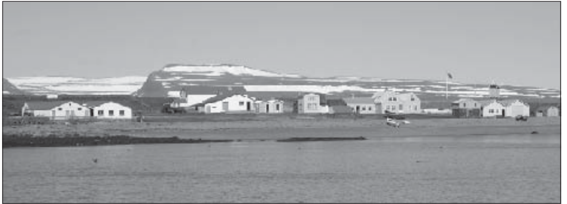
Íbúar í Vigur vona að þjónustan og gæði hennar versni ekki í kjölfar útboðs.

Í janúar var landað 4.295 tonnum af sjávarfangi í vestfirskum höfnum. Er það um 9 % samdráttur frá því í sama mánuði í fyrra en þá var landað 4.711 tonnum. Botnfiskafli er þó meiri í ár en í fyrra. Af einstökum tegundum má nefna að í ár var landað 2.862 tonnum af þorski en í fyrra var landað 2.542 tonnum. Ýsuafli jókst úr 914 tonnum í 987 tonn og steinbítasafli úr 107 tonnum í 275 tonn. Samdráttur varð hinsvegar í rækjuafli. Í ár var einungis landað 36 tonnum af rækju á höfnum á Vestfjörðum en í fyrra var landað 101 tonni.