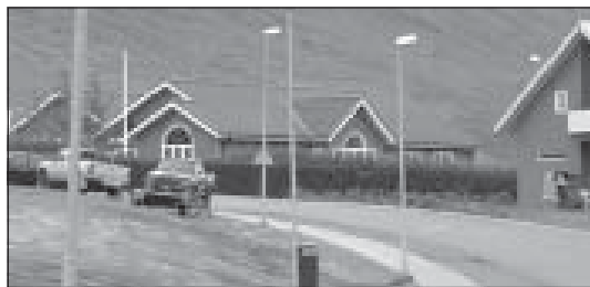
farin ár hafi sorpgjöld í Súðavík nægt fyrir þeim útgjöldum sem af hirðingu, akstri og eyð-