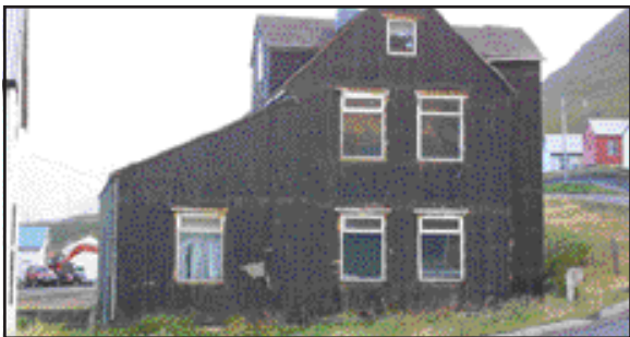
Hreggnasi 3 í Hnífsdal (Grænidalur).

Tvítugur maður var dæmdur til greiðslu 10 þúsund króna sektar og til greiðslu alls sakarkostnaðar fyrir að aka bifreið um götu á Ísafirði án þess að hafa ökuskráirni meðferðis og án þess að hafa öryggisbelti spennt.