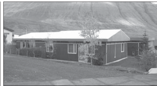
Mólholt 5 á Ísafirði.

Leiksýningin um Mugg er ekki heimildasýning í beinum skilningi. Þar fer til dæmis lítið fyrir ártölum og staðreyndatalningum, heldur bregða höfundar upp mynd af Muggi eins og hann kemur þeim fyrir sjónir sem persóna. „Við tökum okkur nokkurt skáldaleyfi og leikum okkur töluvert að aðstæðum. Þetta hefur verið frjóg og skemmtileg vinna og við vonum að vestfirskum áhorfendum líki af raksturinn. Til þess er leikurinn gerður“, segir leikstjórinn.