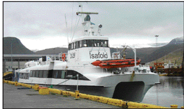
Tvíbytnan Ísafold í Ísafjarðarhöfn.