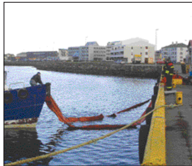
Hafnarstarfsmenn og slökkviliðsmenn komu mengunarvarnargirðingu fyrir.