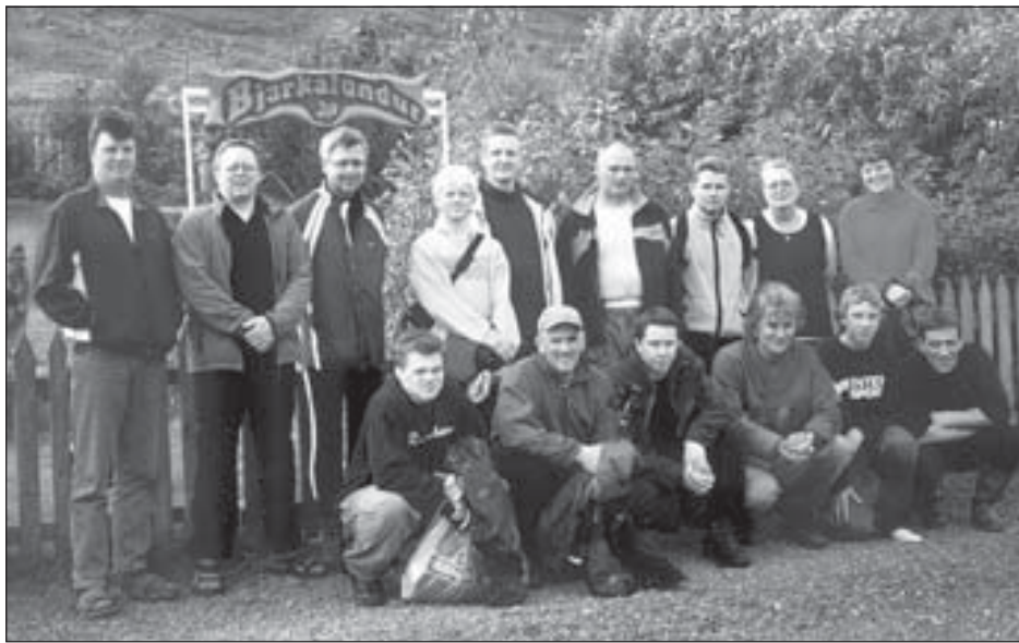
Föngulegur hópur smalaafólks að leggja af stað í leitir.