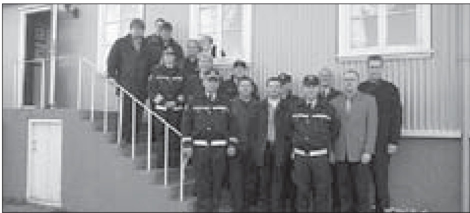
Hópurinn fyrir framan Café Riis á Hólmavík.

„Fundur sýslumanna á Vestfjörðum og í Dölum vekur athygli á afleitu símasambandi á Vestfjarðavegi og Djúpvegi, sem eru aðalþjóðvegir í landshlutanum.“ Þannig hefst ályktun sýslumanna fimm á umræddu landsvæði, sem þeir beina til samgönguráðherra og dómsmálaráðherra. Síðan segir: „GSM-samband er nær eingöngu í þéttbýliskjörnum og NMT-símasamband er afar slitrótt þar á milli og fer versnandi. Fundurinn lýsir áhyggjum sínum af þessu ástandi og hve öryggi vegfarenda er ótryggt af þessum sökum. Malarvegir, einbreitt slitlag, fjöll