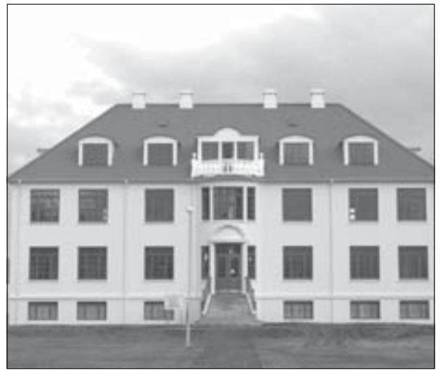
Safnahús Ísafjarðar (Gamla sjúkrahúsið).