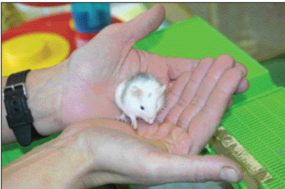
Farið var mjúkum höndum um hvítungjann.