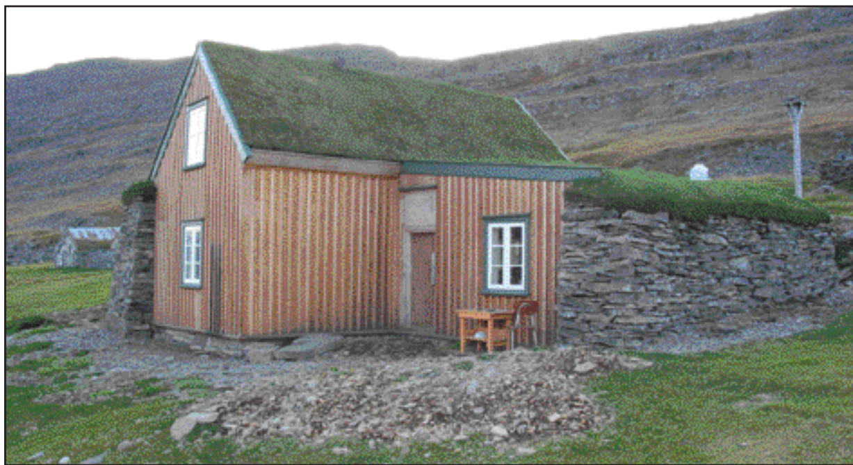
Litlibær í Skötufirði hefur tekið stakkaskiptum frá því sem áður var.