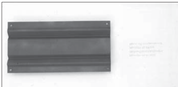
Eitt verkanna á sýningu Jóns Sigurpálssonar.