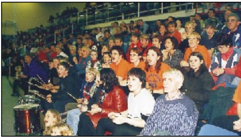
Lið KFÍ var dyggilega stutt af 900 áhorfendum.