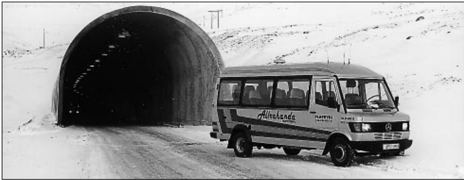
Allrahanda mun sjá um fólksflutninga milli Þingeyrar, Flateyrar, Suðureyrar og Ísafjarðar.

Því séu nokkur atriði sem ekki er hægt að standa við