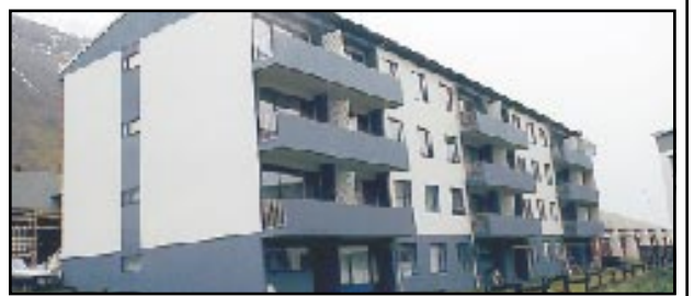
Túngata 20: 74,9 m 2 íbúð í uppgerðu fjölbýlishúsi. Íbúðin öll uppgerð. Laus fljótlega. Tilboð óskast. Einnig: 53,4 m 2 íbúð á 3. hæð í fjölbýlishúsi í góðu standi. Húsið er nýlega gert upp að utan. Verð: 5.400.000,-

3ja herbergja íbúðir Aðalstræti 32: 86 m 2 íbúð á efri hæð í fjölbýlishúsi ásamt sameiginlegum kjallara. Verð: 3.500.000,- Engjavegur 17: 61,7 m 2 íbúð á neðri hæð í tvíbýlishúsi. Sér inngangur. Íbúðin er nýmálað. Verð: 4.600.000,- Fjarðarstræti 38: 70 m 2 3ja-4ra herbergja íbúð á rishæð ásamt geymslum. Íbúðin er mikið endurgerð. Verð: 4.000.000,- Pólgata 6: 55 m 2 íbúð á 1. hæð í fjölbýlishúsi ásamt herb. í kjallara, innangengt úr íbúð. Sér inngangur. Tilboð óskast. Pólgata 6: 52 m 2 risibúð á 3. hæð í fjölbýlishúsi ásamt geymslu í kjallara. Mikið endurnýjað. Verð: 3.000.000,- Seljalandsvegur 67: 107 m 2 íbúð á neðri hæð í tvíbýli. Verð: 6.000.000,- Stórholt 9: 74,6 m 2 íbúð á 1. hæð fyrir miðju í fjölbýlishúsi. Verð: 5.300.000,- Stórholt 11: 80 m 2 íbúð á 3. hæð t.h. í fjölbýlishúsi. Laust strax. Verð: 5.900.000,- Stórholt 11: 80 m 2 íbúð á 2. hæð í fjölbýlishúsi ásamt innbyggðum bílskúr. Verð: 6.900.000,- Stórholt 11: 72,6 m 2 íbúð á 1. hæð í fjölbýlishúsi. Verð: 4.500.000,- Urðarvegur 80: 82 m 2 íbúð á jarðhæð í fjölbýlishúsi ásamt sér geymslu. Verð 6.000.000,- 2ja herbergja íbúðir Grundargata 2: 50,5 m 2 íbúð á fyrstu hæð í fjölbýlishúsi ásamt sér geymslu. Verð: 3.800.000,- Sundstræti 24: 69 m 2 íbúð á jarðhæð í þríbýlishúsi. Sér hiti, rafmagn og inngangur. Mikið uppgerð. Verð: 4.900.000,- Túngata 12: 62 m 2 íbúð í kjallara í þríbýlishúsi. Skipti á stærri eign möguleg. Verð: 3.900.000,-