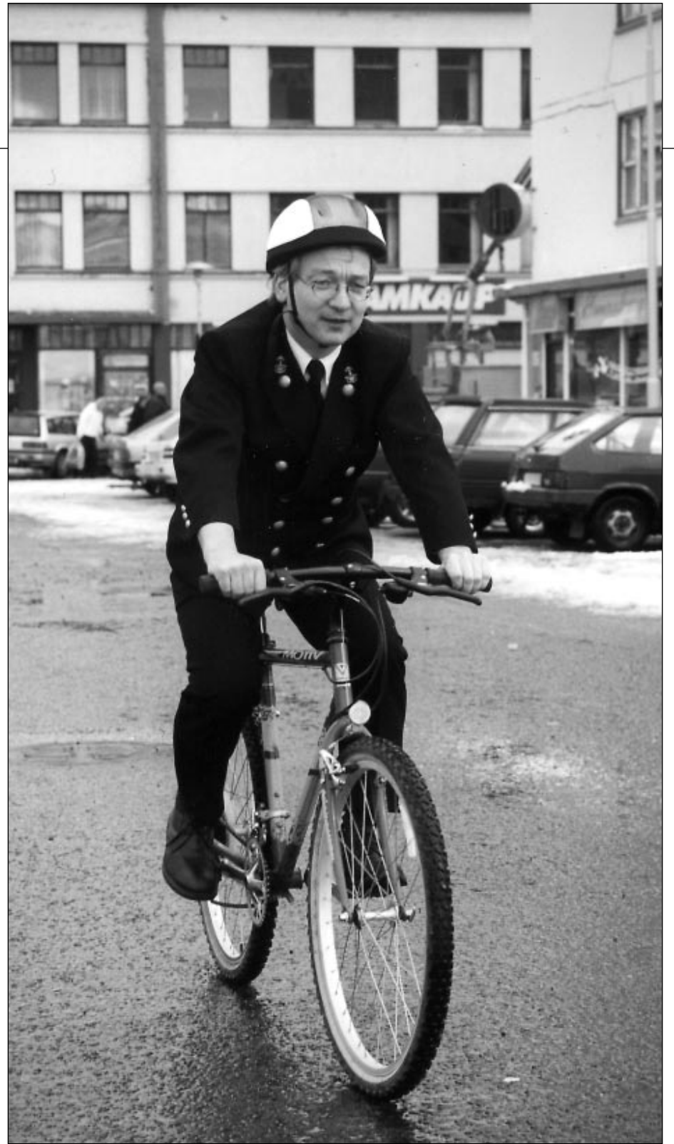
Greinarhöfundur hefur notað hjálm við hjólreiðar í sex ár, eða frá því hann byrjaði aftur að hjóla.