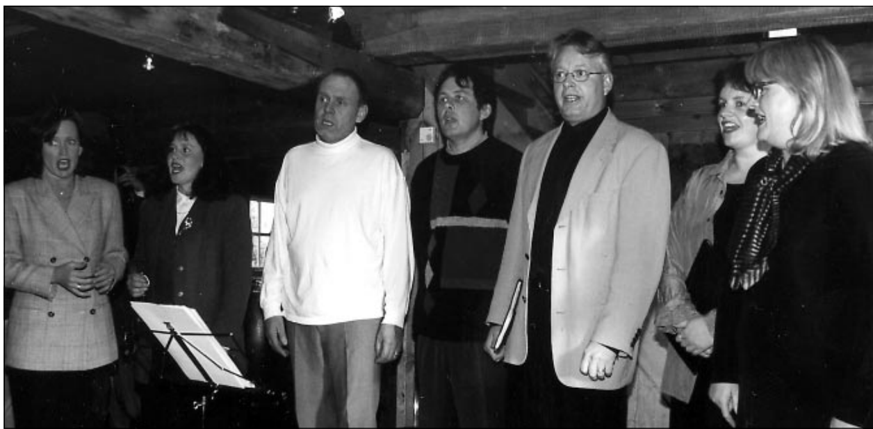
Söngfjlagið úr Neðsta kemur fram á Kaldalóns-tónleikum á menningarvikunni „Veturnætur.“

Erum með nýju línuna frá Aiwa, ótrúlegt verð!