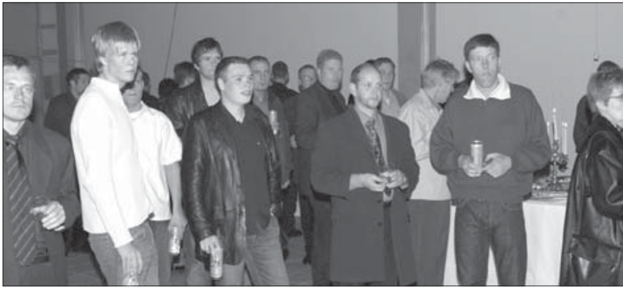
Fjölmenni var á uppskeruhátíðinni.