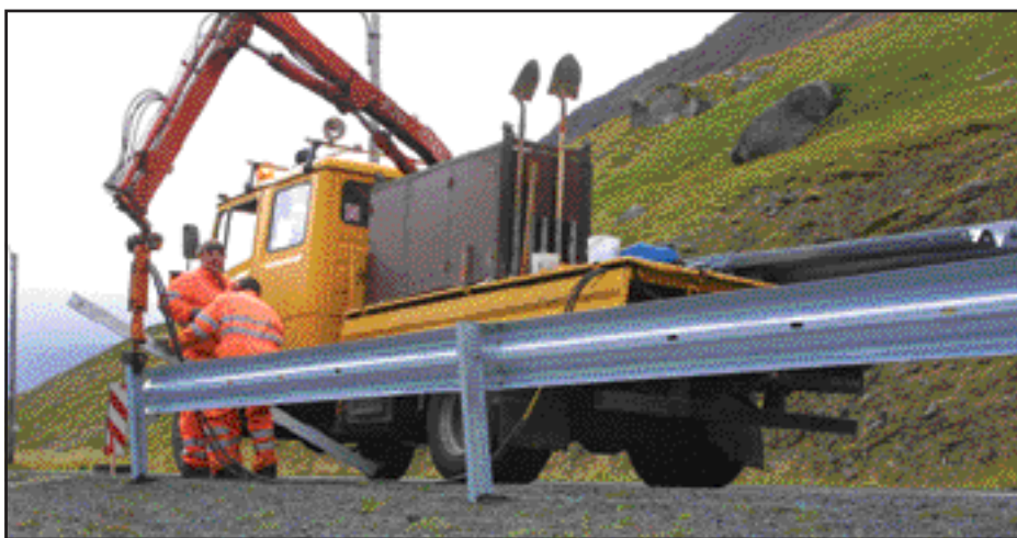
Vegagerðarmenn leggja leiðara á Hnífsdalsvegi.