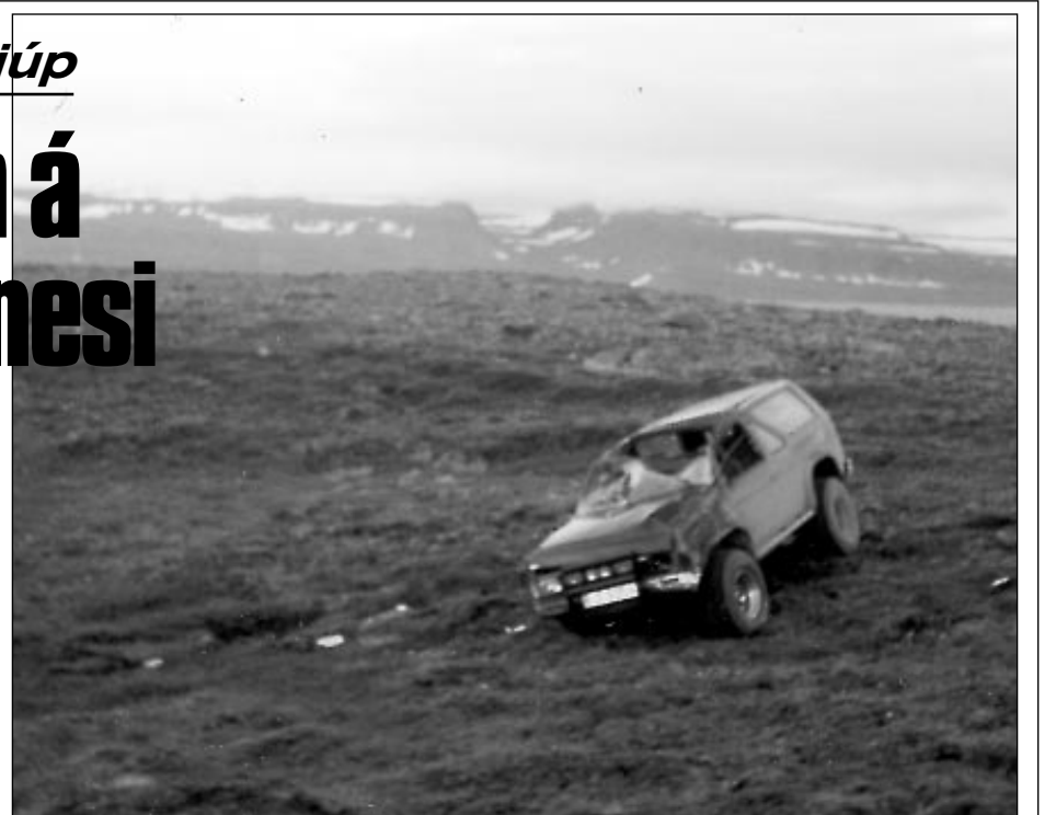
Frá slysstað á Kambsnesi.

Á sunnudagskvöldið valt Nissan Pathfinder jeppi á Kambsnesi, sem er nesið milli Seyðisfjarðar og Álftarfjarðar. Ökumaðurinn var á leiðinni til Ísafjarðar og missti stjórn á jeppanum í lausamöli í krappri beygju sem þarna er, en nýlega hafði verið lagt nýtt slitlag á veginn. Ökumaðurinn slapp ómeiddur frá veltunni, en jeppinn er talinn ónýtur.