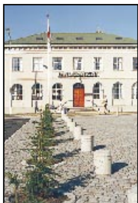
Sól, tuttugu stiga hiti og dauðalogn, eins og sjá má á fánanum.

„Það er algjör hitapottur hérna uppi,“ sögðu strákarnir. „Heyrðu, verðum við kannski á forsíðu BB?“