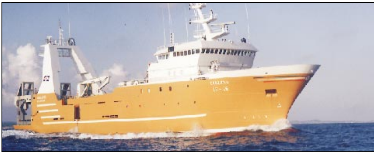
Samherji hf., á Akureyri hefur ákveðið að leigja Guðbjörgu ÍS til þýskra útgerðaraðila.

stjóri í Iðnaðarráðuneytinu mun flytja erindi um hlutverk ráðuneytisins og stuðning þess við iðnaðinn á Vestfjörðum.