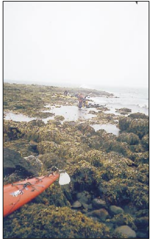
Félagarnir fjórir leggja í hann við Kambsnesið á sunnudag.

ráð. Samkvæmt upplýsingum blaðsins, mun John F. Kennedy hafa komið við í versluninni Gullauga á Ísafirði, þar sem hann festi kaup á gullhring með íslenskum steini handa eiginkonu sinni, Caroline Bessette-Kennedy. Frá Ísafirði héldu þeir félagar til Reykjavíkur og þaðan til heimkynna sinna í Bandaríkjunum.