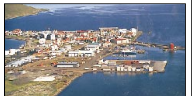
Um tuttugu manns eru atvinnulausir á Ísafirði í dag.

Á sumrin mun Baldur sigla tvær ferðir alla daga vikunnar milli Stykkishólms og Brjánslækjar með viðkomu í Flatey, en á veturna er sigld ein ferð fimm daga vikunnar.