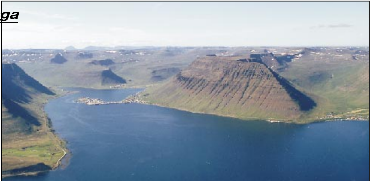
42. Fjórðungsping Vestfirðinga verður haldið í Stjórnsýsluhúsinu á Ísafirði í næstu viku.