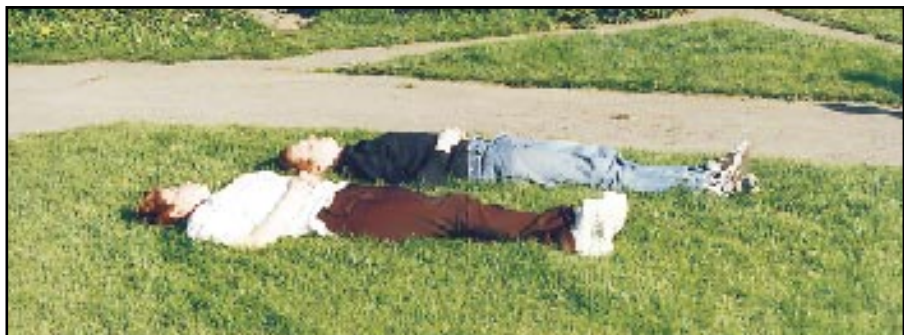
Erum við á Majorca, eða er okkur að dreyma?