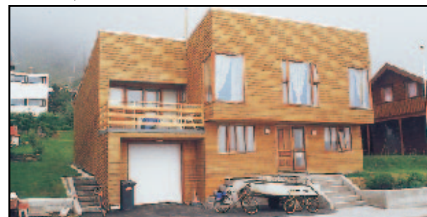
Seljalandsvegur 48: 188m 2 einbýlishús á tveimur hæðum. Verð: 12.700.000,-

Hlíðarvegur 26a: 120m 2 einbýlishús á tveimur hæðum ásamt kjallara. Verð: 6.700.000,- Hlíðarvegur 38: 183,2m 2 raðhús á þremur hæðum. Verð: 9.500.000,- Hlíðarvegur 43: 186m 2 raðhús á þremur hæðum ásamt bílskúr. Verð 10.200.000,- Hlíðarvegur 48: 146,4m 2 einbýlishús í norðurenda á tveimur hæðum. Tilboð óskast. Miðtún 31: 190m 2 endaraðhús í norðurenda á tveimur hæðum. Tilboð óskast. Mjallargata 8: 117,8m 2 einbýlishús á tveimur hæðum ásamt bílskúr.