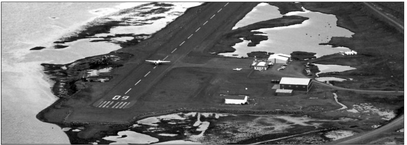
Tvö tilboð bárust í stækkun og breytingar á flugstöðvarbyggingunni á Ísafjarðarflugvelli sem boðin var út fyrir stuttu.

Ferðamannastraumur til Vestfjarða hefur staðið í stað það sem af er sumri miðað við síðasta ár. Íslendingum, sem sótt hafa Vestfirði heim hefur fækkað og sömu sögu er að segja af erlendum ferðamönnum á eigin vegum. Hins vegar hefur hópum erlendra ferðamanna fjölgað nokkuð.