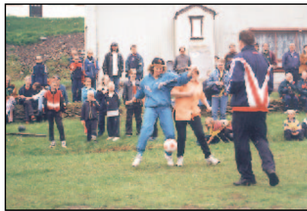
Árviðs viðburður á Sæluhelginni er knattspyrnukeppni milli húsmæðra á staðnum og aðkomu húsmæðra. Aðkomu húsmæður höfðu betur í ár í miklum baráttuleik.