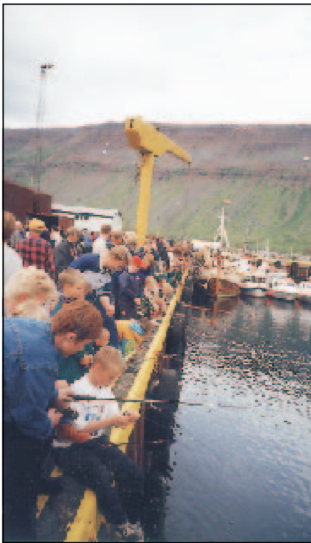
101 krakki á aldrinum 0-12 ára tók þátt í „Mansakeppninni“ að þessu sinni.