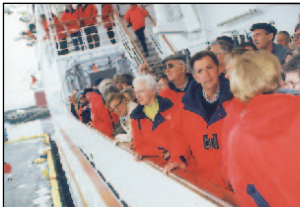
Farþegar um borð í Hanseatic áður en þeim var hleypt frá borði í Sundahöfn.