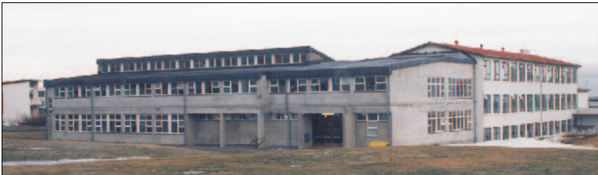
Enn á eftir að manna tvær kennarastöður við Grunnskóla Bolungarvíkur. Svipaða sögu er að segja af öðrum grunnskólum á Vestfjörðum. Ástandið hefur sjaldan verið jafn slæmt.

og hafa þeir vafalaust verið ánægðir með að hafa fast land undir fótum eftir erfitt og viðburðaríkt ferðalag.