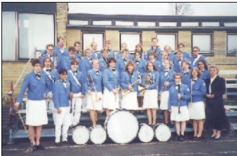
Fjölmargt verður til skemmtunar á hátíðinni, m.a. mun lúðrasveit frá Linköping, vinabæ Ísafjarðar í Svíþjóð, skemmta bæjarbúum og gestum.