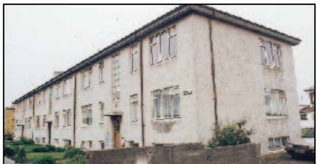
Grundargata 2: 2ja herbergja íbúð á 1. hæð í fjölbýlishúsi. Verð: 3.800.000,-

Hlíf II: 50,4m 2 íbúð á 2. hæð í Dvalarheimili aldraðra. Verð: 6.100.000,- Hlíf II: 50,4 m 2 íbúð á 4. hæð í Dvalarheimili aldraðra. Verð: 5.900.000,- Sundstræti 24: 69m 2 íbúð á jarðhæð í þríbýlishúsi. Sér hiti, rafmagn og inngangur. Mikil uppgerð. Verð: 4.900.000,-