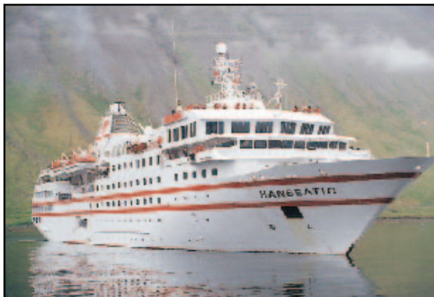
Hanseatic kom til Ísafjarðar á mánudag.