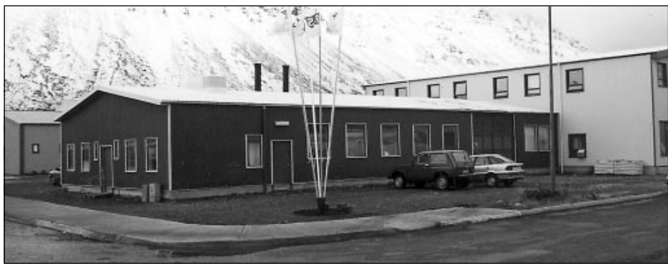
Póls hf., á Ísafirði.