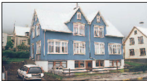
Túngata 3: 53m 2 íbúð á efri hæð í norðurenda. Tilboð óskast.

Laust strax. Verð: 7.400.000,- Silfurgata 9: 150m 2 einbýlishús, 4ra herbergja á tveimur hæðum, ásamt garði, kjallara og geymsluskúr. Verð: 6.800.000,- Stakkanes 4: 144 m 2 raðhús á 2 hæðum ásamt bílskúr og sólstofu. Skipti möguleg á Eyri. Verð: 9.900.000,- Stakkanes 6: 144 m 2 raðhús á tveimur hæðum ásamt bílskúr og sólstofu. Skipti minni eign möguleg. Verð: 10.900.000,- Stekkjargata 29: 93m 2 einbýlishús á tveimur hæðum ásamt bílskúr. Verð: 3.600.000,- Tangagata 6a: 99,7m 2 einbýlishús á tveimur hæðum ásamt litlum kjallara. Verð: 6.800.000,- Urðarvegur 26: 236,9m 2 raðhús á tveimur hæðum ásamt innbyggðum bílskúr. Verð: 11.800.000,- Urðarvegur 58: 209m 2 raðhús á þremur pöllum ásamt innbyggðum bílskúr. Verð: 12.500.000,-