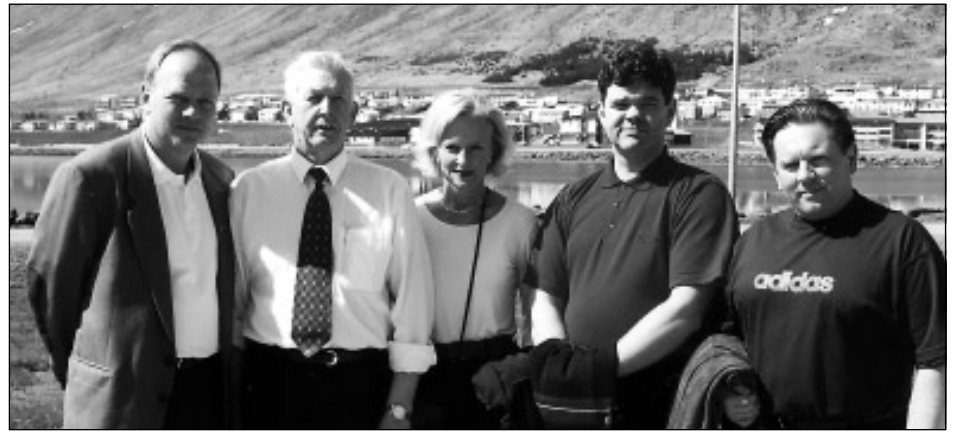
Vinnuhópurinn sem þingflokkur framsóknarmanna skipaði í vetur til að skoða stöðu byggðamála, var á ferð um Vestfirði í síðustu viku og þá var þessi mynd tekin.