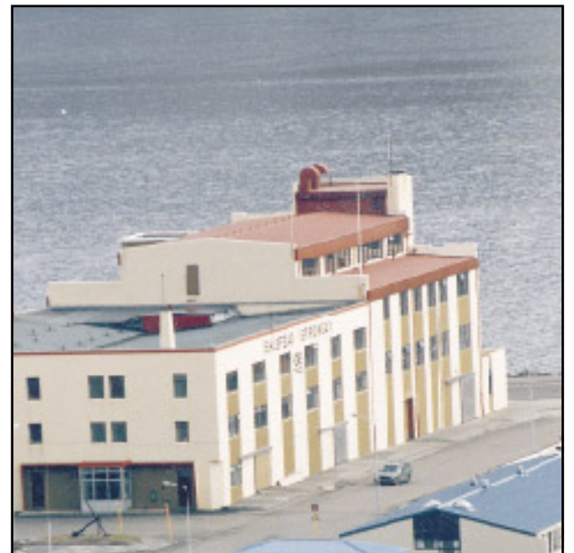
Íshúsfélag Ísafjarðar hf.