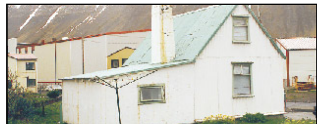
Sundstræti 11: 74m 2 einbýlishús á tveimur hæðum ásamt kjallara. Verð: 3.400.000,-