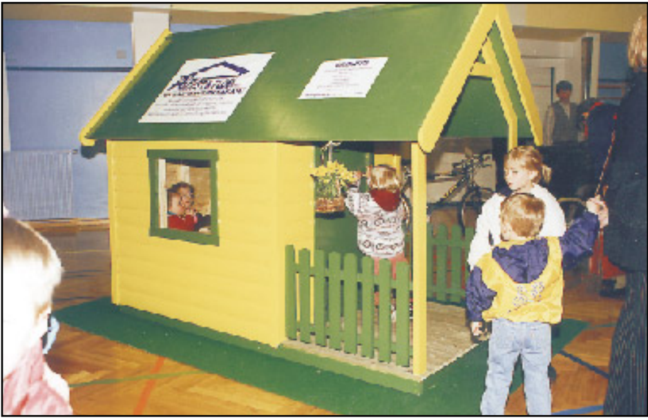
Yngri kynslóðin kunnir vel að meta þetta litla hús sem smíðað er af fyrirtækinu Ágústi og Flosa ehf. á Ísafirði.