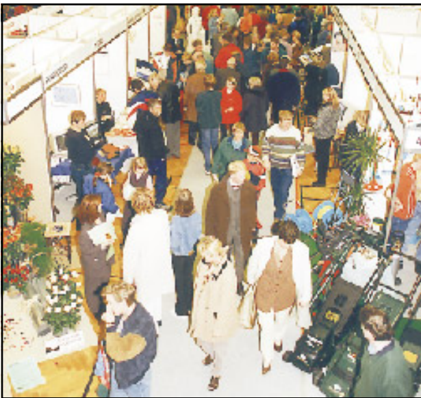
Um 5000 manns sóttu sýninguna þá tvo daga sem hún stóð yfir.