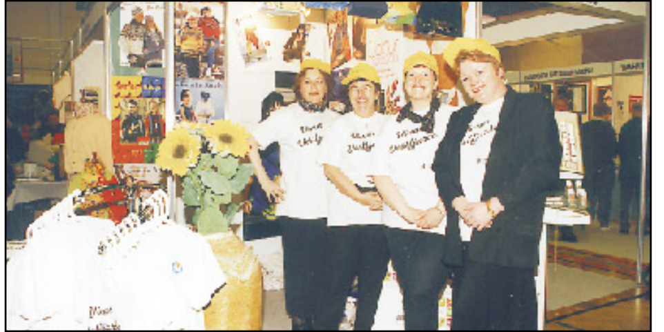
Verslanirnar Leggur og Skel, Krisma og Jón og Gunna sameinuðust um sýningarbás og hér má sjá eigendur og starfsfólk við hann.

Ljósmyndari blaðsins var staddur í íþróttahúsinu á Torfnesi um helgina og tók þá þessar myndir sem sýna brot af því sem í boði var.