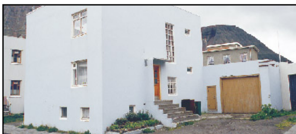
Fjarðarstræti 13: 80m 2 íbúð á efri hæð í tvíbýlishúsi, tvö aukaherbergi í risi og kjallara. Verð 5.700.000,-