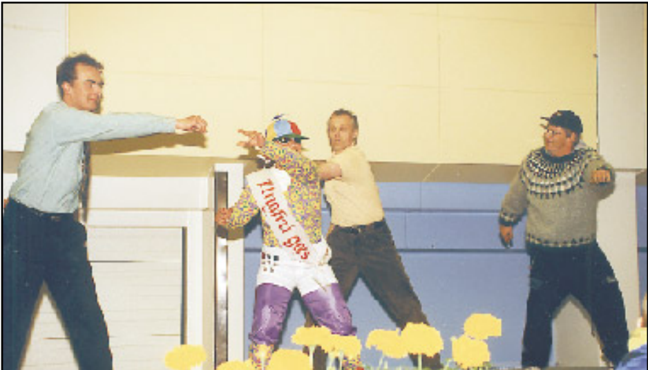
Ungfrú gæs var að halda upp á síðustu daga sína utan hjónabands og fékk af því tilefni nokkra sýningargesti til að stíga létt dansspor með sér.