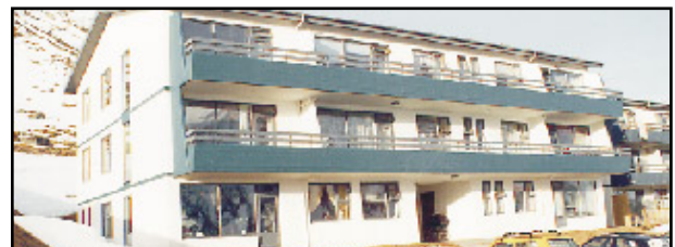
Urðarvegur 80: 82m 2 íbúð á jarðhæð í fjölbýlishúsi ásamt sér geymslu. Verð 6.800.000,-