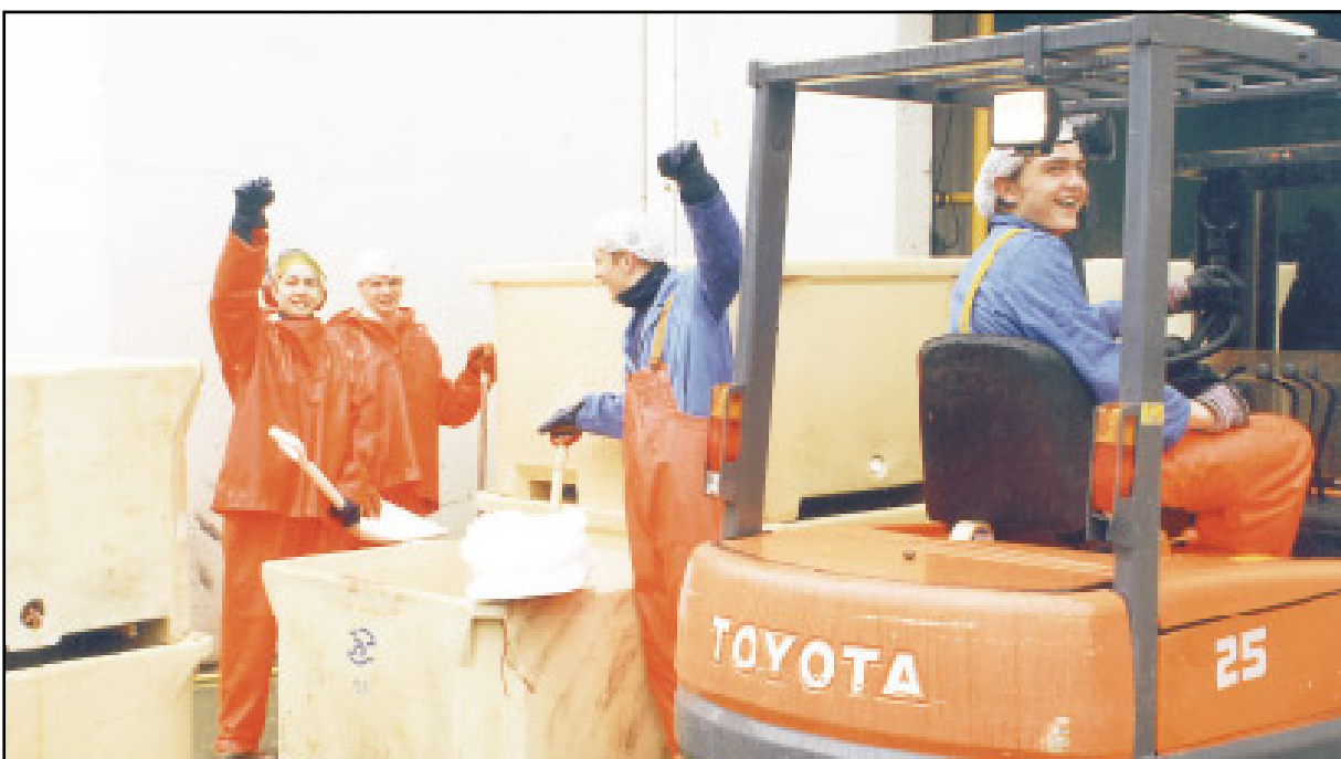
Starfsmenn Básafells hf. voru glöðir í bragði á mánudagsmorgun þegar vinna hófst að nýju eftir sjö vikna verkfall.

gagngerar endurbætur, en hann ætlar að nota Moby Dick, eins og skipið heitir nú, til hvalaskoðunar frá Húsavík. Djúpbáturinn hf. lét smíða skipið árið 1963 en seldi það til Akraness á síðasta ári.