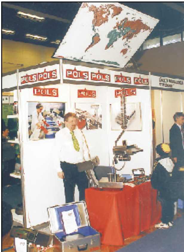
Póls var eitt af athyglisverðari fyrirtækjum á sýningunni, en það sérhæfir sig m.a. í smíði á vogum til notkunar í fiskiðnaði.