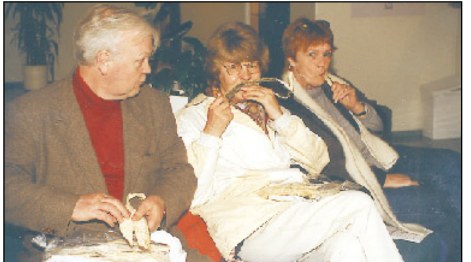
Vestfirski harðfiskurinn er eftirsóttur um land allt og hann rann ljúflega niður hjá þessum sýningargestum.