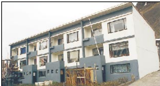
Hlíðarvegur 43: 186m 2 raðhús á þremur hæðum ásamt bílskúr. Verð 10.200.000,-