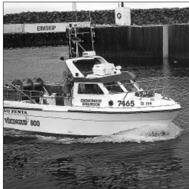
Nýi báturinn er óneitanlega glæsilegur farkostur.