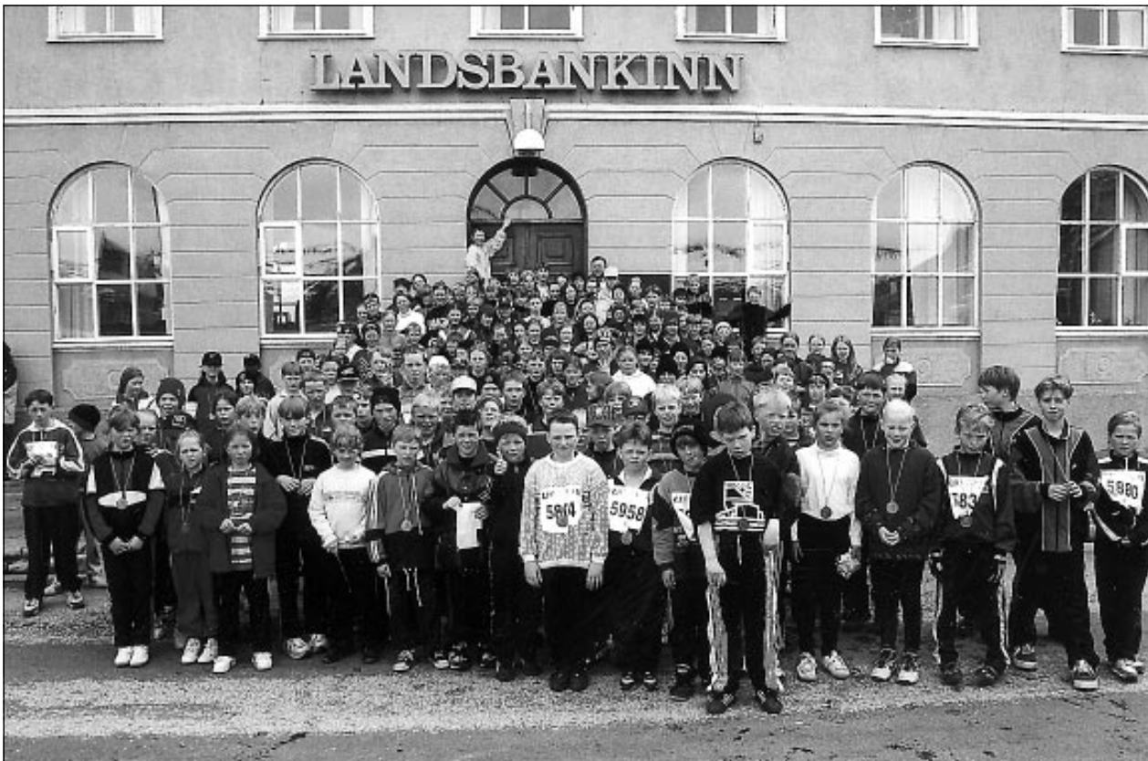
Þátttakendur fyrir framan Landsbankann á Ísafirði að afloknu velheppnuðu hlaupi.