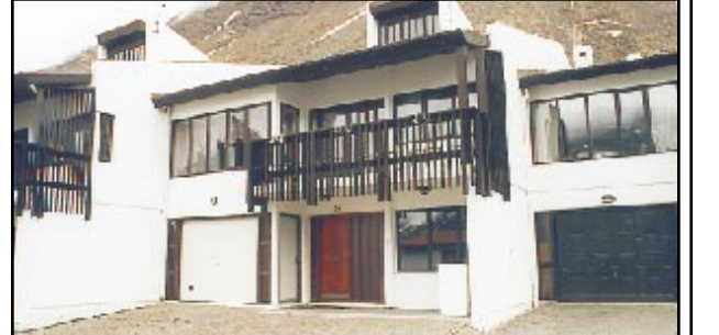
Urðarvegur 58: 209m 2 raðhús á þremur pöllum ásamt innbyggðum bílskúr. Verð: 12.500.000,-