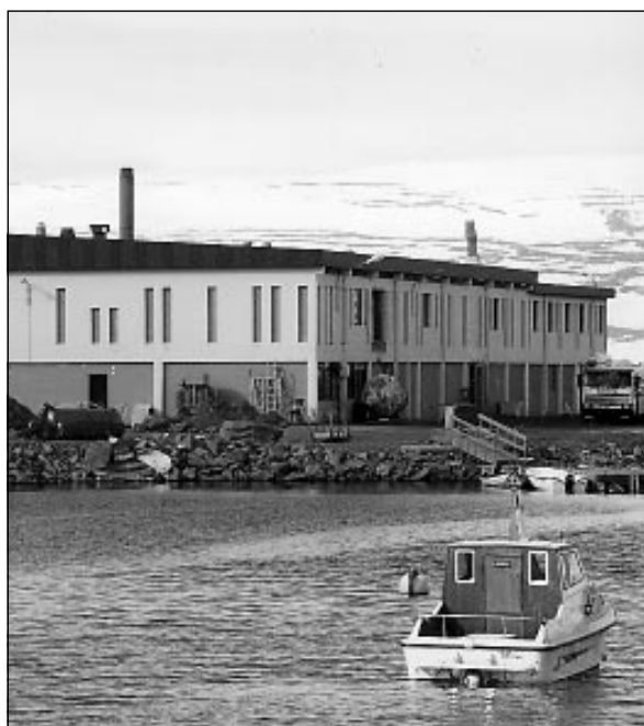
Frosti hf. í Súðavík.