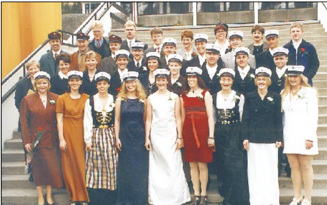
Hópur nemenda sem brautskráðist frá Framhaldsskóla Vestfjarða á laugardag.