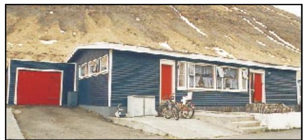
Bakkavegur 23: 133,8m 2 einbýlishús á einni hæð ásamt 34,9m 2 bílskúr. Verð kr. 8.900.000,-