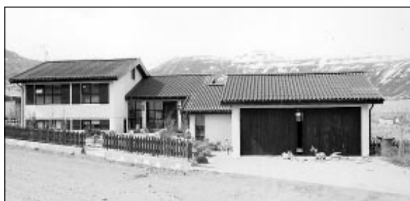
Stummholt 1: Eitt glæsilegasta einbýlishúsið í bænum. 277m 2 ásamt 40m 2 bílskúr. Verð 15.500.000,-

tvöflöðum bílskúr. Íbúðin er laus. Verð: 3.600.000,- Silfurtorgi 11: 3ja herbergja íbúð á 1. hæð. Verð: 4.000.000,- Stórholt 11: 3ja herbergja íbúð á 3. hæð fyrir miðju. Laus. Verð 4.300.000,- Strandgata 7: Þetta hús er nú til sölu á aðeins kr. 6.500.000,- Pólgata 4: 5 herbergja íbúð á 3. hæð. Verð: 3.600.000,- Urðarvegur 60: Glæsilegt raðhús, alls rúmlega 200m 2 , ásamt bílskúr. Skiptiá minni eign á eynimikomatil greina. Tilboð.