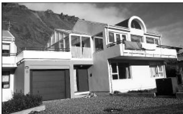
Stakkanes 6: Rúmlega 140m 2 raðhús ásamt bílskúr og sólstofu. Verð 11.500.000,-