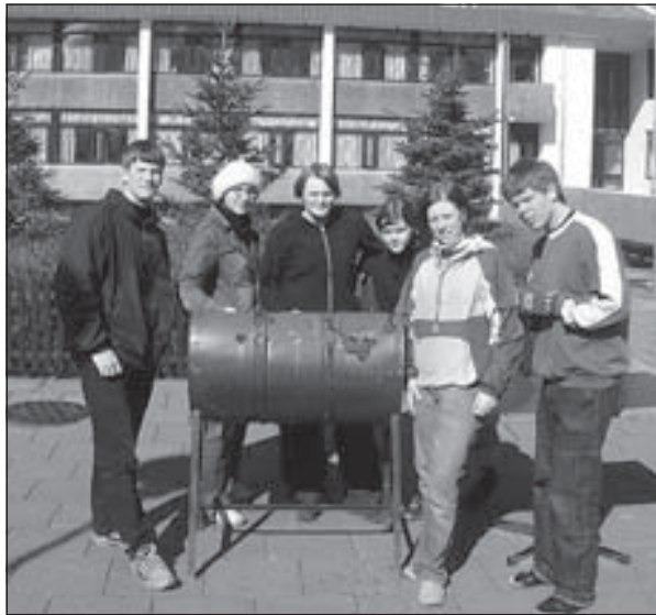
Menntskælingar hópast fullir eftirvæntingar um grillið.

Það var glatt á hjalla hjá nemendum Menntaskólans á Ísafirði í hádeginu á föstudag, er nemendafélag skólans bauð félagsmönnum sínum upp á grillveislu og sumarhátíð í tilefni vorkomunnar. Þó svo að sólin hafi skinið á unglíngana þurfti að hætta við að bjóða þeim upp á vatnskælingu í kari þar sem kalt er í veðri. Þrátt fyrir vonbrigði nemendanna með að geta ekki hreinsað af sér uppsafnaðan vetrarskítinn, létu þeir það ekki á sig fá og skófluðu pylsum hratt og örugglega í sig milli þess sem þeir léku sér í hefðbundnum sumarleikjum. Nú hefur vetur konungur kynnt sig á nýjan leik og þá er bara spurning um að endurtaka grillveisluna.