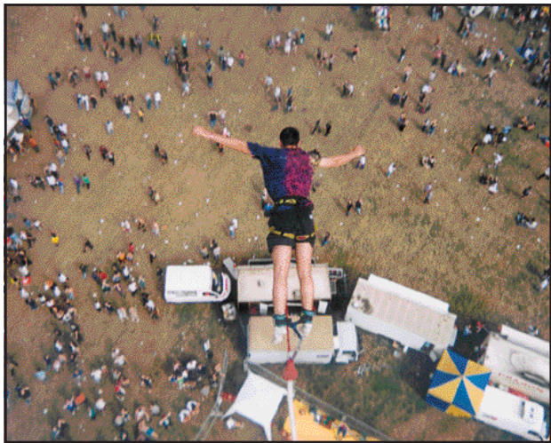
Myndin Teygjustökk hlaut fyrstu verðlaun í ljósmyndasamkeppni Bókhöðunnar á Ísafirði, Nýherja hf. og bb.is. Myndin er tekin í Englandi árið 1997.

skal getið að hægt verður að skoða myndirnar í keppninni inn á ljósmyndavef bb.is eftir að ný keppni er hafin. Dagana 2. og 3. maí nk. munu fulltrúar frá Nýherja hf. kynna nýjustu stafrænu myndavélarnar frá Canon í Bókhöðunni á Ísafirði og eru allir áhugamenn um nýjustu tækni í ljósmyndun hvattir til að líta til sérfræðinganna og kanna hvað í boði er fyrir næstu keppni.