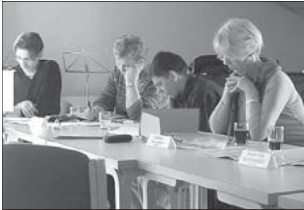
Frá fundinum í Bolungarvík.

Var fundurinn haldinn í Safnaðarheimilinu í Bolungarvík og hófst kl. 13 á föstudag og stóð til kl. 17 en um kvöldið var fundarmönnum boðið til kvöldverðar í Faktorshúsinu á Ísafirði. Fundurinn hélt síðan áfram kl. 10 á laugardagsmorgun og stóð fram undir kl. 17 en um kvöldið var síðan