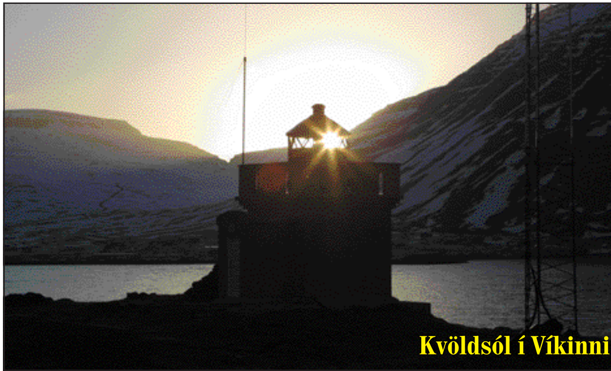
Kvöldsól í Víkinni

Það er Náttúrustofa Vestfjarða sem hefur umsjón með smíði líkansins.