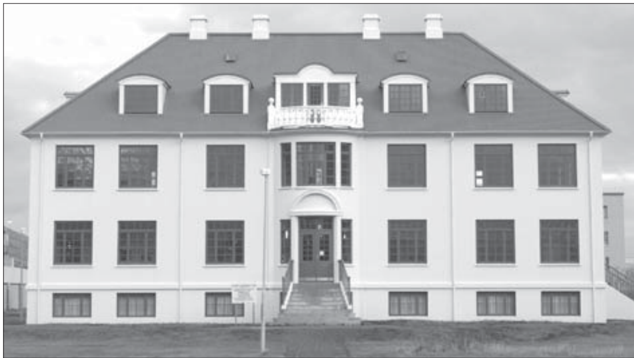
Safnahúsið í Ísafjarðarbæ.

Blaðið notar fast form fyrir aðsendar greinar og í þessu tilviki gleymdist að setja inn nýja tilvitnun. Beðist er afsökunar á þessu mistökum.