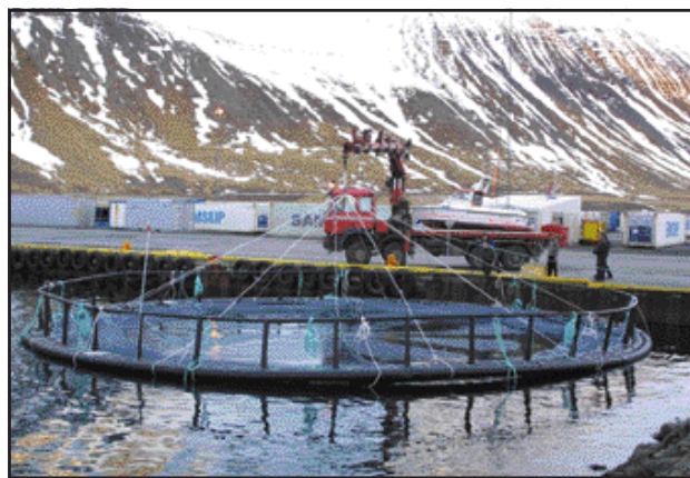
Frá sjósetningu kvíarinnar í Sundahöfn.

„Það gekk afar vel að sjósetja kvínnu og sömuleiðis hefur gengið vel að smíða kvíarnar og hanna. Við sáum fram á mikinn samdrátt í þjónustuverkefnum þennan veturinn, en þessi verkefni hafa komið okkur mjög til góðs hvað slíkt varðar. Það fóru til