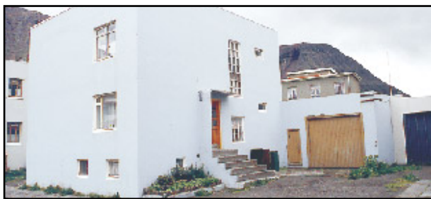
Fjarðarstræti 13: 80m 2 íbúð á efri hæð í tvíbýlishúsi, tvö aukaherbergi í risi og kjallara. Verð 5.900.000,-

Verð: 7.000.000,- Miðtún 31: 190m 2 endaraðhús í norðurenda á tveimur hæðum. Tilboð óskast. Silfurgata 9: 150m 2 einbýlishús, 4ra herbergja á tveimur hæðum, ásamt garði, kjallara og geymsluskúr. Tilboð óskast. Skipagata 11: 78 m 2 einbýlishús á tveimur hæðum. Tilboð óskast. Stakkanes 4: 144 m 2 raðhús á 2 hæðum ásamt bílskúr og sölstofu. Skipti möguleg á Eyrinni. Verð: 9.900.000,- Stakkanes 6: 144 m 2 raðhús á tveimur hæðum ásamt bílskúr og sölstofu. Skipti minni eign möguleg. Verð: 10.900.000,- Strandgata 3: 130,5m 2 einbýlishús á tveimur hæðum ásamt geymsluskúr. Verð 3.500.000,- Urðarvegur 26: 236,9m 2 raðhús á tveimur hæðum ásamt innbyggðum bílskúr. Verð: 11.800.000,-