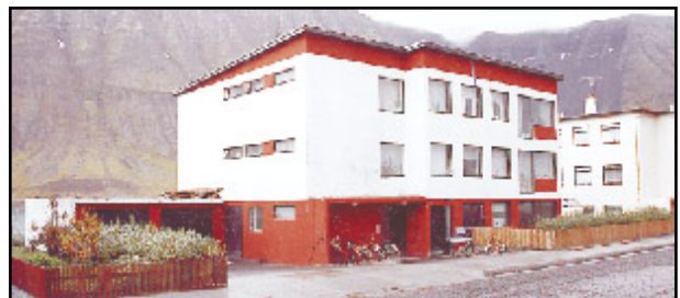
Sundstræti 24: 69m 2 íbúð á jarðhæð í þríbýlishúsi. Íbúðin er mikil uppgerð. Verð: 5.200.000,-

Aðalgata 3: Einbýlishús á tveimur hæðum ásamt bílskúr og ræktaðri lóð. Verð 2.600.000,- Aðalgata 38: 108m 2 einbýlishús á einni hæð ásamt geymslu, kjallara og bílskúr. Verð 2.000.000,- Eyrargata 6: 280m 2 einbýlishús á tveimur hæðum. Verð: 10.000.000,- Hlíðarvegur 10: 90m 2 3ja herbergja íbúð á neðri hæð í tvíbýlishúsi ásamt hálfum bílskúr. Tilbúin undir tréverk, þó íbúðarhæf. Tilboð óskast Sættún 1: 180m 2 einbýlishús á einni hæð ásamt bílskúr. Verð: 5.700.000,- Túngata 12: 140m 2 einbýlishús á einni hæð ásamt bílskúr. Tilboð óskast.