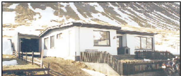
Dalbraut 13: 120,7m 2 einbýlishús á einni hæð ásamt bílskúr. Verð: 9.500.000,-

óskast. Hafraholt 14: 144,4m 2 raðhús á tveimur hæðum, ásamt bílskúr. Verð: 9.500.000,- Heiðarbraut 6: 133,3m 2 einbýlishús á einni hæð ásamt bílskúr. Verð: 10.700.000,- Hjallavegur 19: 242m 2 einbýlishús á tveimur hæðum ásamt innbyggðum bílskúr. Skipti á minni eign möguleg. Verð: 12.700.000,- Hlíðarvegur 26a: 120m 2 einbýlishús á tveimur hæðum ásamt kjallara. Verð: 6.700.000,- Hlíðarvegur 38: 183,2m 2 raðhús á þremur hæðum. Verð: 9.500.000,- Hlíðarvegur 48: 146,4m 2 einbýlishús á þremur pöllum, mjög falllegt útsýni.