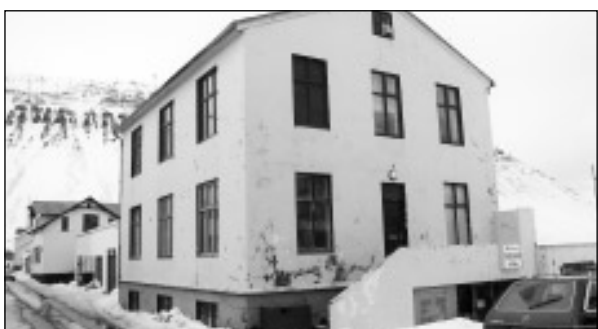
Fjarðarstræti 14: 95m 2 sérhæð í tvíbýlishúsi ásamt 2/3 hluta kjallara og geymsluskúr. Tilboð óskast.

Urðarvegur 60: Glæsilegt raðhús, alls rúmlega 200m 2 , ásamt bílskúr. Skipti á minni eign á eyrinni koma til greina. Tilboð.