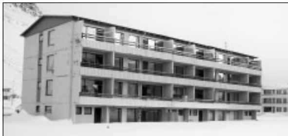
Stigahlíð 2 og 4: 2ja og 3ja herbergja íbúðir.