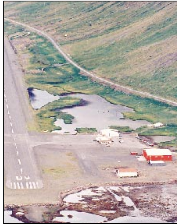
Flugstöðvarbyggingin á Ísafjarðarflugvelli verður stækkuð í sumar.

Guðbjörn segir ekki tímaþætt að greina í smáatriðum frá fyrirhugaðri stækkun vegna þess að endanlegar ákvarðanir hafi ekki verið teknar. Hann segir þó ljóst að verkið verði boðið út í sumar og framkvæmdir í framhaldi af því.