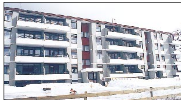
Fjarðarstræti 4: 120m 2 4ra herbergja íbúð á 3. hæð í fjölbýlishúsi. Verð kr. 6.500.000,-

Silfurgata 6: verslunarhúsnæði á neðri hæð í tvíbýlishúsi í hjarta bæjarins. Verð: 5.000.000,-