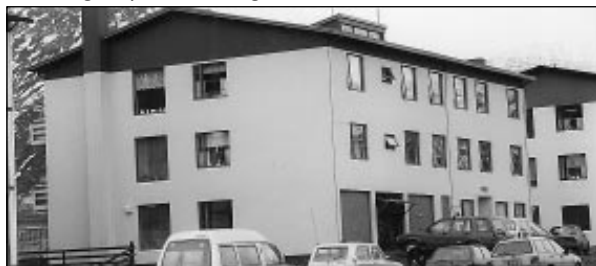
Stórholt 11: 3ja herbergja íbúð á 3. hæð fyrir miðju. Laus. Verð 4.300.000,-

Urðarvegur 60: Glæsilegt raðhús, alls rúmlega 200m 2 , ásamt bílskúr. Skipti á minni eign á eyrinni koma til greina. Tilboð.