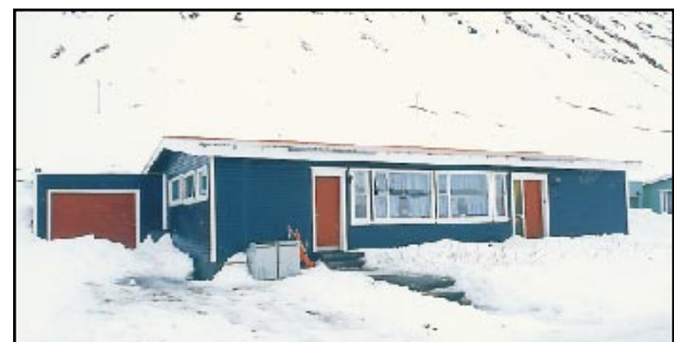
Bakkavegur 23: 133,8m 2 einbýlishús á einni hæð ásamt bílskúr. Verð kr. 8.900.000,-

tveimur hæðum, ásamt bílskúr. Verð: 9.500.000,- Heiðarbraut 6: 133,3m 2 einbýlishús á einni hæð ásamt bílskúr. Verð: 10.700.000,- Hjallavegur 19: 242m 2 einbýlishús á tveimur hæðum ásamt innbyggðum bílskúr. Skipti á minni eign möguleg. Verð: 12.700.000,- Hlíðarvegur 26a: 120m 2 einbýlishús á tveimur hæðum ásamt kjallara. Verð: 6.700.000,- Hlíðarvegur 38: 183,2m 2 raðhús á þremur hæðum. Verð: 9.500.000,-