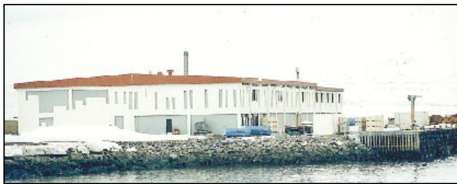
Frosti hf., í Súðavík er eitt þeirra fyrirtækja sem eiga í viðræðum við Hraðfrystihúsið hf., í Hnífsdal um hugsanlega sameiningu.