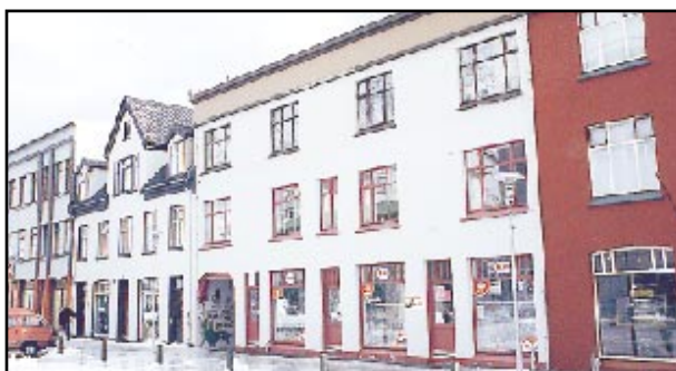
Hafnarstræti 6: 158m 2 5 herbergja íbúð á 3. hæð í fjölbýlishúsi. Tilboð óskast

Miðtún 31: 190m 2 endaraðhús í norðurenda á tveimur hæðum. Tilboð óskast. Skjapagata 11: 78 m 2 einbýlishús á tveimur hæðum. Tilboð óskast. Stakkanes 4: 144 m 2 raðhús á 2 hæðum ásamt bílskúr og sólstofu. Skipti möguleg á Eyrinni. Verð: 9.900.000,- Stakkanes 6: 144 m 2 raðhús á tveimur hæðum ásamt bílskúr og sólstofu. Skipti minni eign möguleg. Verð: 10.900.000,- Strandgata 3: 130,5m 2 einbýlishús á tveimur hæðum ásamt geymsluskúr. Verð 3.500.000,- Urðarvegur 26: 236,9m 2 raðhús á tveimur hæðum ásamt innbyggðum bílskúr. Verð: 11.800.000,-