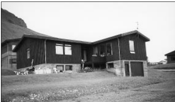
Ljósaland 6: 2x126m 2 einbýlishús. Hagstæð lán. Verð: 4.000.000,-