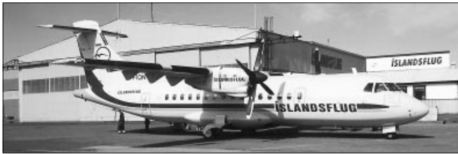
ATR 42 flugvél Íslandsflugs.

Félagið flýgur áætlunarflug til tíu staða hér á landi og rekur umsvifamikið leiguflug, bæði innanlands og utan, einkum til Grænlands. Félagið flutti 53 þúsund farþega á síðasta ári og hafa þeir aldrei verið fleiri. Á síðasta ári tók félagið í notkun nýja flugvél af gerðinni ATR 42, sem var hrein viðbót við flugflota félagsins. Með tilkomu hennar þrefaldaðist rým-