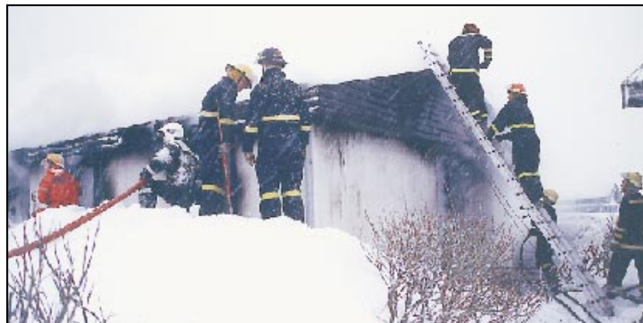
Frá slökkvistarfinu í Bolungarvík á páskadagsmorgun.

„Hins vegar er heimild í lögum til að miða bótageiðslur við markaðsverð ef um kaup á sambærilegu notuðu húsnæði er að ræða en ef tjónþoli vill byggja nýtt sambærilegt hús, þá er kostnaður við það greiddur að fullu.“