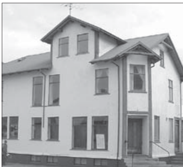
Gamla Apótekið á Ísafirði.

Dagskrá Skíðavíkingu Ísfirðinga er nú að mestu fullmótuð þó svo að enn eigi eftir að tímasetja nokkra dagskrárliði. Helsta nýjungin að þessu sinni er Skíðavíkinguútlit sem sent verður út á FM 101.0 í samstarfi við Gamla Apótekið. Þar munu valinkunnir Vestfirðingar skipta með sér verkum og halda úti öflugri dagskrárgerð um Skíðavíkinguna milli kl. 17-19 daglega á meðan hátíðinni stendur. Einnig verður fljótlega opnuð ný heimasíða Skíðavíkingunnar þar sem nýjustu upplýsingum um dagskrárliði verður komið á framfæri jafnóðum og þær berast.