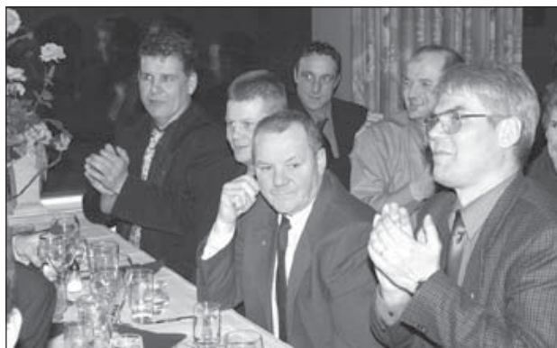
Fjölmenn var á kúttmagakvöldinu sem haldið var á Hótel Ísafirði.

Þá ræddu menn reynsluheim karlmannsins, hugmyndafræði karlmennskunnar og eflingu hennar í baráttunni gegn þeim fordómum sem hvarvetna mætir henni nú á tímum. Allt fór þetta fram undir röggsamri stjórn Halldórs Jónssonar, veislustjóra kvöldsins. Ljósmyndari blaðsins kom við á Kúttmagakvöldinu og tók þar meðfylgjandi myndir.