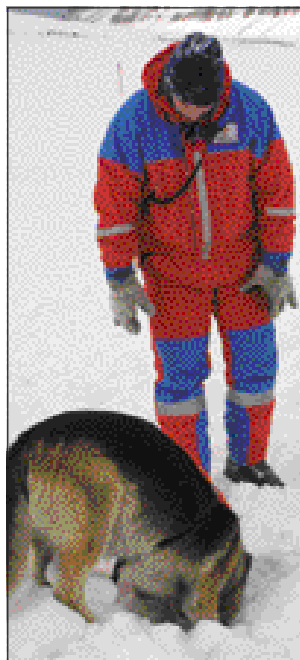
Leitarhundur að störfum.