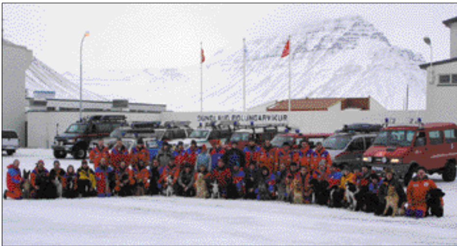
Hópurinn sem tók þátt í námskeiðinu.

Ellefu hundar þreyttu próf í C-stigi sem er byrjandastig, níu hundar voru prófaðir í B-stigi, sem er framhaldstig, og tíu hundar voru prófaðir í A-stigi en það eru hundar á útkallslista sem kallaðir eru út til leitar hvar sem er á landinu. Á sunnudaginn fór síðan fram björgunaræfing í tengslum við námskeiðið og var hún haldin í samvinnu við Björgunarsveitina Erni í Bolungarvík og Björgunarfélag Ísafjarðar, auk átta hunda sem voru á A-stigs námskeiði.