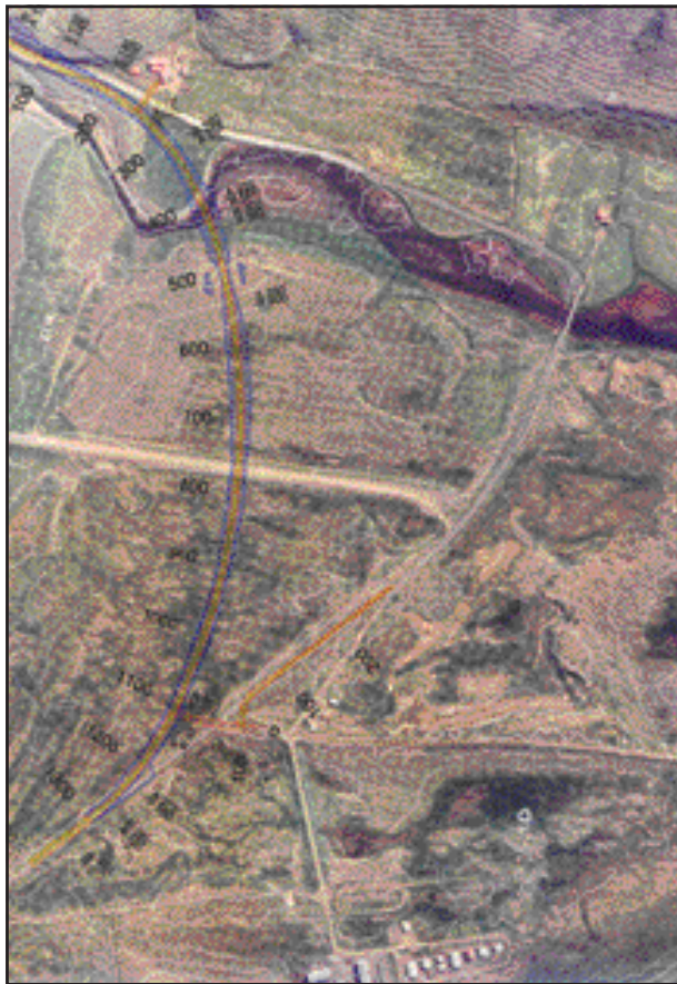
Loftmynd af svæðinu.

nesinu neðan við bæinn Neðri-Ós. Þá verður lagður nýr vegur í tengingu við brúna, um 1,2 km að lengd, ásamt tengingu við Syðridalsveg. Gamla brúin yfir Ósá er einbreið og var byggð árið 1949. Framkvæmdin mun stytta vegalengdina á milli Bolungarvíkur og Ísafjarðar nokkuð og fjarlægja vinkilbeygju við bæinn Efri-Ós.