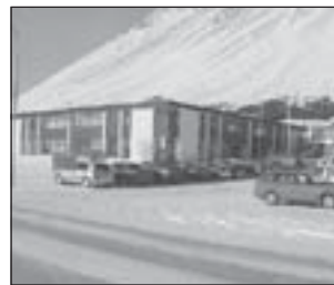
Menntaskólinn á Ísafirði.

verkefnavinnu starfshópa og viðburðum yfir skólaárið 2002-2003 sem margir utan- aðkomandi aðilar munu koma að með ýmiss konar ráðgjöf og aðstoð.