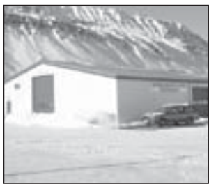
Nýtt aðsetur Hjólbarðaverkstæðis Ísafjarðar er að Sindragötu 14.

Hæstiréttur staðfesti dóm héraðsdóms á þeirri forsendu að skólastjóri grunnskólans hafi ekki falið áfrýjanda að fara í umrædda ferð. Þá segir í dómnum að ekki verði litið öðruvísi á en að nemendurnir hafi sjálfir, í skjóli lögráðamanna sinna, átt að bera alla fjárhagslega ábyrgð af ferðakostnaði en sveitarfélagið greiddi tveimur kennurum laun á meðan á ferðinni stóð.