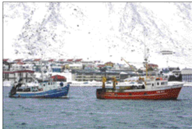
Bára ÍS-66 dregin inn á Ísafjarðarhöfn.