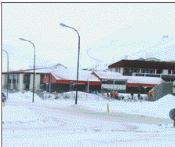
Menntaskólinn á Ísafirði.

ans í ár sem uppbót og umbun vegna bættar rekstrarstöðu. Mun skólinn því byrja fjárlagaárið með sex milljónir í forgjöf sem þýðir að staðan hefur vænkast um 14 milljónir frá því sem var um þarsíðustu áramót.