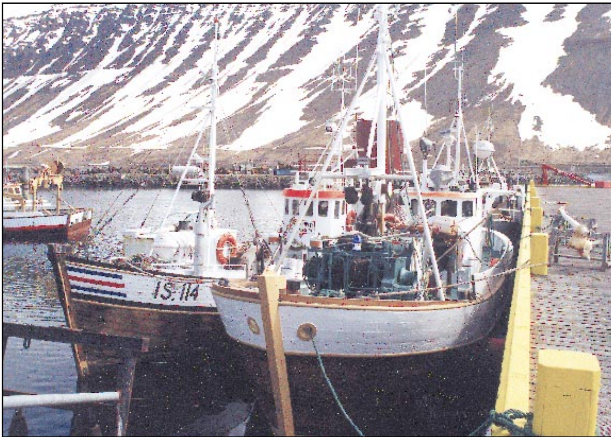
Rækjubátar sem stunda veiðar í Ísafjarðardjúpi höfðu veitt rúmlega helming kvótans þann 10. janúar sl.

Frosta hf., í Súðavík. Aflahæsti rækjubáturinn til þessa er Aldan ÍS 47 frá Ísafirði með 90,4 tonn, þá kemur Halldór Sigurðsson ÍS-14 með 77,5 tonn, þá Örn ÍS-18 með 76,8 tonn, þá Gunnvör ÍS-53 með 72,7 tonn og fimmti aflahæsti rækjubáturinn er Stundvís ÍS-883 með 62,8 tonn. Framangreindar tölur eru fengnar frá Hafrannsóknastofnun á Ísafirði og miðast við 10. janúar síðastliðinn.