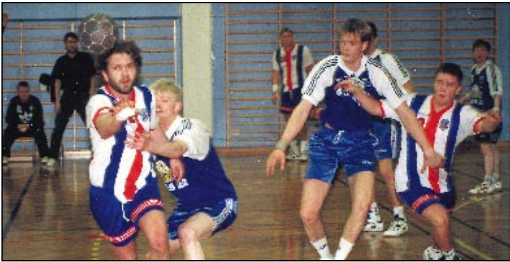
Frá leik Harðar og Ögra í íþróttahúsinu á Torfnesi á sunnudag.