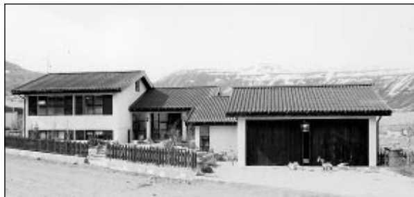
Sunnuholt 1: Eitt glæsilegasta einbýlishúsið í bænum. 277m 2 ásamt 40m 2 bílskúr. Verð 15.500.000,-