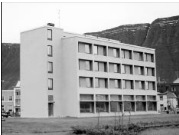
Hótel Ísafjörður hefur ákveðið að efna til vestfirskis þorablóts í samvinnu við þrjá aðra aðila.

léttur dans við undirleik harmonikkú-hljómsveitar. Í frétt frá Hótel Ísafirði segir að þorra verði blótað í þjóðlegum stíl, með trogi á borðum, fullu af hákarli, harðfiski, súrmat, sviðum og fleira góðgæti sem tilheyrir þessum árstíma. Miðasala og upplýsingar um þorablótið fást á Hótel Ísafirði.