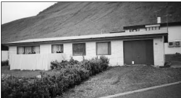
Traðarland 10: Einbýlishús ásamt bílskúr.