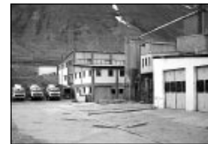
Bílagarður verður til húsa að Grænararði á Ísafirði.

verður í fyrstu einungis boðið upp á nýjar bifreiðar en áætlanir standa til að hefja sölu á notuðum bílum innan eigi langs tíma. Viðgerðarþjónusta fyrir bifreiðar frá Heklu verður áfram sem hingað til hjá Bílaverksæði Sigurðar og Stefáns á Ísafirði.