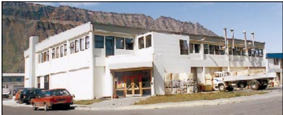
Stjórnendur Básafells hf. á Ísafirði hafa ákveðið að loka rækjuvinnslu fyrirtækisins við Sindragötu 7 á Ísafirði vegna hráefnisskortis.

Stofnað 14. nóvember 1984 • Sími 456 4560 • Fax 456 4564 • Netfang: bb@snerpa.is • Verð kr. 200 m/vsk