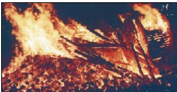
Gamla árið fudrar upp eins og öll hin.