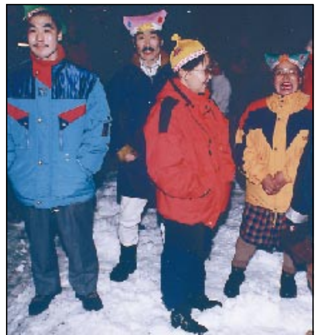
Ekki voru þeir allir barnfæddir Hnífsdælingar sem skemmtu sér við brennuna á gamlárskvöld.

Það logaði glatt í áramótabálkestinum í Hnífsdal á gamlárskvöld og bæjarbúar sungu við bálíð svo undir tók í fjöllum. Veður var gott til brennu og söngs, eins og meðfylgjandi myndir ættu að sýna.