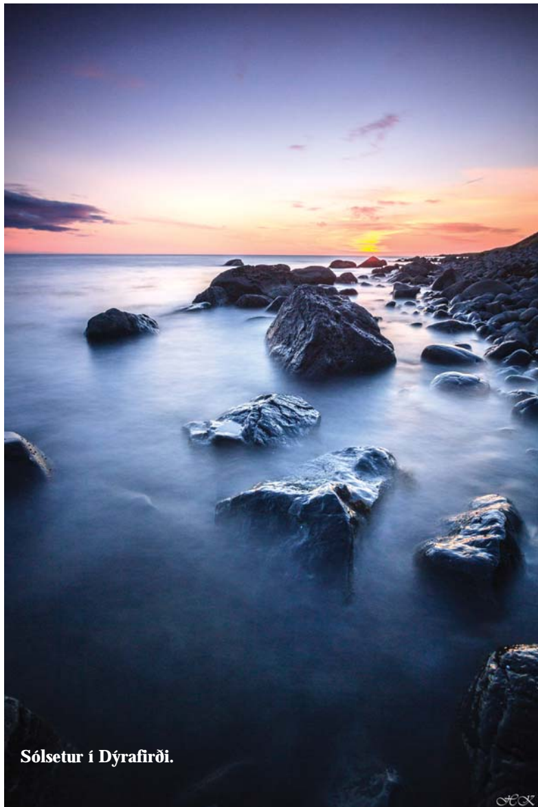
Sólsetur í Dýrafirði.