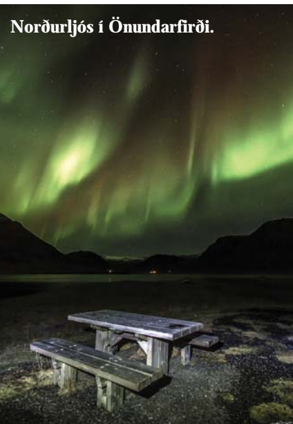
Norðurljós í Önundarfirði.