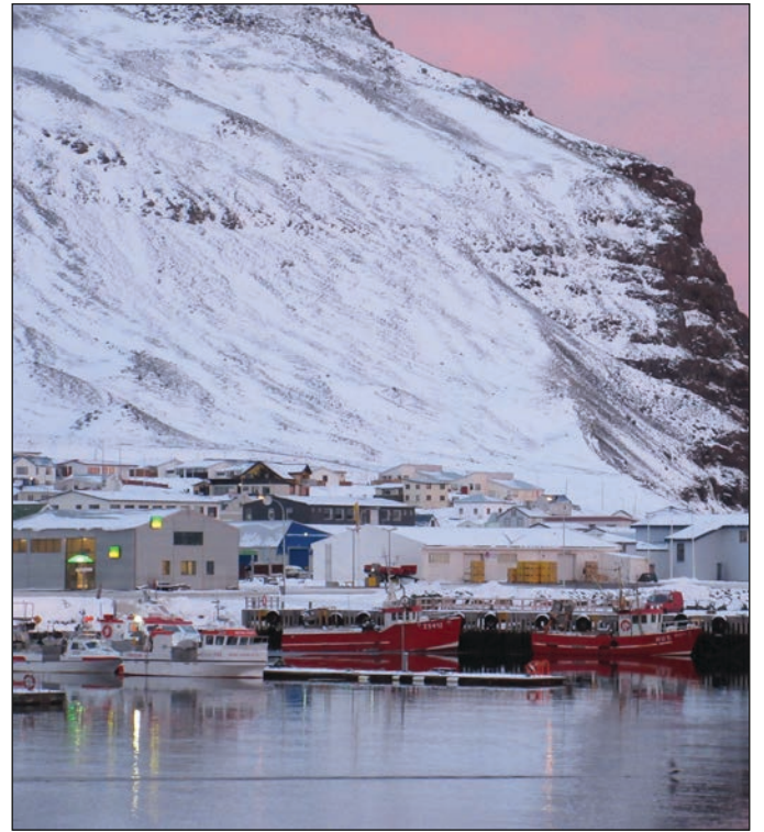
Frá Bolungarvík.