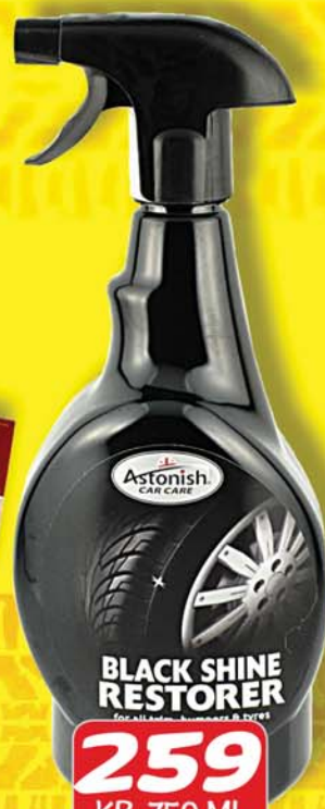
259 KR. 750 ML ASTONIS DEKKJAHREINSIR