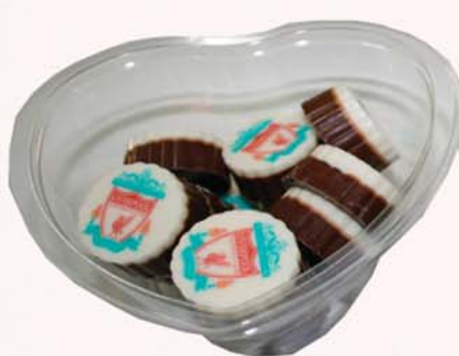
Hannaðu þitt konfekt með þinni mynd eða þínum texta, 15 molar á aðeins 1.500 kr.