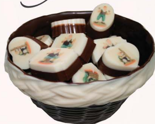
Lítill súkkulaðikarfa með 25 molum 4.000 kr.