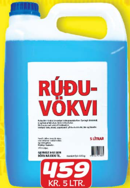
5 LÍTRAR RÚÐUVÖKVI -9 GRÁÐUR