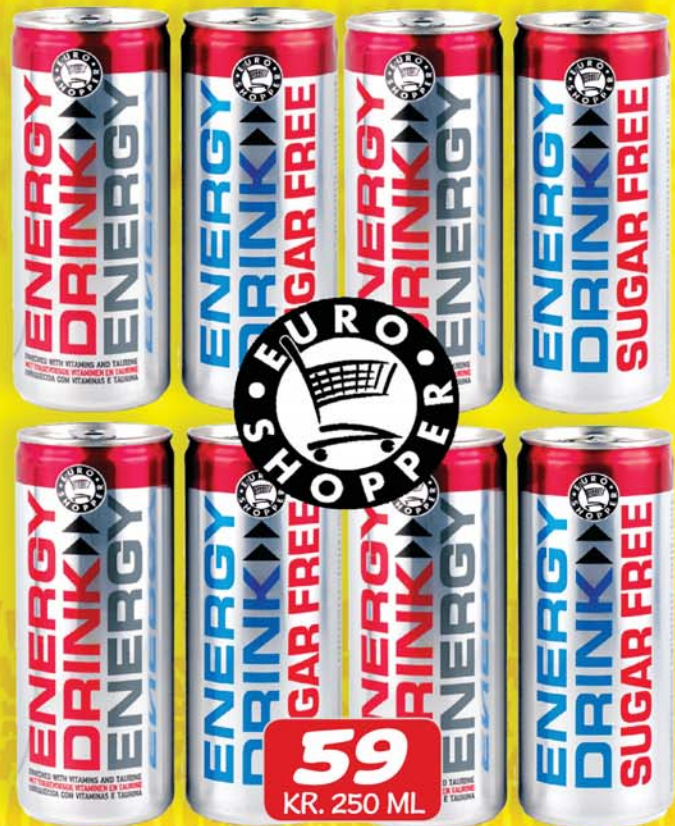
59 KR. 250 ML EUROSHOPPER ORUDRYKKUR 250 ML.