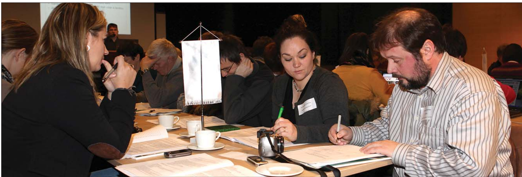
Frá aukapiingum Fjórðungssambands Vestfirðinga.