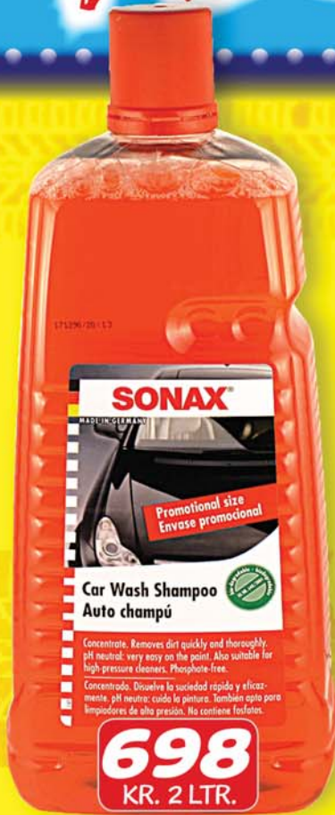
SONAX BÍLASÁPA 2 LTR.