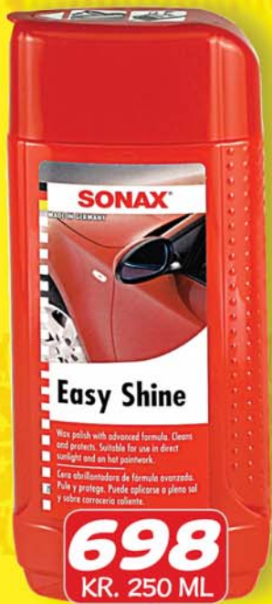
SONAX BÍLABÓN 250ML