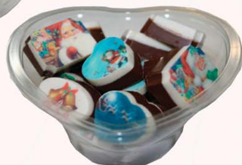
Jólaöskjur með 15 molum með blönduðum jólamyndum á 1.200 kr.