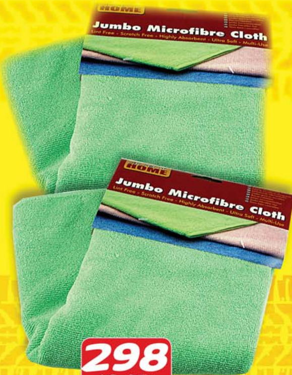
298 KR. STK ÖRTREFJA STÓR BÓNKLÚTUR