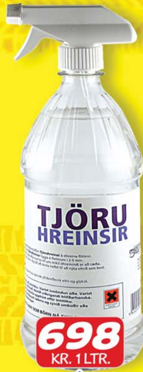
1 LÍTRI TJÖRUHREINSIR