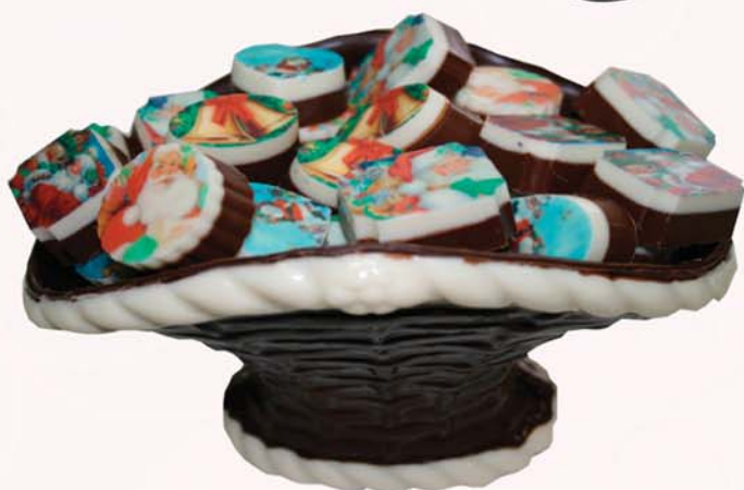
Stór súkkulaðikarfa með 30 molum 5.000 kr.