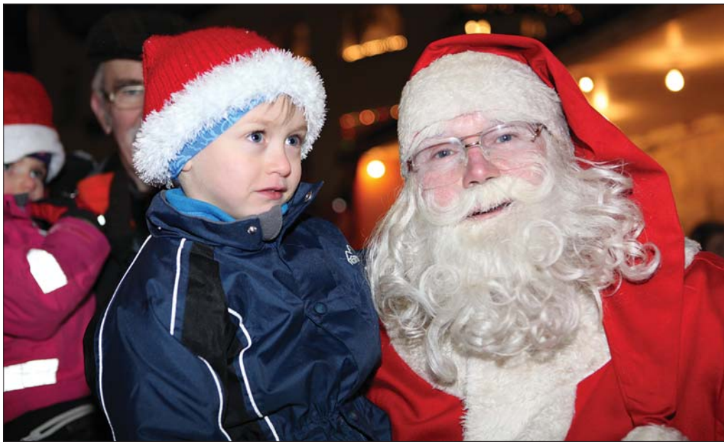
Jólasveinar brugðu á leik með börnunum.