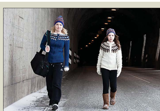
Frá gerð myndarinnar.

Þess má geta að vestfirsk ferðaþjónusta hefur farið vaxandi undanfarin misseri og má þar nefna sem dæmi að tímabilið er sífellt að lengjast. Margt spennandi er framundan svo sem fyrsta uppskeruhátíð Ferðamálasamtakanna sem haldin verður að Núpi í Dýrafirði á laugardag.