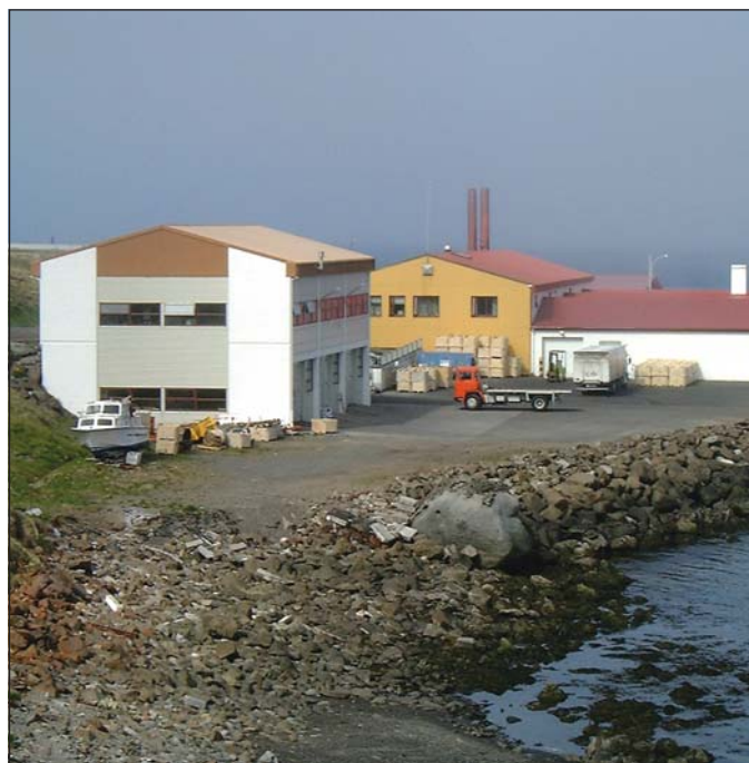
Hraðfrystihúsið Gunnvör í Hnífsdal.

fyrirstöðu að krafist væri ógildingar eða riftunar á samkomulagi um einstaka láns hluta en ekki samninginn í heild. Hins vegar skorti verulega á að í stefnu væri gerð nægileg grein fyrir því hver væri grundvöllur kröfu um ógildingar eða riftun. Samkvæmt samkomulagi HG hf. og Landsbankans hefur lánið verið fært niður en vegna bankaleyndar fæst ekki uppgefið hve stór hluti þess var afskrifaður. — asta@bb.is