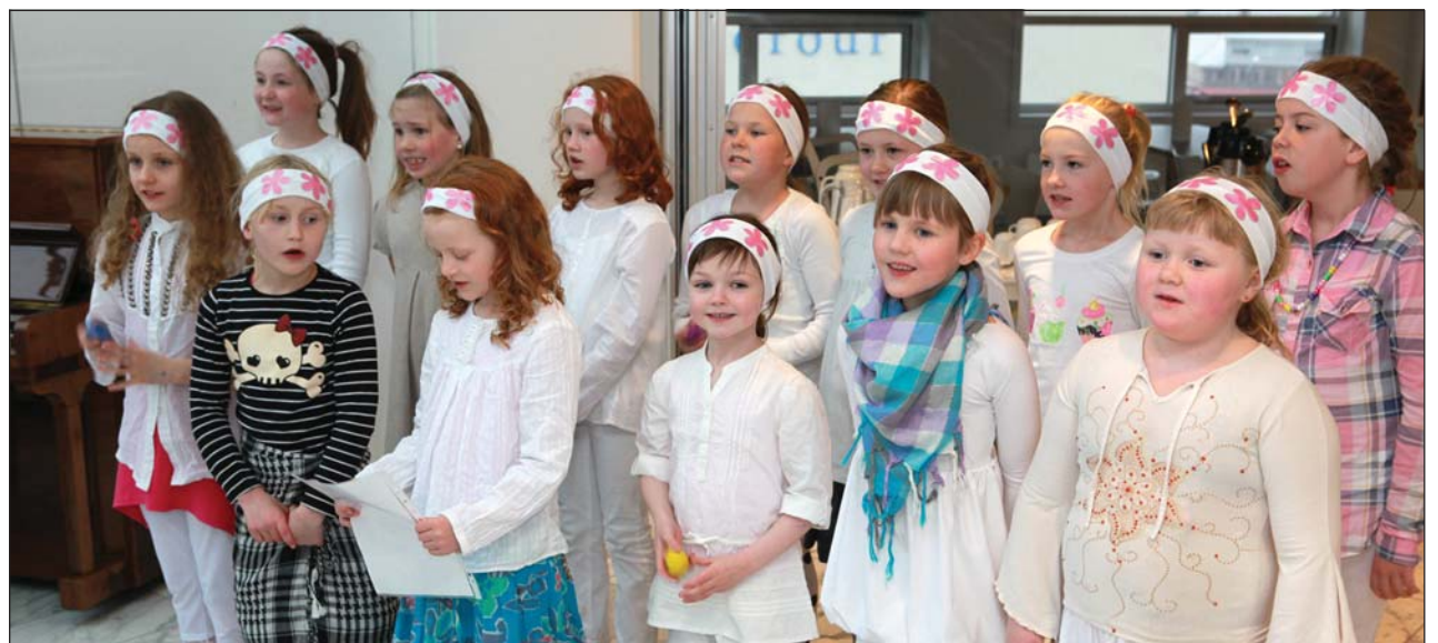
Barna- og stúlnakór TÍ söng fyrir gesti.