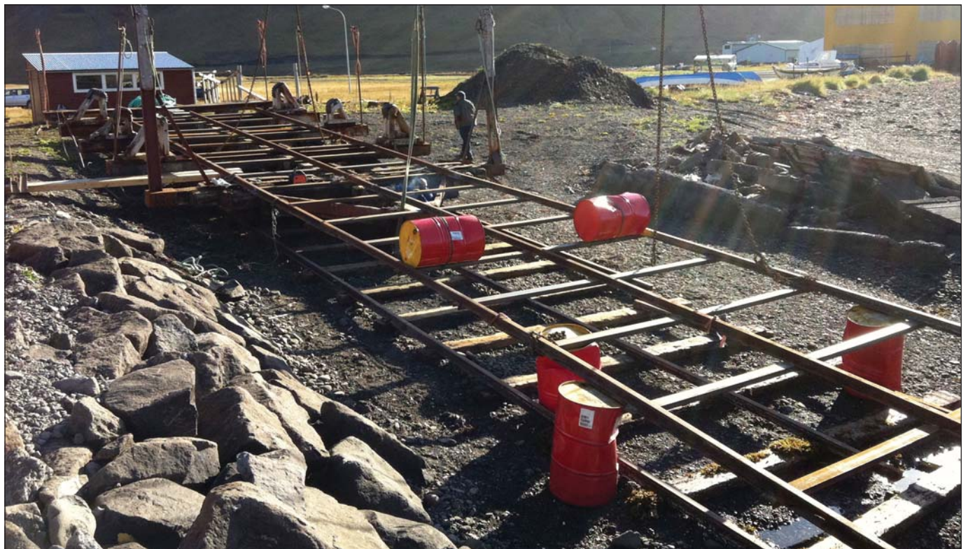
Viðgerðir á Bárðarslipp hafa staðið yfir síðan í sumar.