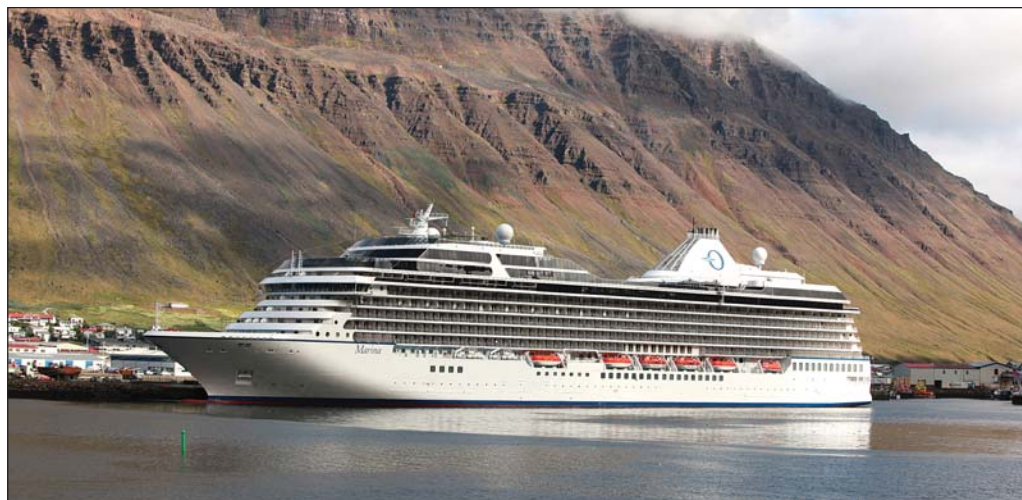
Vestfirsk ferðaþjónusta fer stigvaxandi.