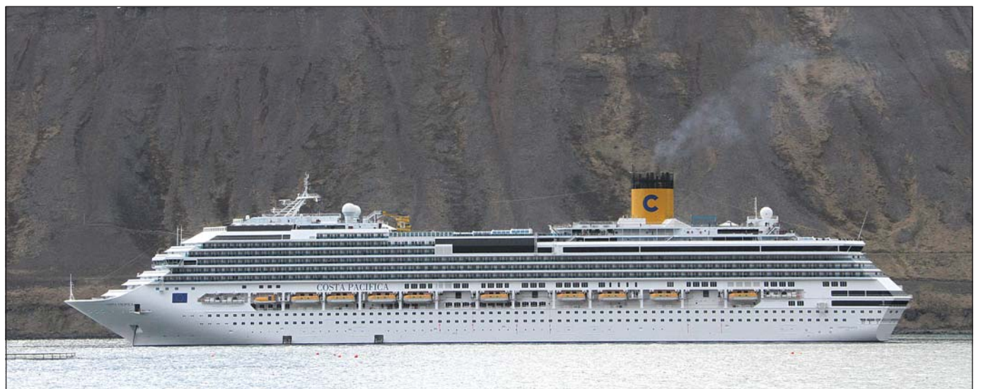
Fjöldi skemmtiferðaskipa til Ísafjarðar hefur þrefaldast á tæpum áratug.