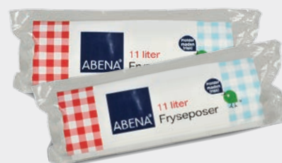
PLASTPOKAR - MARGAR GERÐIR