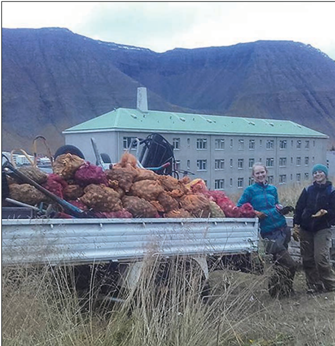
Um hálft tonn af kartöflum kom upp úr görðum Gróanda í ár.

Mikil stemning var í grænmetisgörðum Gróanda þegar boðað var til uppskerudags. Vaskir Gróanda-liðar tóku til hendinni og hreinsuðu upp úr görðunum allt sem mátti og var uppskera þessa fyrsta starfsárs með miklum ágætum er um það