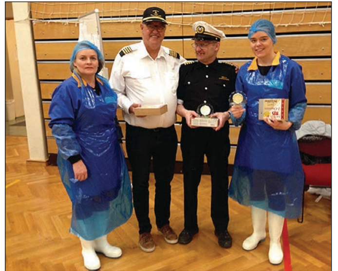
Þau hömpuðu sigri: Lið HG1 fyrir búninga og lið Ísafjarðarhafnar fyrir liðsheild.