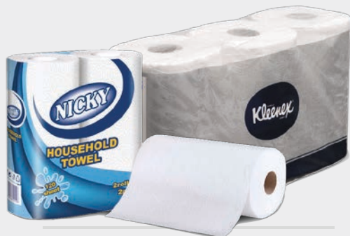
WC-PAPPÍR OG ELDHÚSRÚLLUR