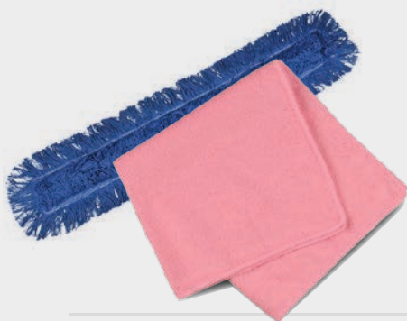
GÓLFKLÚTAR OG TUSKUR