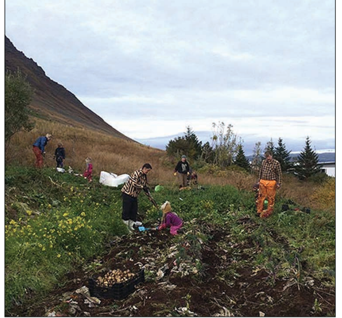
Góð stemning var á Gróandasvæðinu er félagsmenn á öllum aldri unnu við uppskeruna.