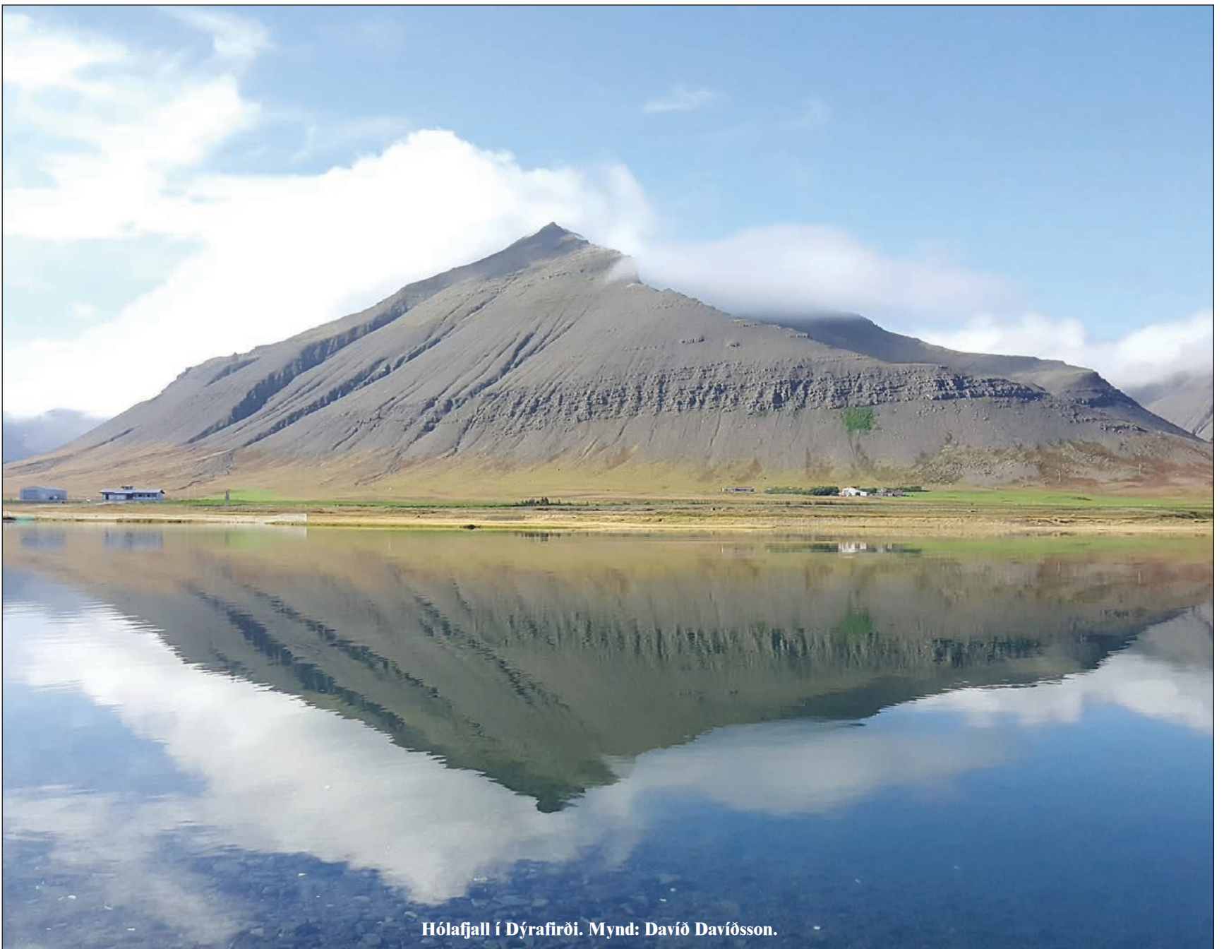
Hólafjall í Dýrafirði.

Stofnað 14. nóvember 1984 · Fimmtudagur 13. október 2016 · 38. tbl. · 33. árg. · Ókeypis eintak