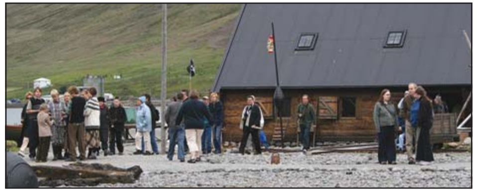
Byggðasafnið í Neðstakaupstað.