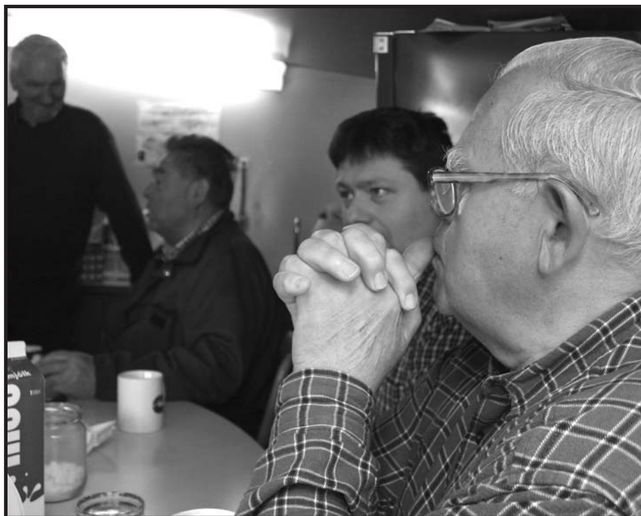
Garðar hlustar af andakt.