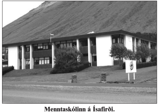
Menntaskólinn á Ísafirði.