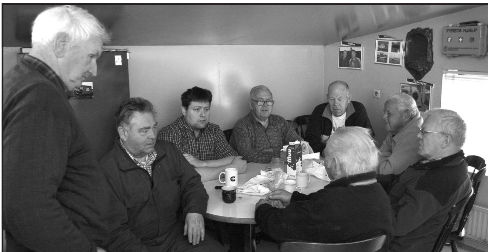
Kafað ofan í kvótakerfið og lagt á ráðin með Tælandsferð.

Netspurningin er birt vikulega á bb.is og þar geta lesendur látið skoðun sína í ljós. Niðurstöðurnar eru síðan birtar hér.