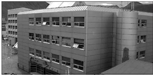
Stjórnarsýsluhúsið á Ísafirði.

Lista- og menningarhátíðin Veturnætur verður haldin í Ísafjarðarbæ í tíunda sinn dagana 25.-28. október. Hátíðin var fyrst haldin árið 1997 en var endurvakin fyrir fjórum árum og hefur hún síðan verið fastur liður í mannlífni á svæðinu í kringum vetrardaginn fyrsta. Menningarmálanefnd Ísafjarðarbæjar heldur utan um Veturnætur en hátíðin var upphaflega einkaframtak öflugis áhugahóps sem unnið hefur að menningar- og ferðamállum á Ísafirði.