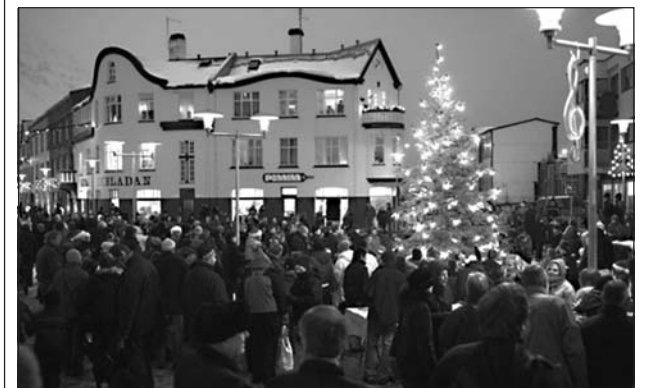
Jólatré frá Hróarskeldu hafa prýtt Silfurtorg yfir jólahátíðina undanfarin ár.