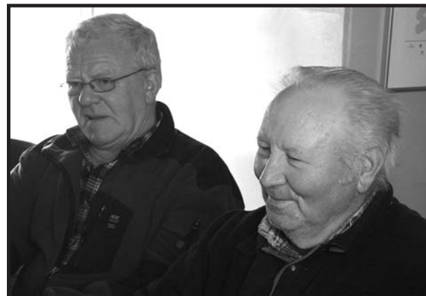
Ólarnir tveir. Annar kenndur við málerið hinn við Árbæ.