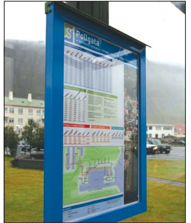
Mikið var lagt í smáatriði á skiltinu.