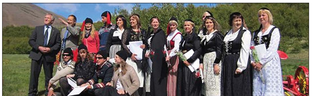
Útskriftarhópur Háskólaseturs Vestfjarða í útskriftinni á Hrafnseyri fyrr í sumar.