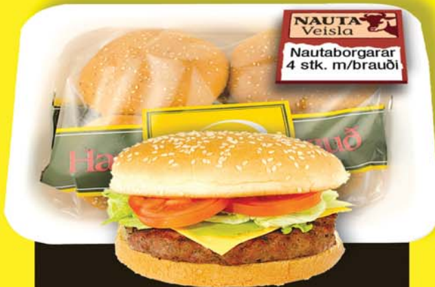
FERSKIR NAUTAVEISLU 4 STK. NAUTGRIPAHAMBORGARAR MED BRAUÐI