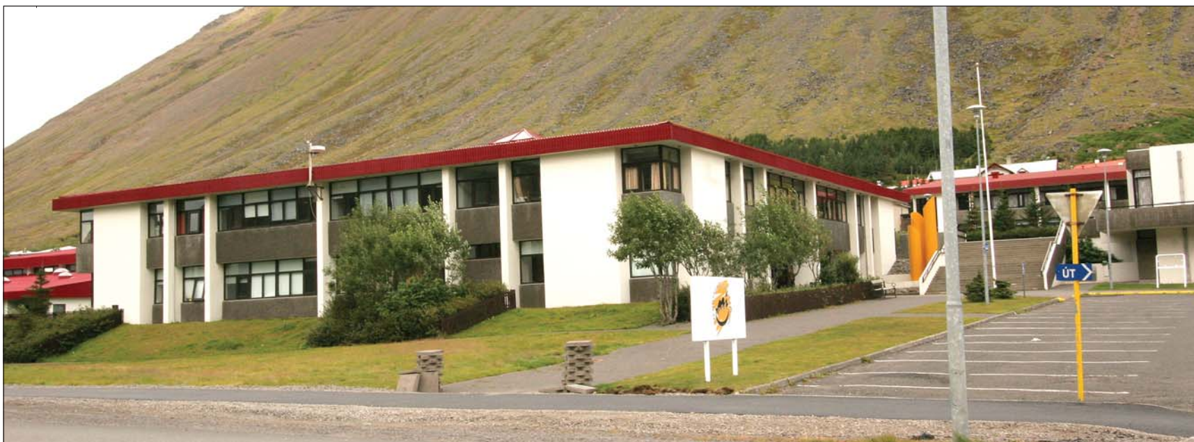
Menntaskólinn á Ísafirði.