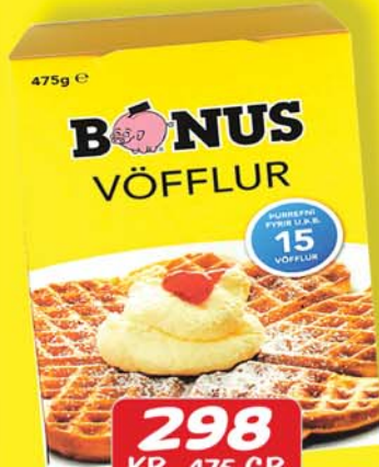
BÓNUS VÖFFLUMIX 298 KR. 475 GR