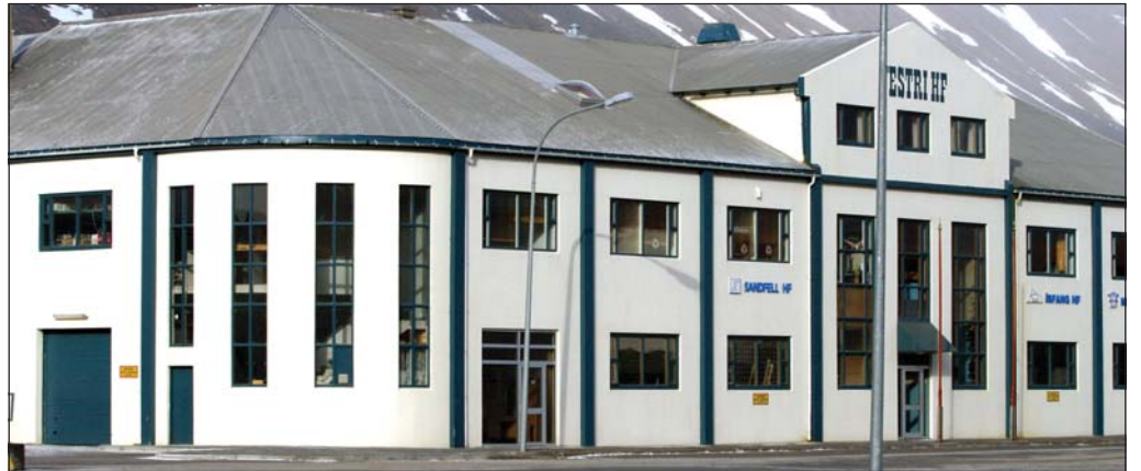
Háskólasetur Vestfjarða er í Vestrahúsinu á Ísafirði.