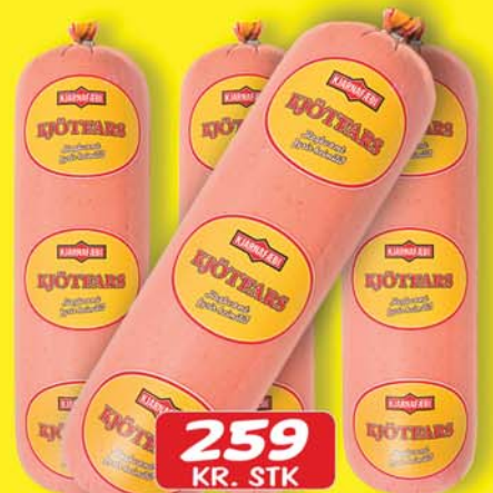
FERSKT KJÖTFARS 620 GR