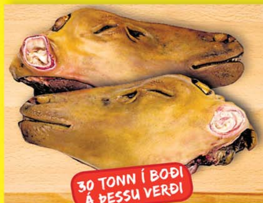
FROSIN LAMBASVIÐ 229 KR.KG