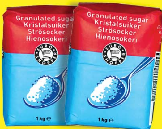
ES SYKUR I KG. 198 KR.KG