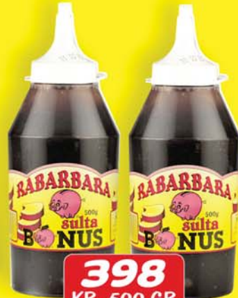
RABARBARA SULTA 398 KR. 500 GR