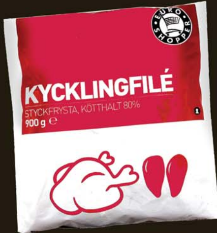
1498 KR. PK ÓDÝRUSTU KJÚKLINGABRINGURNAR Í BÓNUS