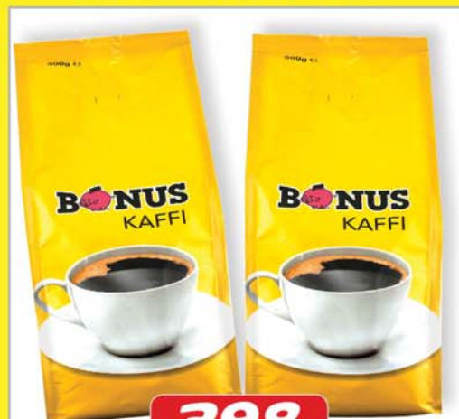
BÓNUS KAFFI 500 GR 398 KR. 500 GR