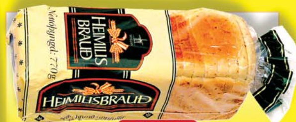
MYLLU HEIMILISBRAUÐ 770 GR