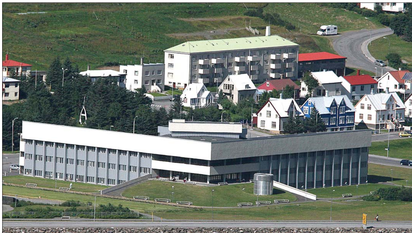
Heilbrigðisstofnun Vestfjarða á Ísafirði hefur þurft að skera mikið niður síðustu ár.

Til athugunar er að leigja út fjögurra herbergja, 110 m 3 íbúð á eyrinni á Ísafirði í vetur. Aðeins reglufólk kemur til greina. Upplýsingar í síma 00 47 480 70 568.