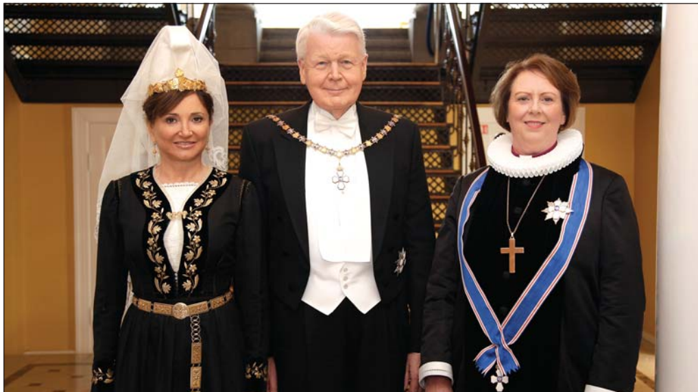
Ísfirski biskupinn, ísfirski forsetinn og ísraelska forsetafrúin.