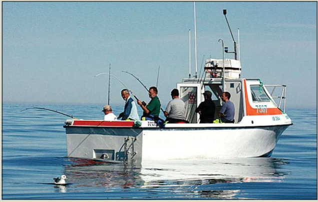
Öryggi veiðimanna er betur tryggt með prófunum Fræðslumiðstöðvarinnar.