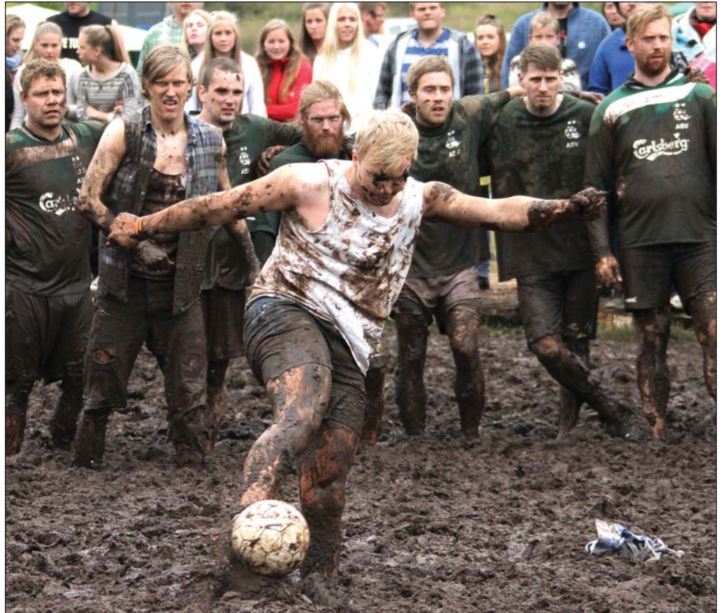
Frá mótinu um verslunarmannahelgina.

Að sögn Jóhanns verður hagnaður Mýraboltafélagsins af mótinu svipaður og undanfarin ár, þrátt fyrir aukinn keppendafjölda. „Fleiri keppendur þýða aukin kostnað. Hátiðin var stærrí í sniðum en á síðasta ári og mun dýrari í rekstri. Við héldum flugeldasýningu, miklu stærra ball og jukum alla öryggisgæslu. Til að mynda voru tíu manns starfandi sem öryggisverðir fyrir utan ballið á sunnudagskvöldinu. Einnig fylgir þessu mikill auglýsinga-