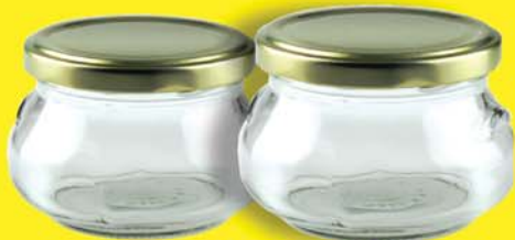
KRUKKA MEÐ LOKI 159 KR.