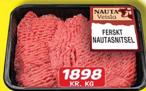
FERSKT NAUTGRIPA SNITSEL