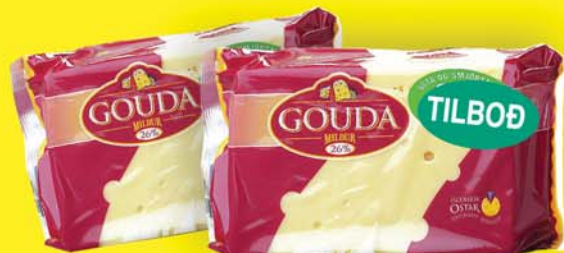
OS GOUDA 26% OSTUR 998 KR.KG