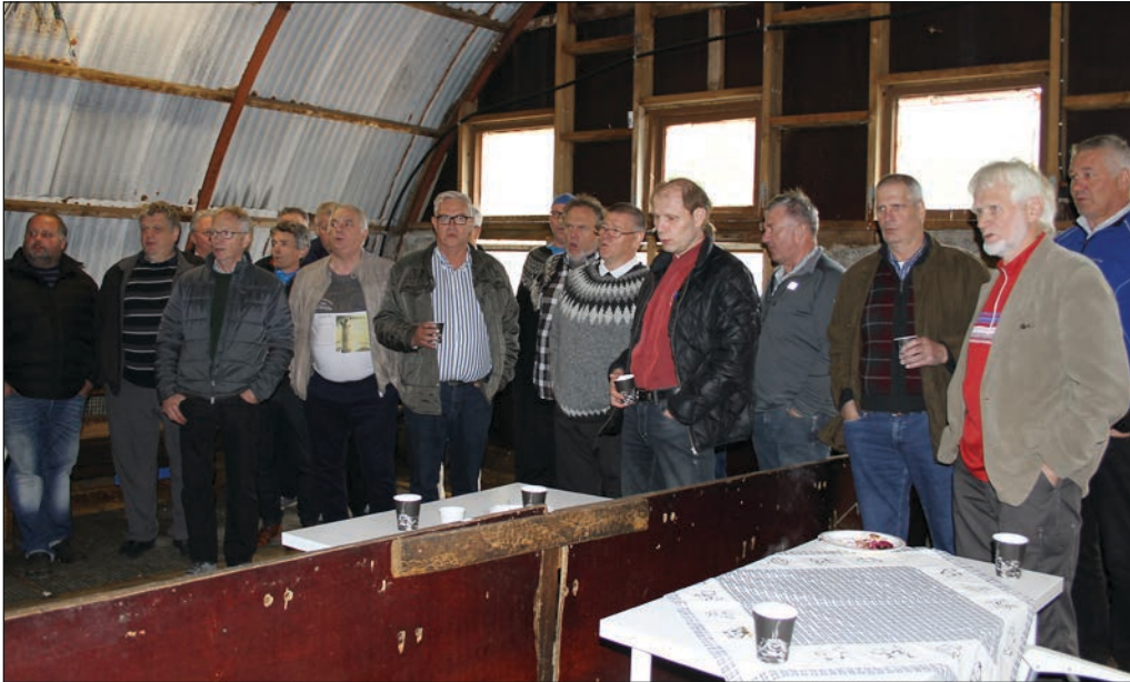
Karلاكórinn tók að sjálfsgöðu nokkur lög.