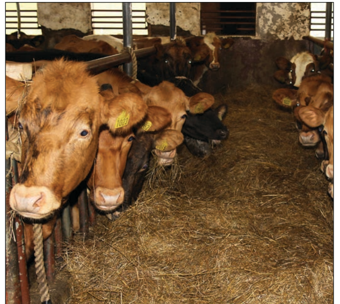
Þessar hlustuðu með andakt á karلاكórinn syngja afmælis-sönginn.