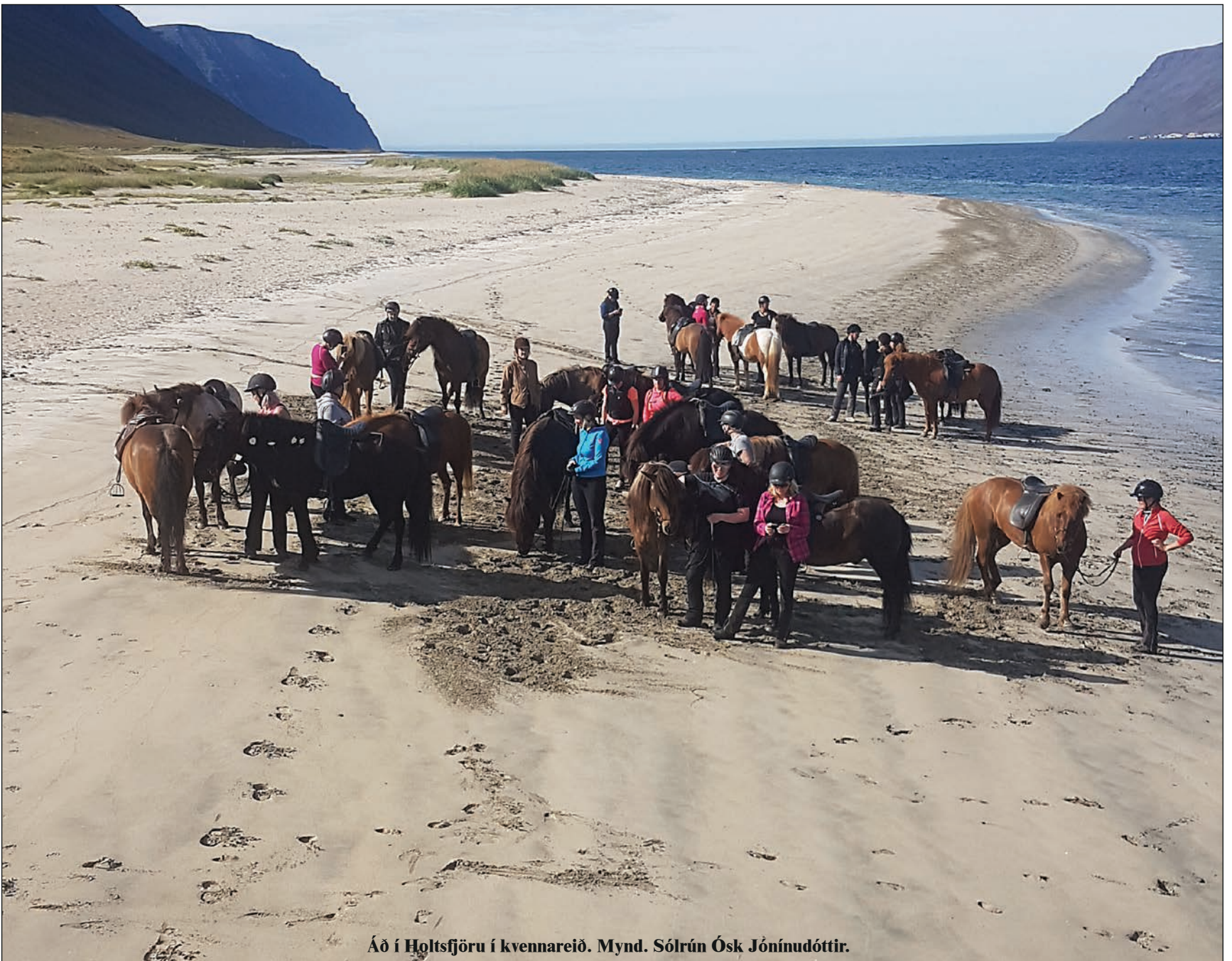
Áð í Holtsfjöru í kvennareid.

Stofnað 14. nóvember 1984 · Fimmtudagur 1. september 2016 · 32. tbl. · 33. árg. · Ókeypis eintak