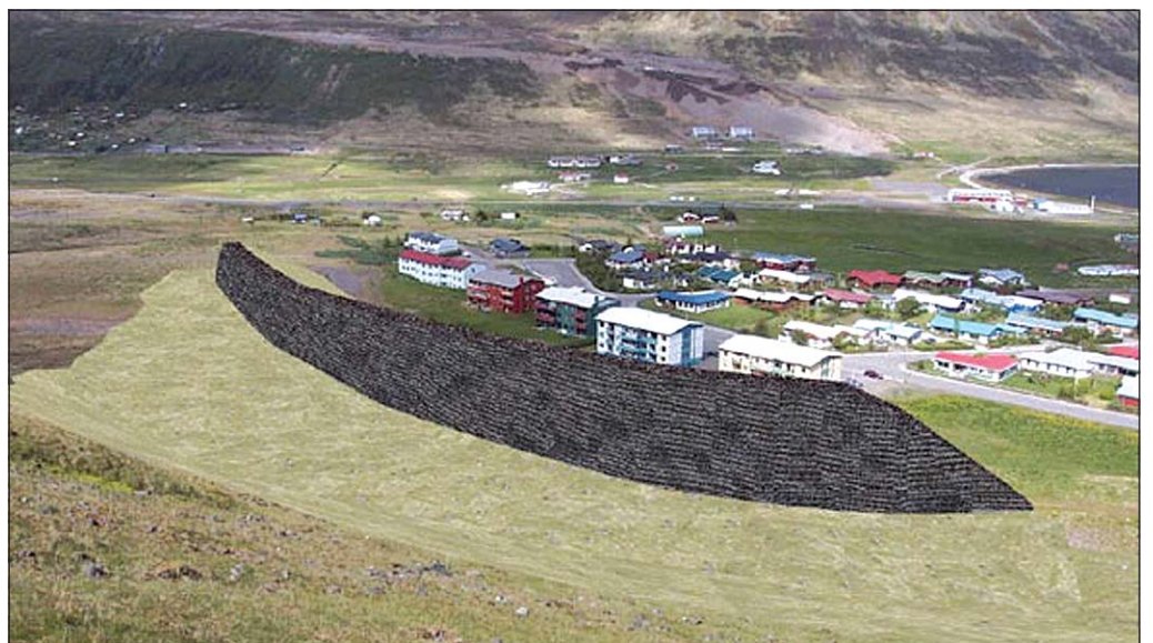
Teikning af snjóflóðavörninum sem reisa á í fjallinu Kubba í Skutulsfirði.