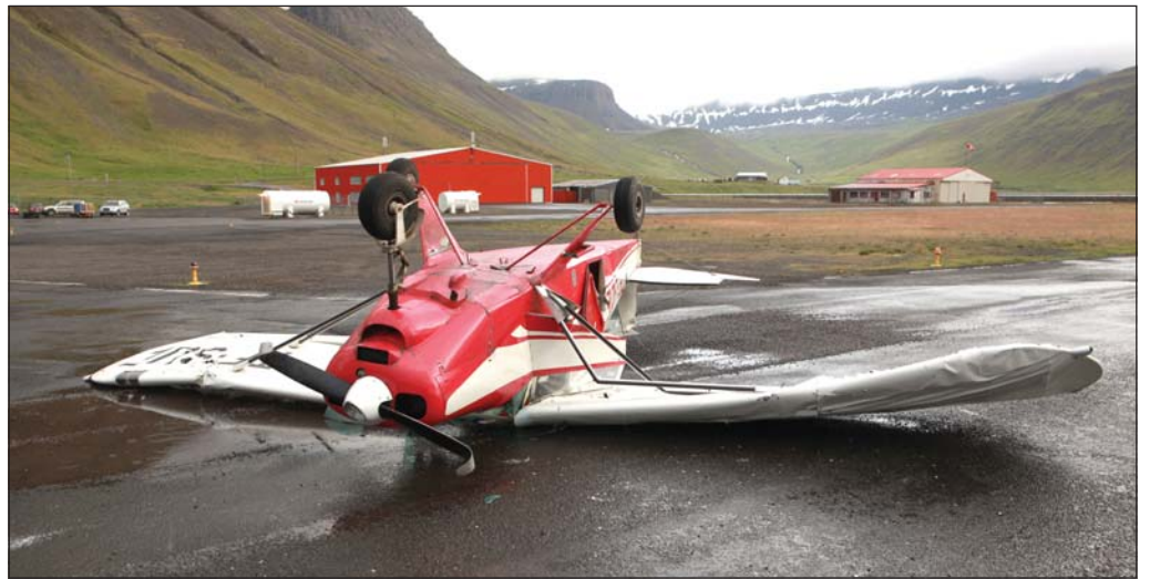
Flugvélin er mikið skemmd.

sér stað en þau voru öll fljót að jafna sig. Talið er að vindhviða hafi hvolft vélinni, en rannsókn á slysinu er ekki lokið. Þyrla Landhelgisgæslunnar var sett í viðbragðsstöðu, en þegar ljóst var að enginn hefði slasast var tilkynningin afturkölluð. Það eru rannsóknarnefnd flugslysa og lögreglan á Vestfjörðum sem rannsaka tildrög slyssins.