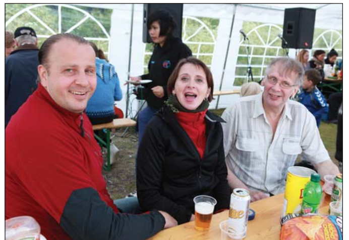
Um hundrað mans mættu í ár.