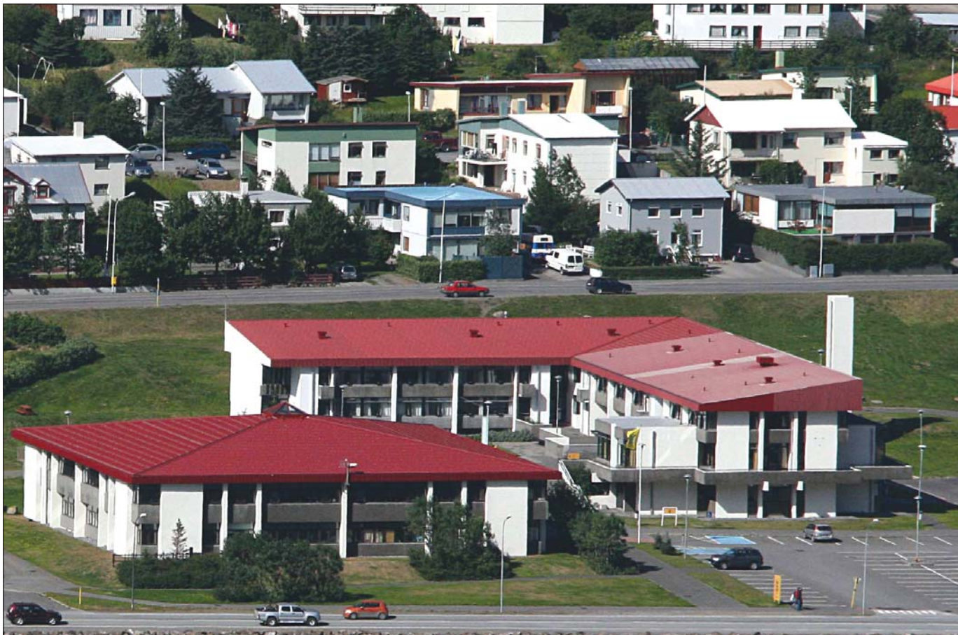
Menntaskólinn á Ísafirði.