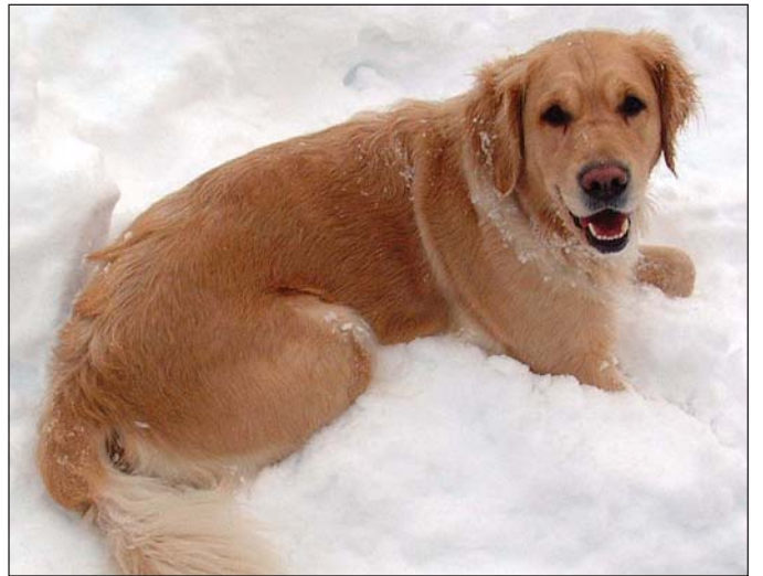
Hundar ganga oft lausir og eigendur þeirra trassa að skrá þá og koma með þá í hreinsun eins og reglugerðir segja til um.