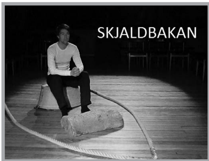
Nýjasti einleikur landsins, Skjaldbakan, verður á hátíðinni.