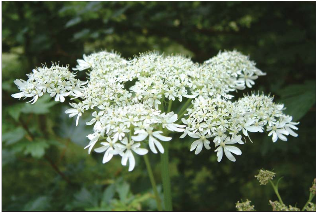
Breiður af skógarkerfli eru ofan Ísafjarðar.

Margir hafa kvartað yfir því að kerfill og lúpínur fari yfir í