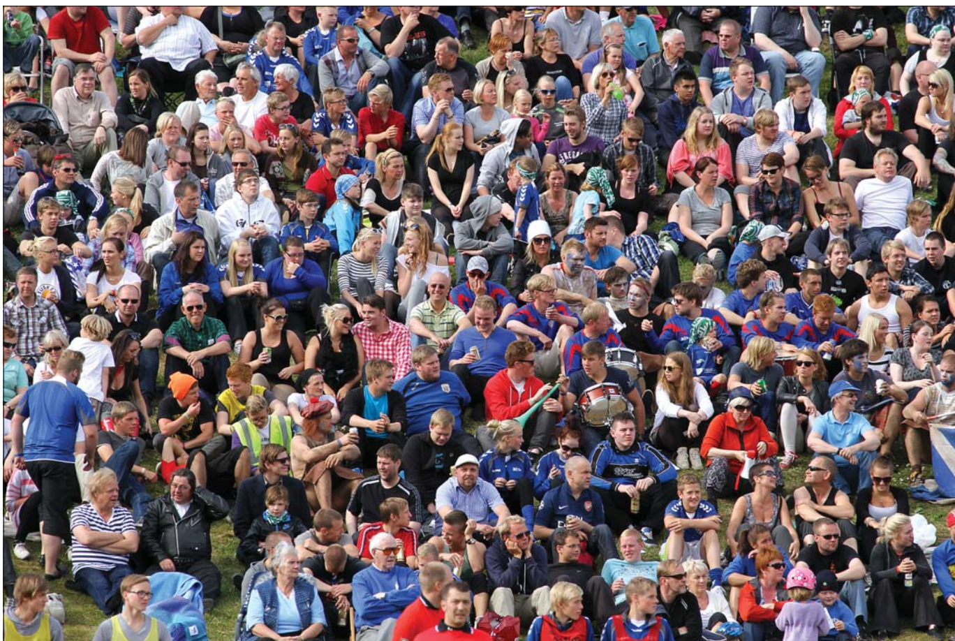
Mikill fjöldi áhorfenda var á leiknum.