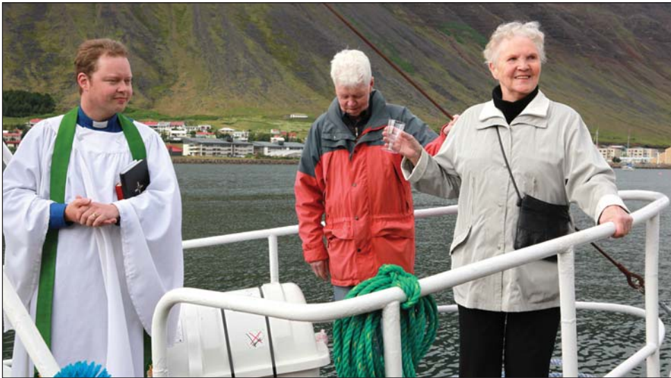
Bátinum var gefið sitt gamla nafn á ný við hátíðlega athöfn.