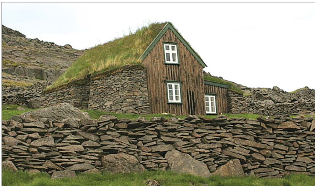
Litlabær í Skötufirði í Ísafjarðardjúpi.