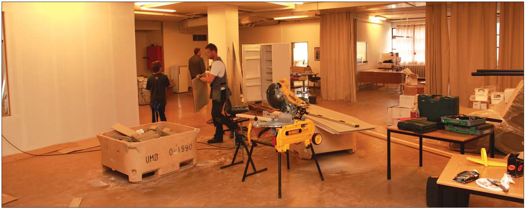
Kerecis innréttar nú verksmiðjuaðstöðu og skrifstofur í húsnæði HG við Eyrargötu.