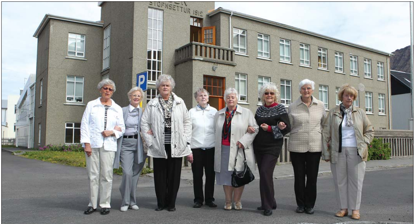
Skólasystrurnar fyrir framan Húsmæðraskólann Ósk.

„Við erum afskaplega ánægðar að hittast svona aftur, allar orðnar þínufullorðnar!“ Af konunum átta sem núna komu saman eru