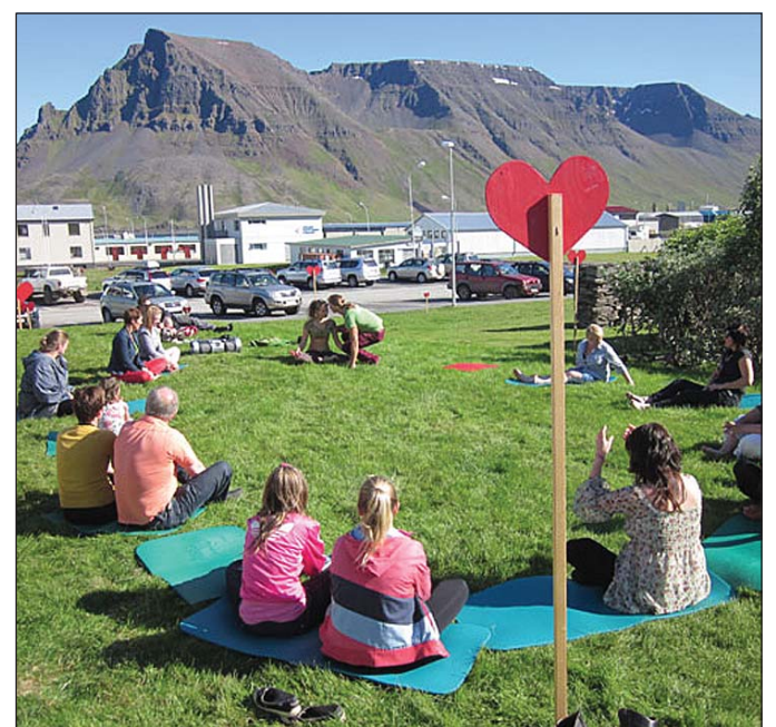
Frá opnun ástarvinnunnar í fyrra.