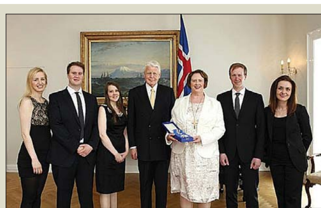
Frá athöfninni á Bessastöðum.