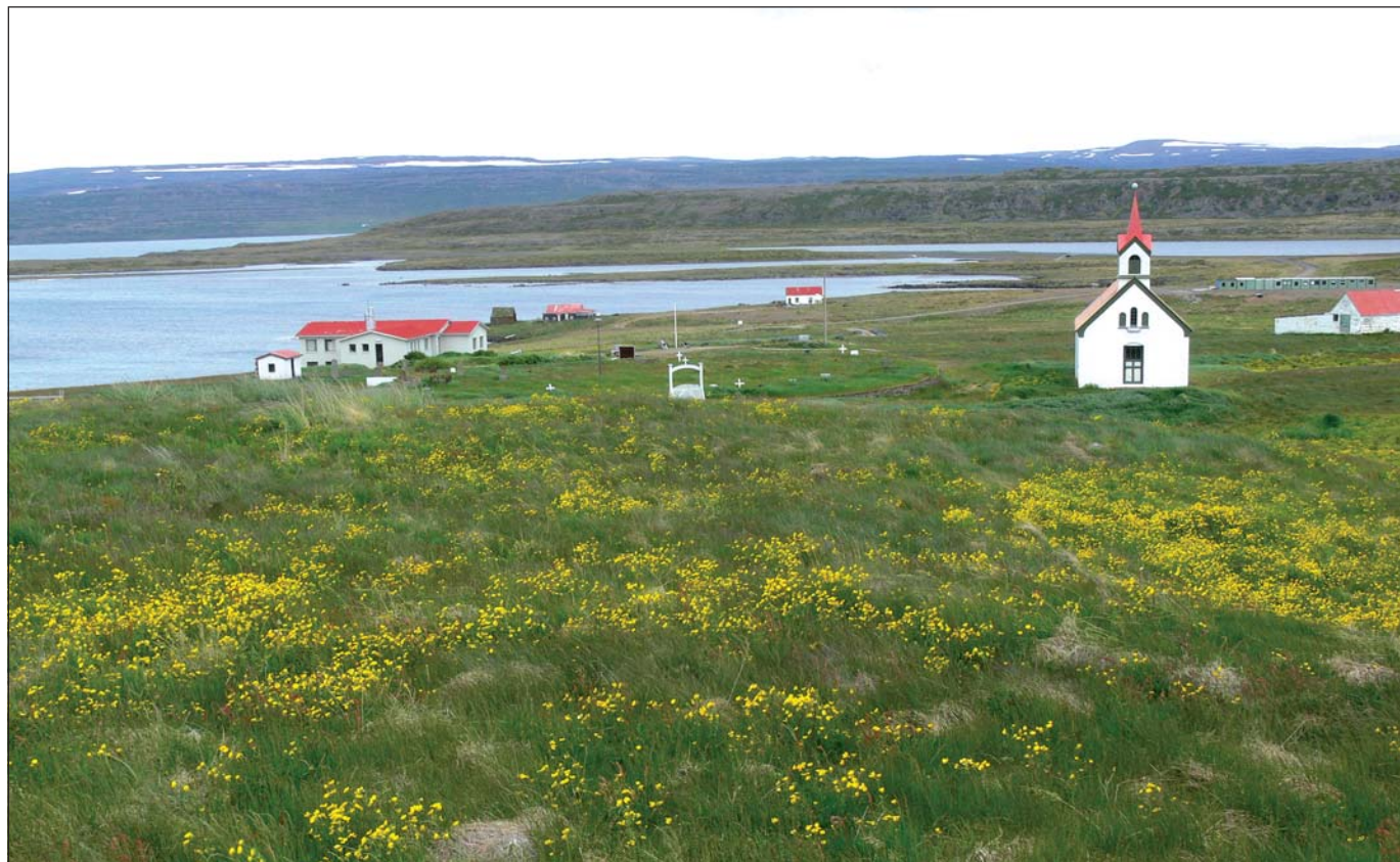
Samkomuhúsið sést fyrir miðri mynd, hvítt með rauðu þaki.

skuldi 167% af árstekjum, en það viðmið má mest vera 150%. Nú vilja þeir fá frá okkur áætlun um það hvernig þessu verði komið í lag á tíu árum. Okkar svar við því er að fyrsta skrefið sé að Eftirlitsnefndin standi við undirritaða samninga og við það náist sú skuldalækkun sem til þarf að fjórum fimmtu hlutum. Þá stæði eftir um 21 milljón króna til að ná settu marki, sem við hefðum þá 10 ár til að glíma við og allir sjá að ætti að vera vel viðráðanlegt. Við myndum auðvitað gera grein fyrir því hvernig skuldarnar yrðu lækkaðar um þá fjárhæð þegar Eftirlitsnefndin hefði klárað sín mál,“ segir Elías Jónatansson.