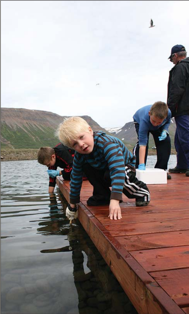
Unga fólkið nýtur þess að gefa þorskinum að borða.