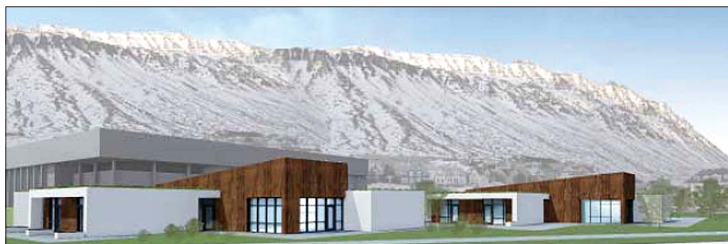
Teikning af fyrirhuguðu hjúkrunarheimili.

Á fundi nefndar um byggingu hjúkrunarheimilis var rætt við