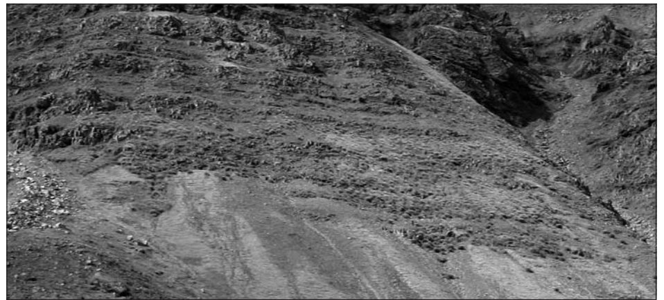
Lúpínan hefur komið sér vel fyrir í hlíðum Eyrarfjalls.

við bakteríur. Bakteríurnar vinna köfnunarefni úr andrúmsloftinu sem plantan notar sér til framdráttar og eru belgurtir því ekki háðar köfnunarefnisáburðargjöf eins og aðrar plöntur. Köfnunarefnisbindingin gerir það að verkum að við rotun plöntuleifa verður köfnunarefnið eftir í jarðveginum sem nýttist öðrum plöntum. Þetta verður til þess að