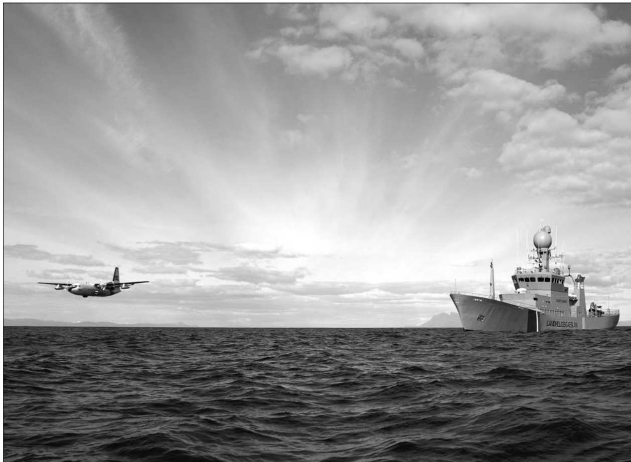
Útgerðarmaður Gullbjargar er ekki sáttur við Landhelgisgæsluna.

Unnið er á fullu við að smíða nýja bryggju í Ísafjarðarhöfn. Nýja bryggjan mun leysa af hólmi gömlu Dokkubryggjuna þar sem björgunar-báturinn Gunnar Friðriksson og lóðsbáturinn Sturla Halldórsson lágu, en bryggjan var afar illa farin og nær ónýtt. Nú er verið að steypa undirstöður í landi fyrir nýju bryggjuna sem verður 40 metra löng flotbryggja. Olís hf. bauð lægst í verkið, eða sléttar 13 millj. króna, en ýmsir vestfirskir undirverktakar koma að því fyrir hönd fyrirtækisins.