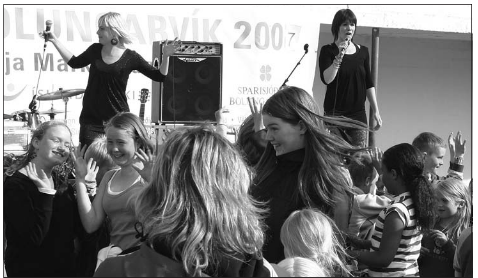
Hara systurnar tóku lagið fyrir markaðsdagsgesti.