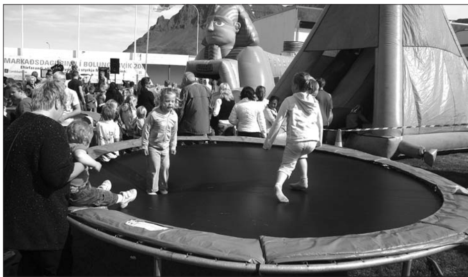
Fjöldi leiktækja var fyrir yngri kynslóðina á markaðsdeginum í Bolungarvík.