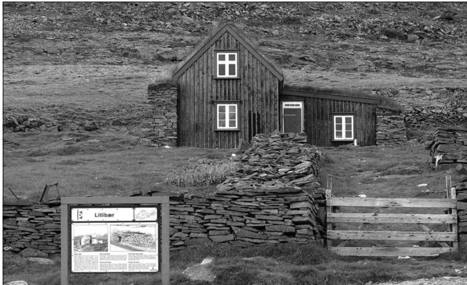
Litlabær í Skötufirði.