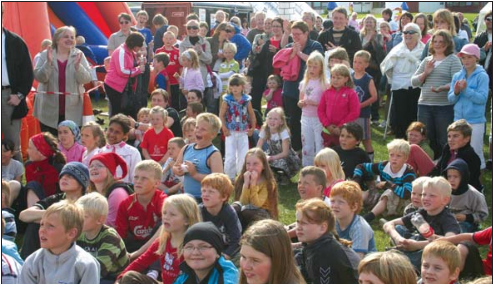
Hinn árlegi markaðsdagur Bolvíkinga var á laugardag og var ýmis konar afþreying í boði fyrir bæjarbúa og gesti þeirra sem komu víða að. Þessi born fylgdust spennt með skemmtiatriði Hara systranna sem komu ásamt fleirum fram. Nánari umfjollun og fleiri myndir má sjá á bls 7.

Eiginkonunni tókst að komast undan manningnum en þó ekki án áverka því skotið fór svo nærri henni að flíkur sem hún var íklædd rifnuðu, auk þess sem hún hlaut minniháttar áverka. Maðurinn gæti átt yfir höfði sér allt að 16 ára fangelsi.