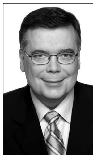
Geir H. Haarde, forsætisráðherra.

Meðal annarra aðgerða sem grípa á til má nefna styrkingu Byggðastofnunar, niðurfellingu veiðigjalds vegna þorskveiða og aukin framlög til endurmenntunar. Þá skal tekið sérstaklega á atvinnulífi kvenna og skoðað hvort þörf sé á því að auka framlög til þeirra