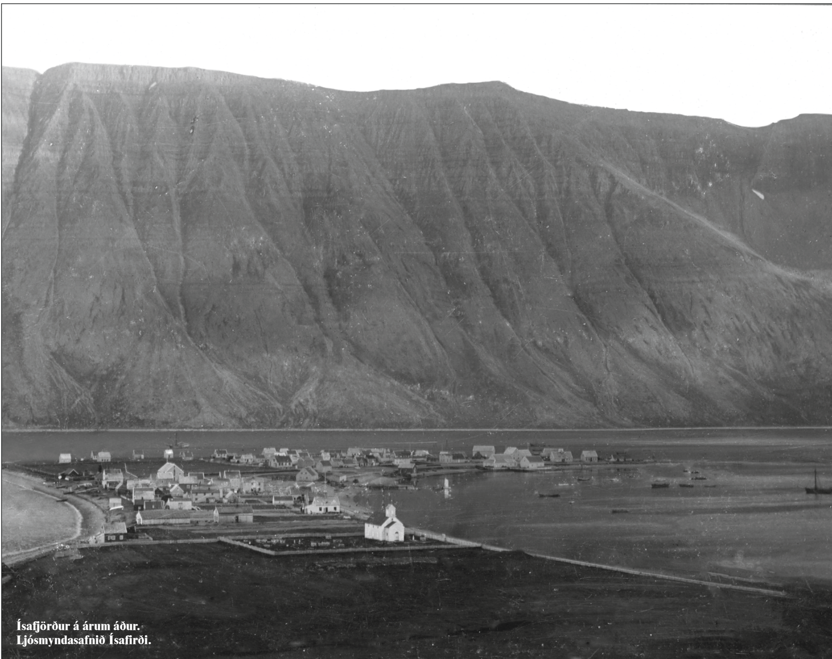
Ísafjörður á árum áður.

Stofnað 14. nóvember 1984 · Fimmtudagur 14. júlí 2016 · 27. tbl. · 33. árg. · Ókeypis eintak