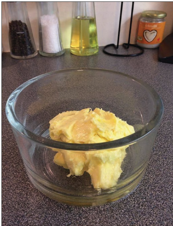
Heimagerð Örnú-smjör.