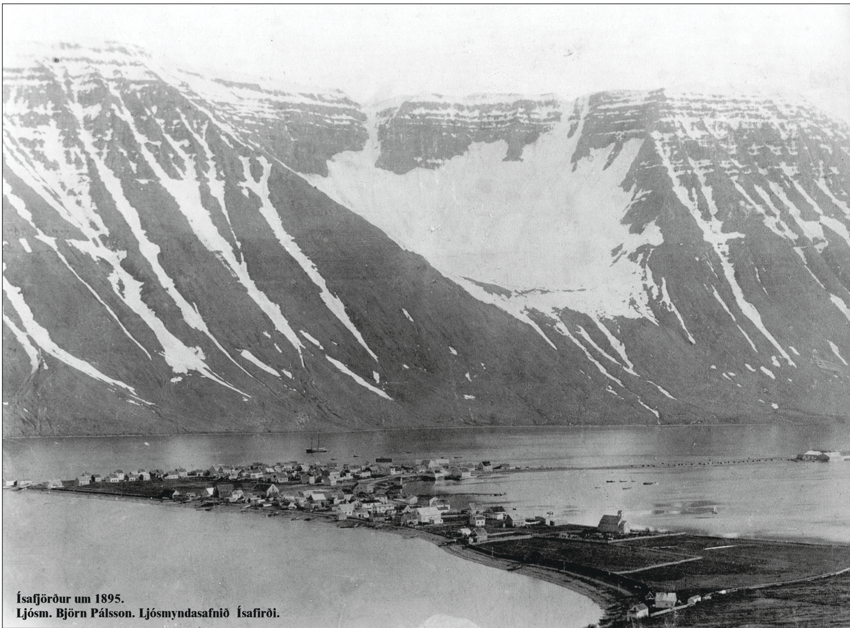
Ísafjörður um 1895.