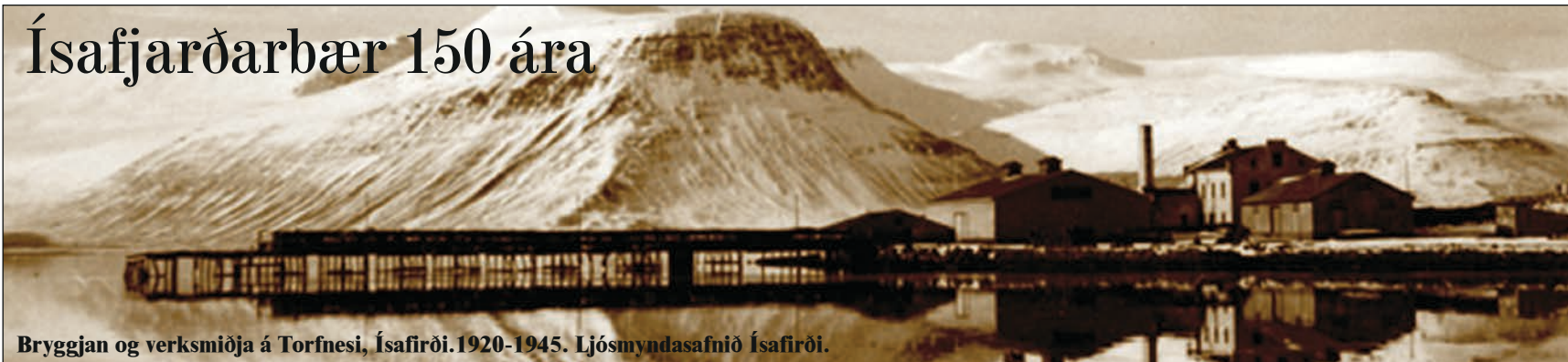
Bryggjan og verksmiðja á Torfnesi, Ísafirði. 1920-1945.