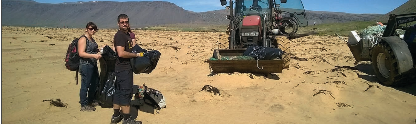
Frá fjöruhreinun á Rauðasandi í fyrra.

Sautján sjálfbóðaliðar hreinsuðu alls tuttugu rúmmetrar af rusli á þremur klukkustundum á fjögurra kílómetra svæði á Rauðasandi í Barðastrandarsýslu í mánuðinum, en það voru landeigendur, Umhverfisstofnun og Vesturbyggð sem stóðu fyrir hreinsuninni nú annað árið í röð. Á vef Vesturbyggðar segir