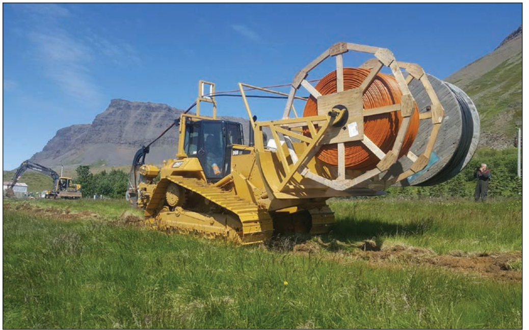
Fallegt veður í Dýrafirðinum.