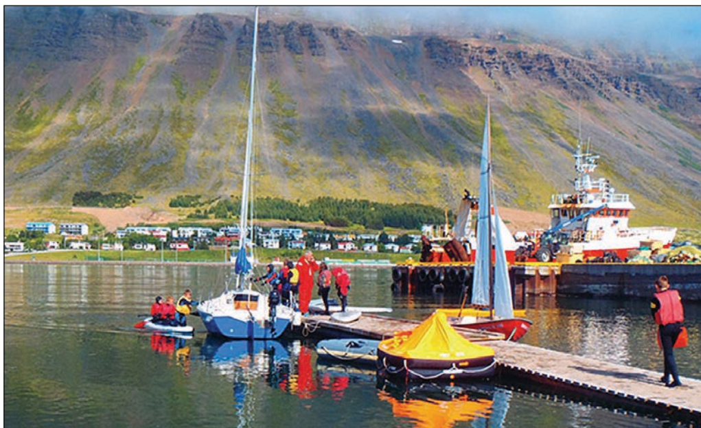
Sumarið hefur leikið við þátttakendur siglinganámskeiðsins.