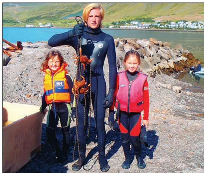
Krabbagildrunar hafa notið mikilla vinsælda.