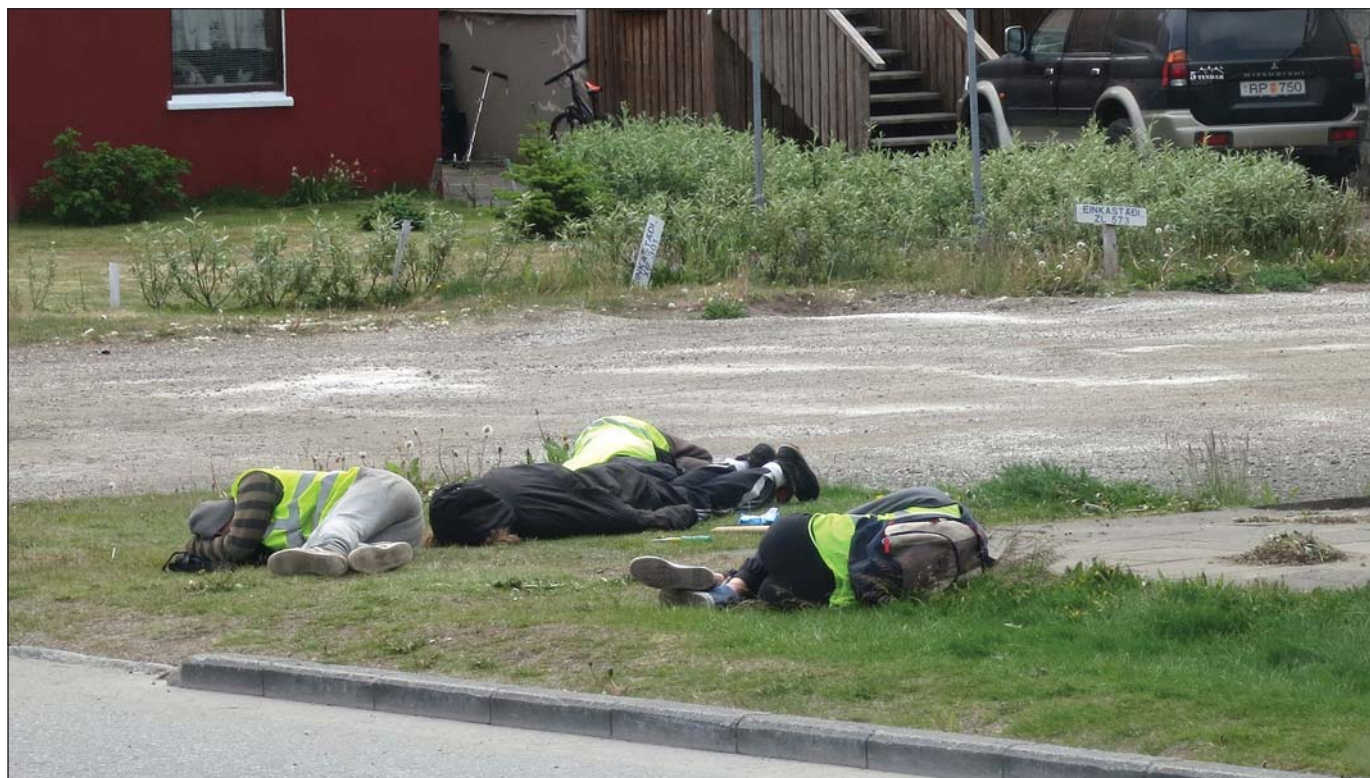
Það getur oft á tíðum verið erfitt að vakna á morgnana og hefja vinnudaginn.