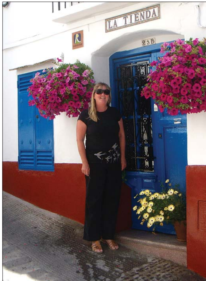
Magný í fjallabænum Competa á Spáni.

Vegna vinnunnar við húsið eru þau orðin sérfróð um ýmislegt sem fæstir hafa mikla þekkingu á, eins og gamlar lamir. „Ef við sjáum núna gamla hurð sem verið er að henda grípum við hana strax. Við erum farin að þekkja lamir sem eru meira en hundrað ára. Ég er farin að bjarga svona hlutum og geymslan okkar er full af gömlum