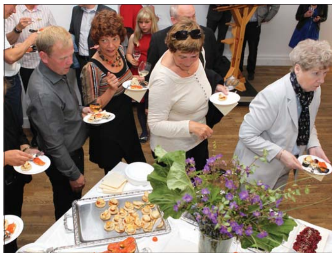
Boðið var upp á kræsingar sem eru að finna í bókinni.