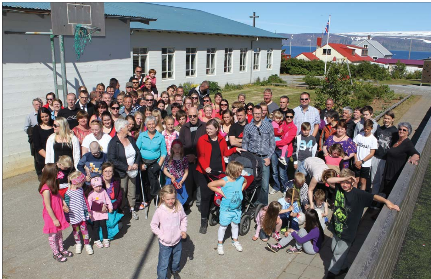
Hnífsdælingamótið var vel sótt.

Hnífsdælingarnir komu saman við kirkjugarðinn í Hnífsdal en síðan tók við þétt dagskrá. Til að mynda var gengið upp á Hádegisstein, synt í ánni við Mjóasund, farið í gömlu krakka-