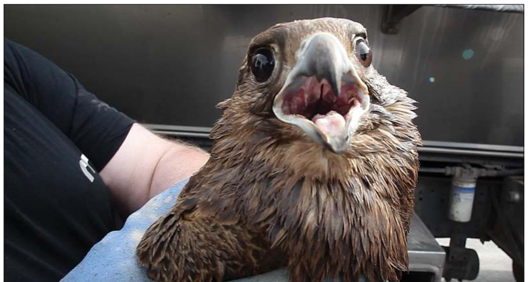
Grútskítugur fálkinn nýkominn úr keðjukassanum.