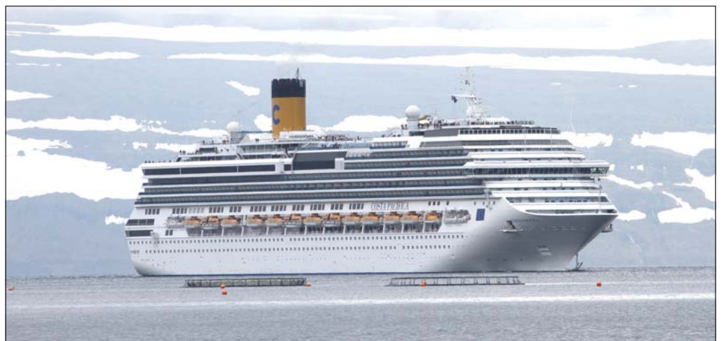
Costa Pacifica er væntanlegt aftur til Ísafjarðar í dag.