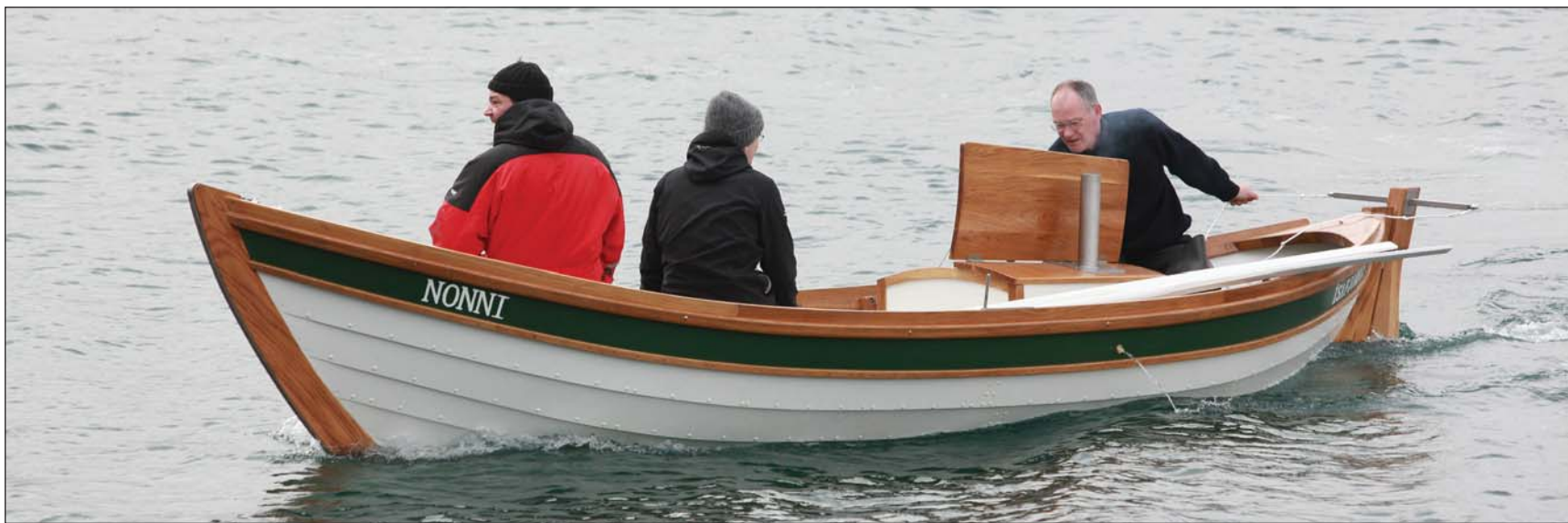
Síðan var siglt út á Pollinn í Skutulsfirði.

Ég skora á Biljönu lIievsku að koma með næstu uppskrift.