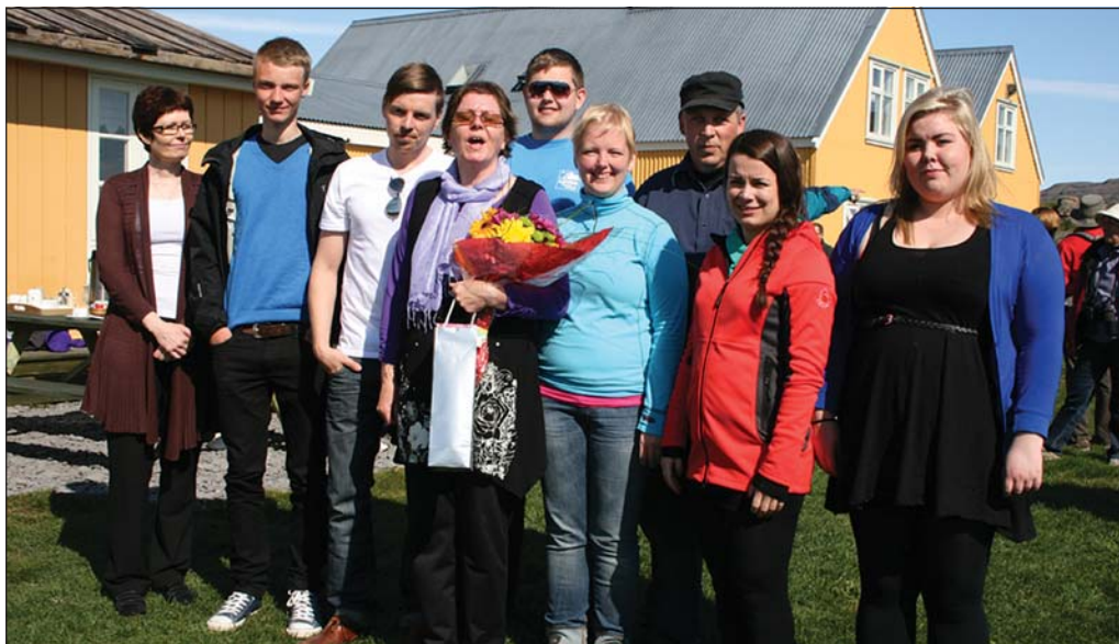
Vinir og vandamenn fögnuðu með Kiddý í Vigur.

Í svari frá útibúi bankans var staðfest að áskorunin hafi verið móttækin og sé í skoðun innan bankans. Þess má geta að ekki heldur er hraðbanki á Flateyri þar sem Landsbankinn er einnig með útibú. – thelma@bb.is