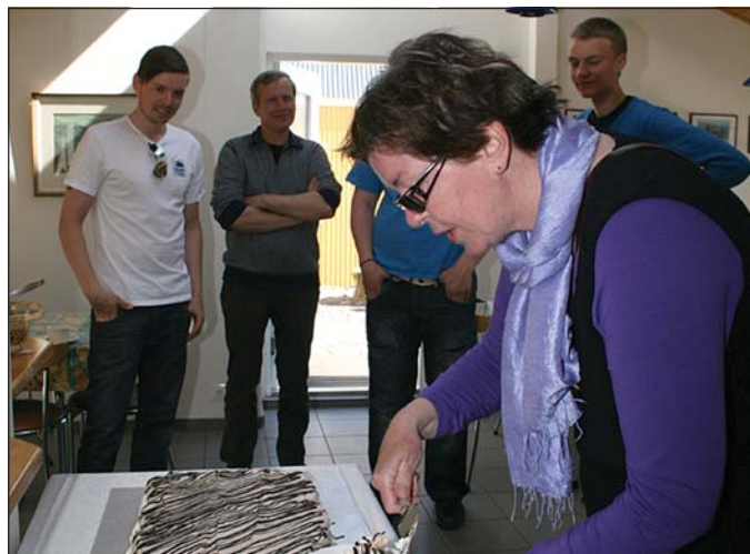
Vitaskuld var haldið upp á afmælið með pompi og prakt.

fram í tilkynningu frá vottunarstofunni Tún sem framkvæmdi matið hér á landi. Nokkrir helstu nytjastofnar á fiskimiðum grannlanda okkar hafa þegar hlotið MSC vottun, m.a. þorskur og ýsa í Barentshafi, ufsi við Noreg og síldveiðar við Færeyjar.