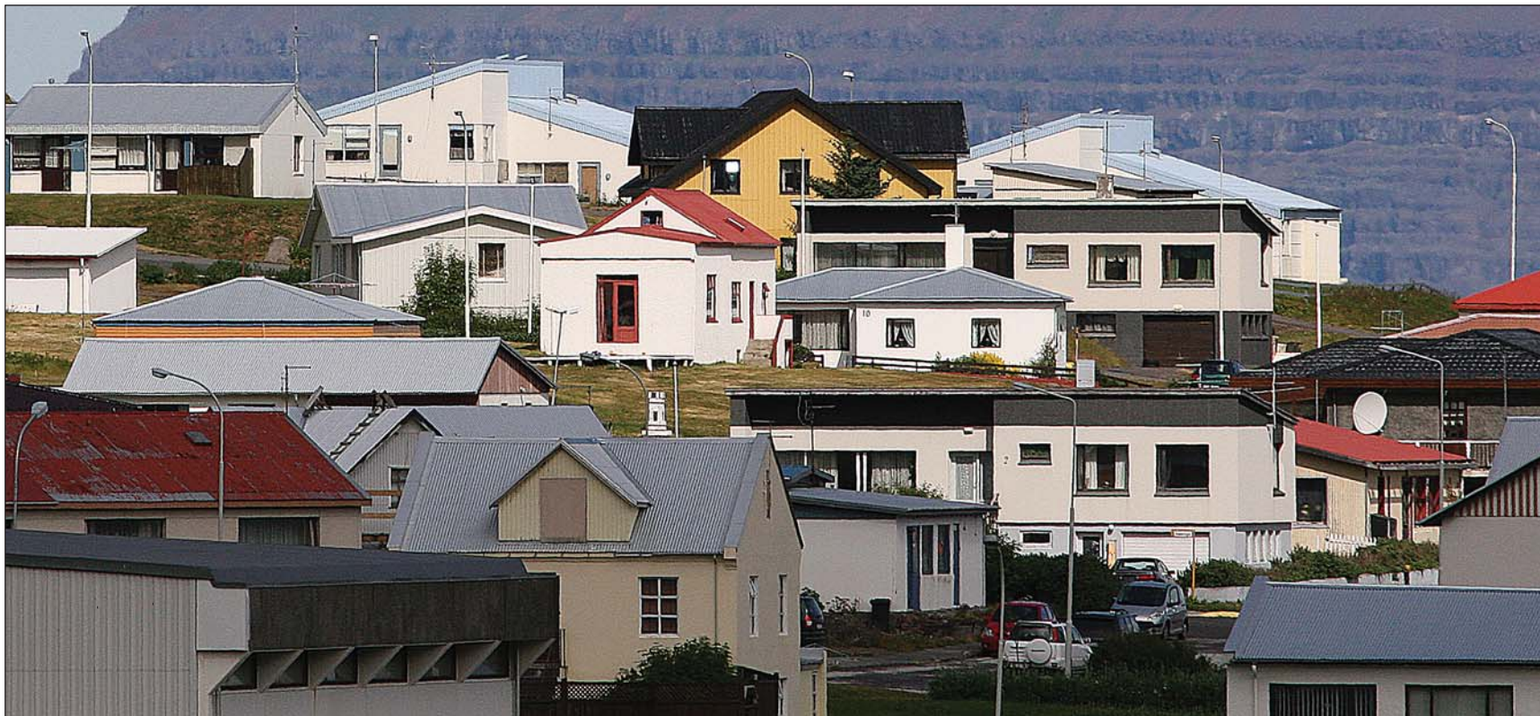
Deila á milli Íbúðalánasjóðs og eftirlitsnefndar með fjármálum sveitarfélaga kemur sér illa fyrir Bolungarvík.