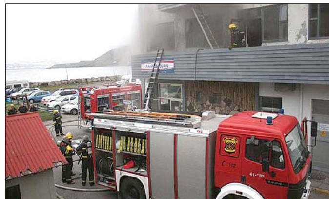
Frá slökkvistörfum á aðfararnótt sunnudags. Eins og sjá má var reykurinn talsverður og gerði hann slökkviliðsmönnum erfitt fyrir.

Í húsinu var til húsa Fánasmiðjan og Listakaupstaður. Í Listakaupstað er aðstaða fyrir listafólk, málara, rithöfunda, leikara og tónlistarfólk.