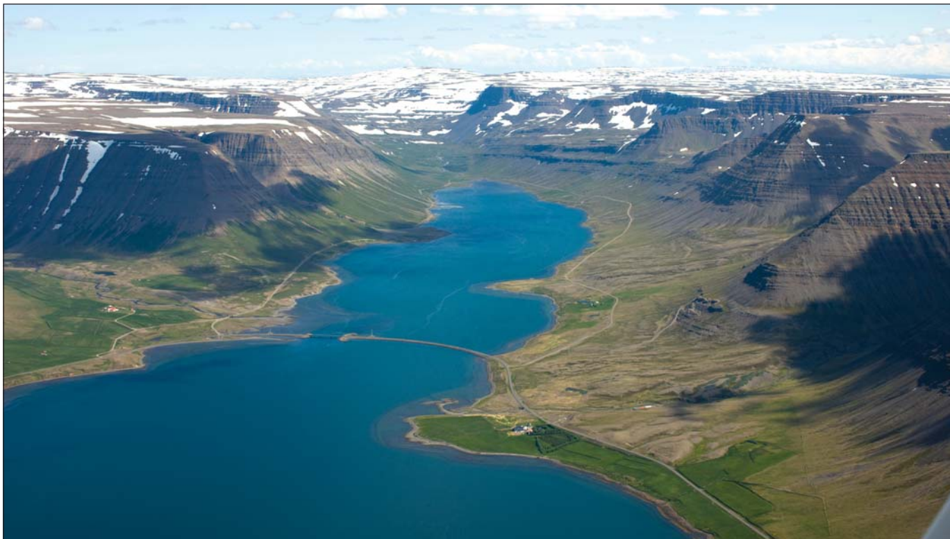
Séð yfir Dýrafjörð.