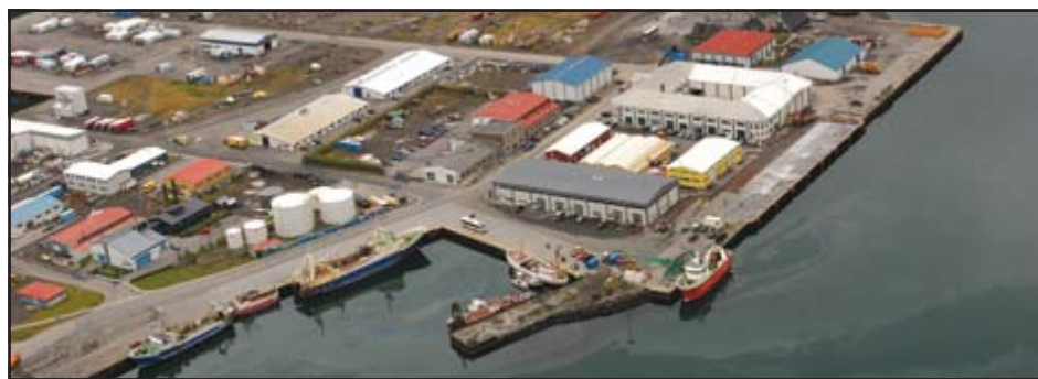
Á Ísafirði er lífhöfn frá náttúrunnar hendi og þar eru mikil mannvirki.

Þá er í greinagerðinni sagt mikilvægt að koma á tengslum og samvinnu milli Vestfjarða og byggðarlaga á Austur-Grænlandi. „Þjónusta í Ísafjarðarbæ er fjölbreytt og má þar nefna vélsmiðjur, veiðarfæragerð og framleiðslu á tækjum til veiða og vinnslu. Einnig er nægt kristalstært vatn úr Vestfjarðargöngum til staðar við höfnina. Umhverfi til atvinnurekstrar er því gott og víða leynast tækifæri á sviði sjávarútvegs. Mikilvægt er að fullnýta þá þjónustu sem