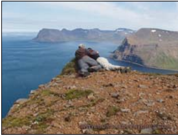
Ævintýraferðirnar eru ógleymanlegar.