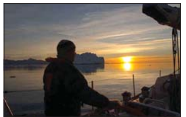
Frá ferð Auroru til Grænlands í fyrra.

Vestnorræna ferðamálaráðið, sem starfað hefur í rúm 20 ár, svo og tvihiða ferðamála-