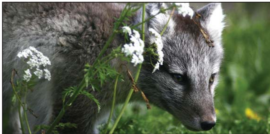
Vinnuhópur Fjórðungssambands Vestfjarða hefur skilað af sér skýrslu um aðgerðir og reglur vegna refa- og minkaveiða.