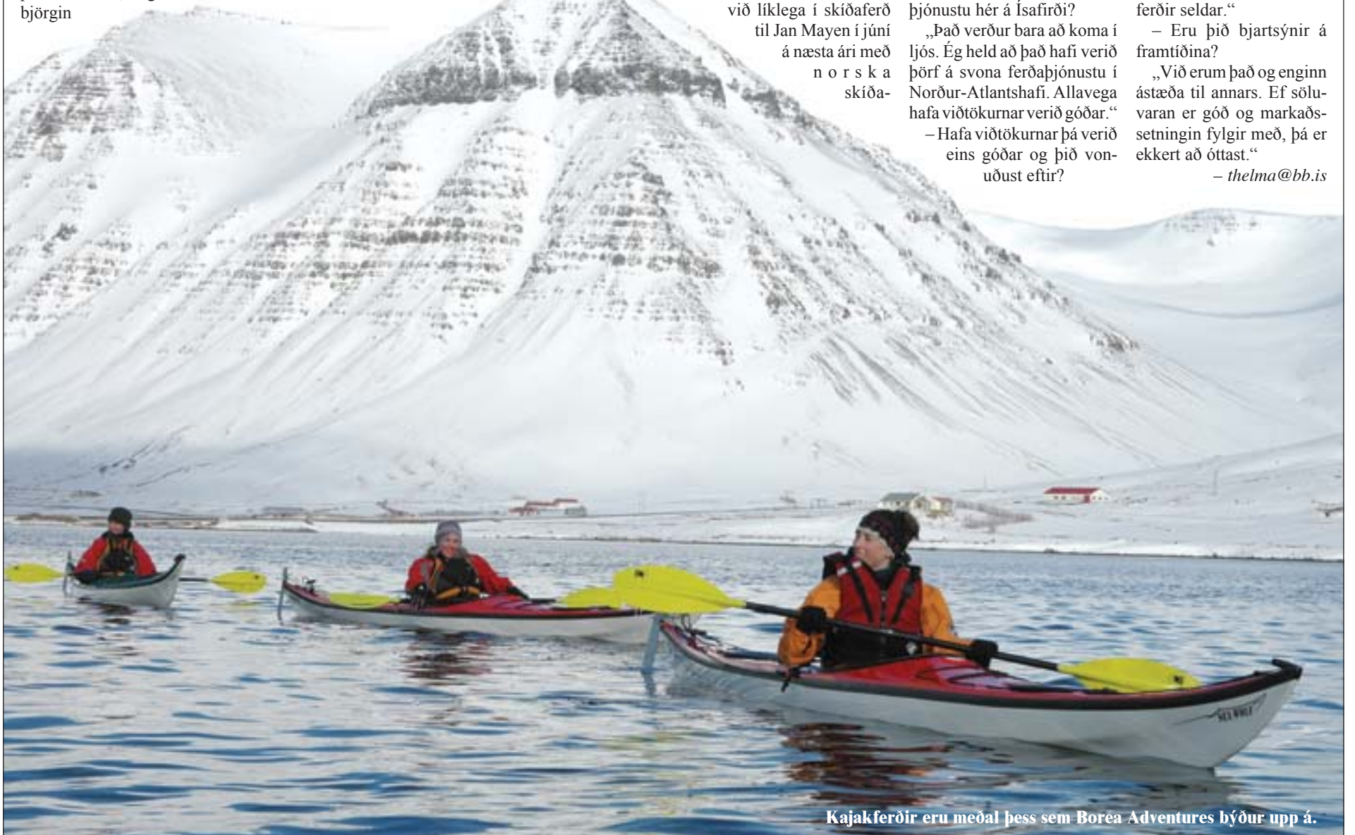
Kajakferðir eru meðal þess sem Borea Adventures býður upp á.