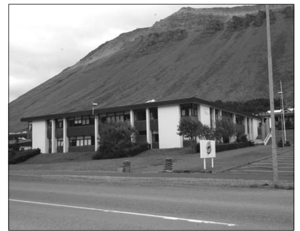
Menntaskólinn á Ísafirði.

slufyrirtækja hér á landi. Munu þau leggja upp laupana eitt af öðru, af sömu ástæðum og Kambur ehf. og eigendur selja frá sér kvótann með hagnaði. Eftir situr fiskvinnslufólk-ið bundið áttahagafjötrum verðlausra eigna í byggðarlögum lítilla atvinnutækifæra. Framkvæmdastjórn SGS krefst þess að unnið verði að markvissri stefnumörkun um atvinnuöryggi verkafólks í fiskvinnslu, þannig að geðþóttaákvæðanir kvótaeigenda geti ekki lagt lífsgrundvöll fjölda manns í rúst í einum vettvangi.“ – tinna@bb.is