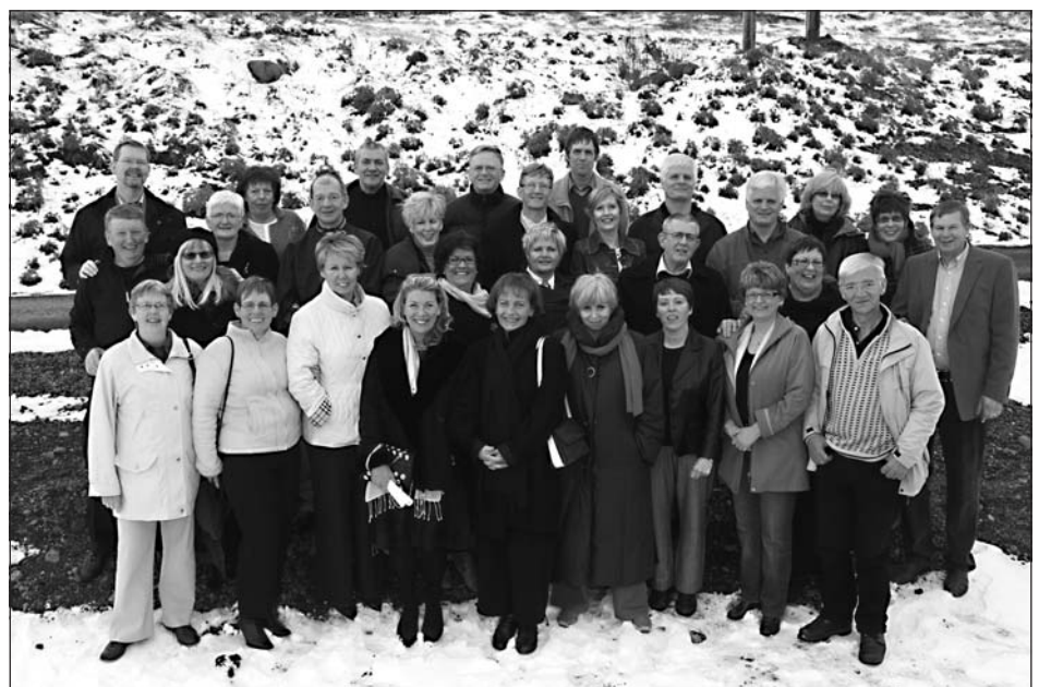
Glatt á hjalla hjá árgangi 1948.