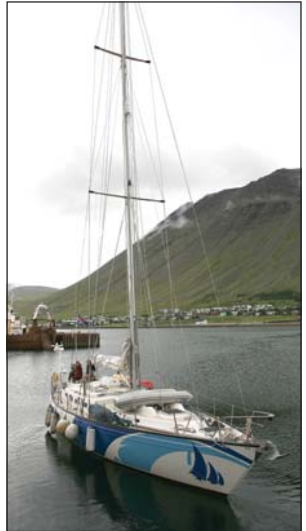
Skútan Áróra er sú stærsta á landinu.

menn. Allt Norður-Atlantshafið er í raun okkar heimasvæði en norðanverðir Vestfirðir henta flestum okkar ferðum mjög vel.“