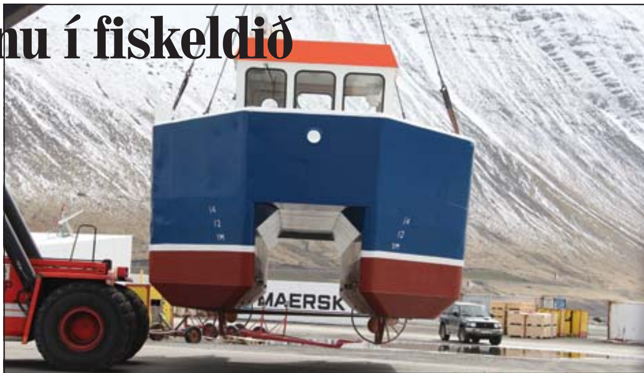
Tvíbytnan Rán ÍS var sjósett á dögnum.