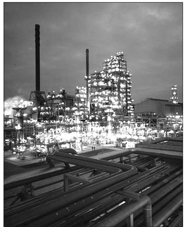
Olíuhreinsunarstöðin í Mongstad.