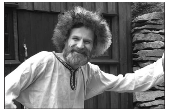
Gísli Súrsson sló í gegn í Albaníu.