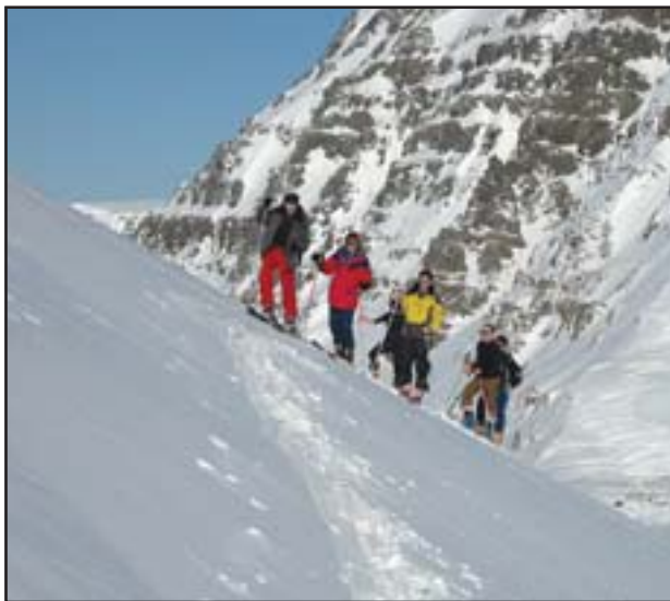
Frá skíðaferð sem farin var í apríl.