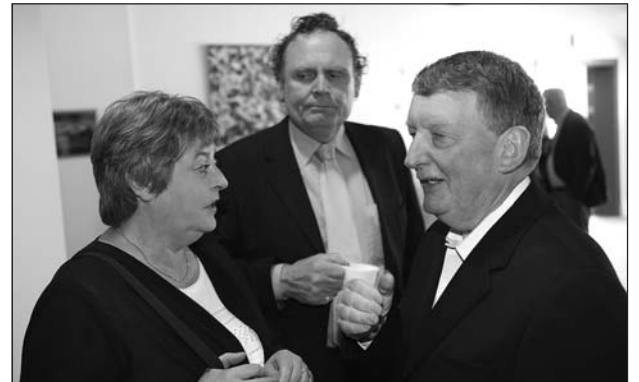
Fjöldi fólks var viðstaddur opnunina.