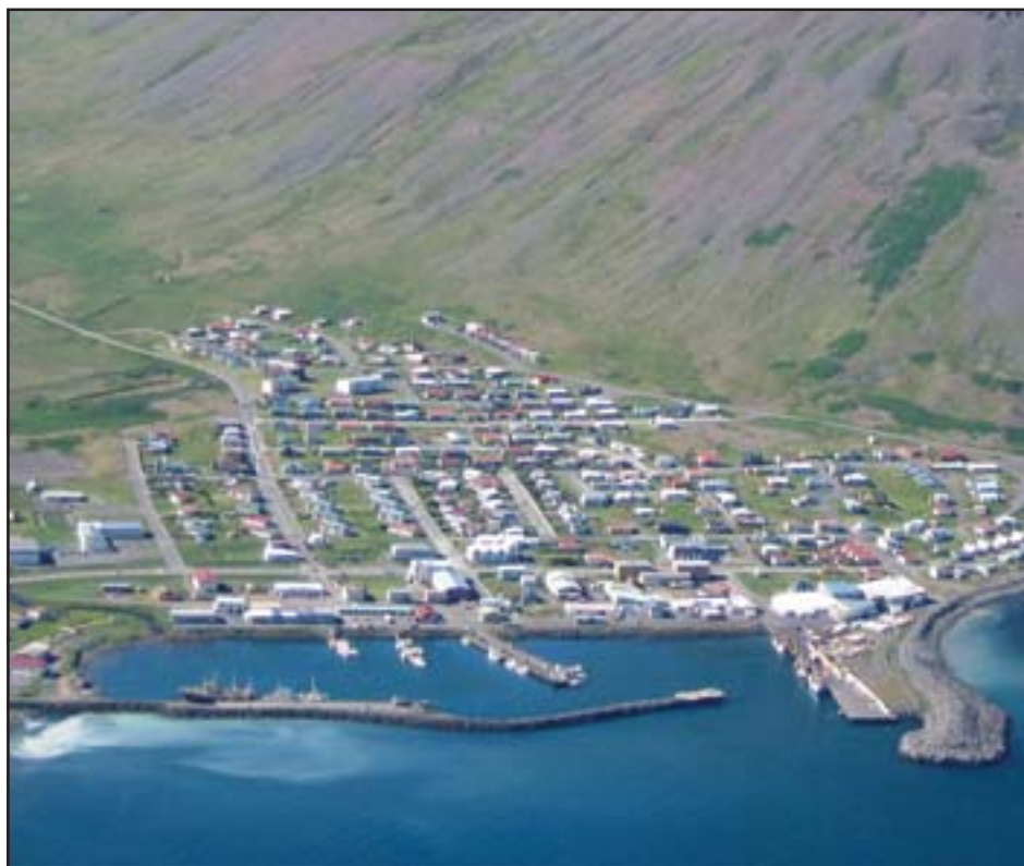
Bolungarvík – óánægja með lítinn byggðakvóta.