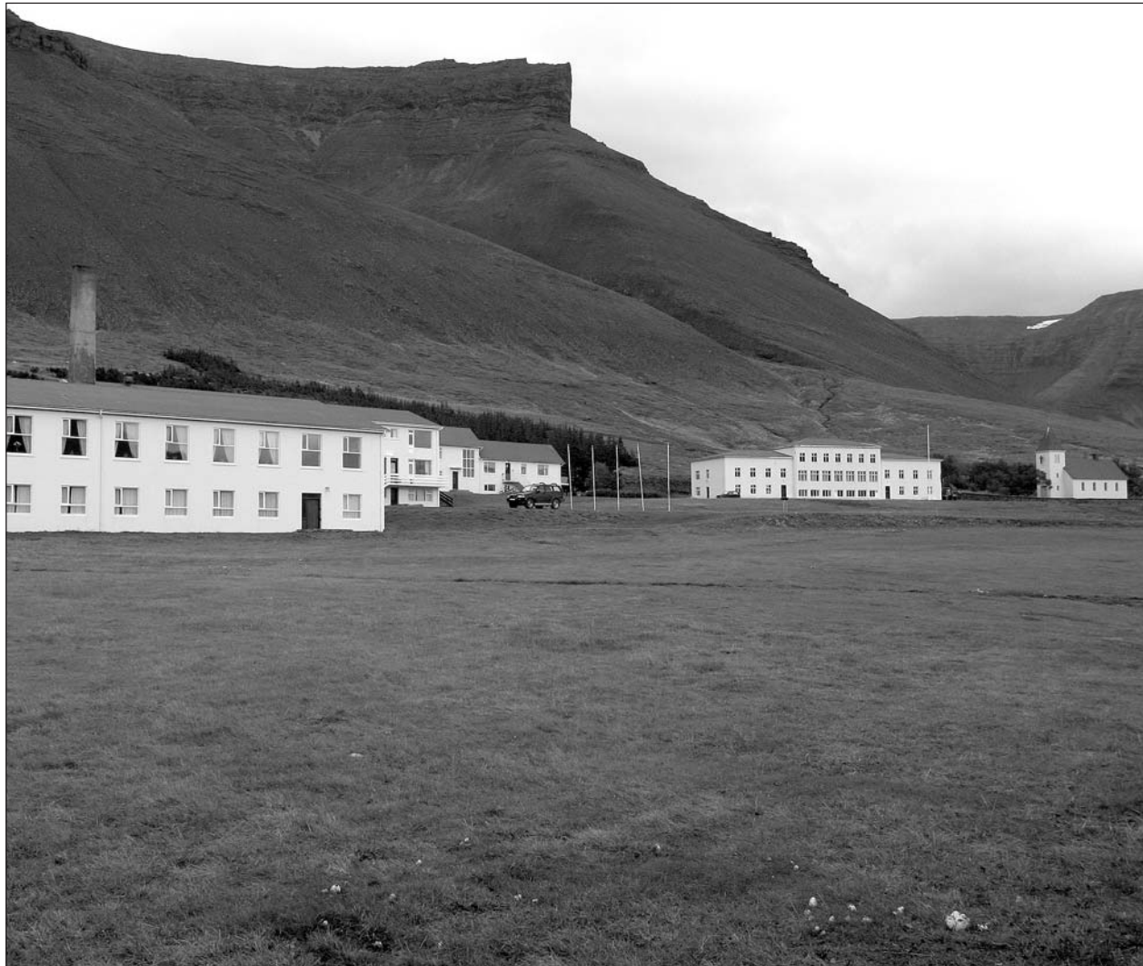
Héraðsskólinn að Núpi.

Mikil fjölgun hefur orðið á háskólanemum frá Vestfjörðum síðasta áratuginn. Alls stunduðu 287 manns með lögheimili á Vestfjörðum háskólanám árið 2006, 115 karlar og 172 konur. Þetta er lítilleg fækkun frá árinu 2005, þegar 301 manns með lögheimili á Vestfjörðum stunduðu háskólanám, en mikil aukning frá árinu 1999, en þá stunduðu 126 manns háskólanám, 41 karl og 85 konur. Fjölgunin er ekki jafn mikil í framhaldsnámi, en árið 2006 sóttu 663 manns með lögheimili á Vestfjörðum framhaldsskólanám, 293 karlar og 370 konur, þar af voru 285 í Menntaskólanum á Ísafirði. Þetta er lítil fjölgun frá árinu 1999, þegar 616 Vestfirðingar stunduðu framhaldsskólanám, 301 karl og 315 konur. Þá voru 292 af þessum 616 skráðir í MÍ. Þetta kemur fram á vef Hagstofunnar. Tölur um skólasókn í framhaldsskólum og háskólum 2006 eru eins og þær voru á miðju haustmíssi 2006.