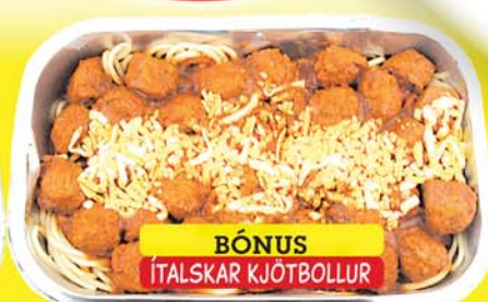
BÓNUS ÍTALSKAR KJÖTBOLLUR