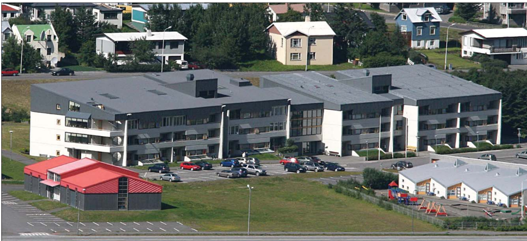
Dvalarheimilið Hlíf á Ísafirði.