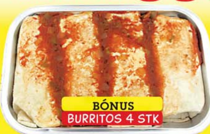
BÓNUS BURRITOS 4 STK