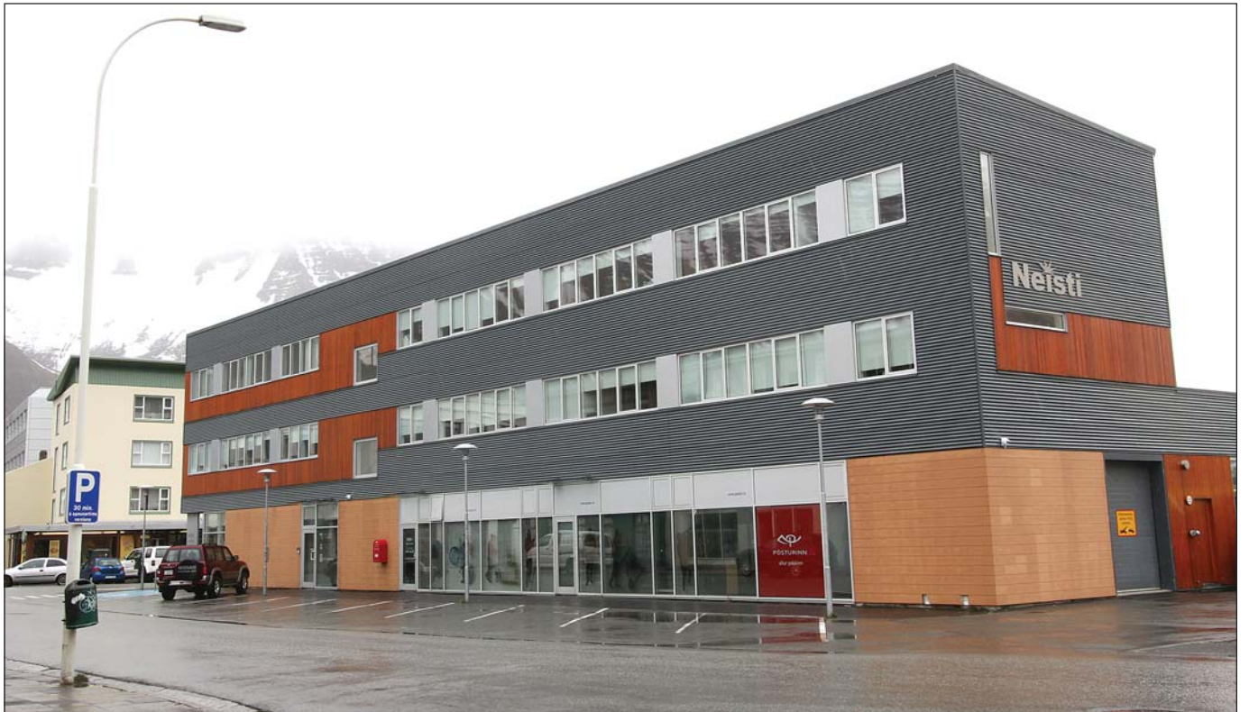
Hrein eign Lífeyrissjóðs Vestfirðinga hækkaði um 1,5 milljarð króna árið 2010.

„Allur lífeyrir fylgir hækkan vísitölu neysluverðs sem hefur hækkað um 89% frá 1. janúar 2000, sem er miklu meiri hækkan en laun á almennum vinnumarkaði hafa hækkað á sama tíma,“