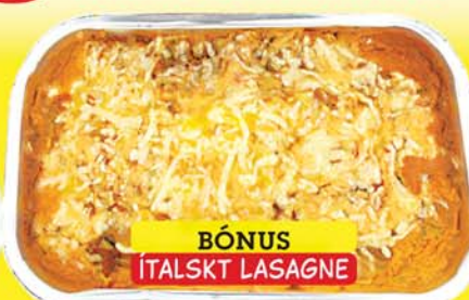
BÓNUS ÍTALSKT LASAGNE