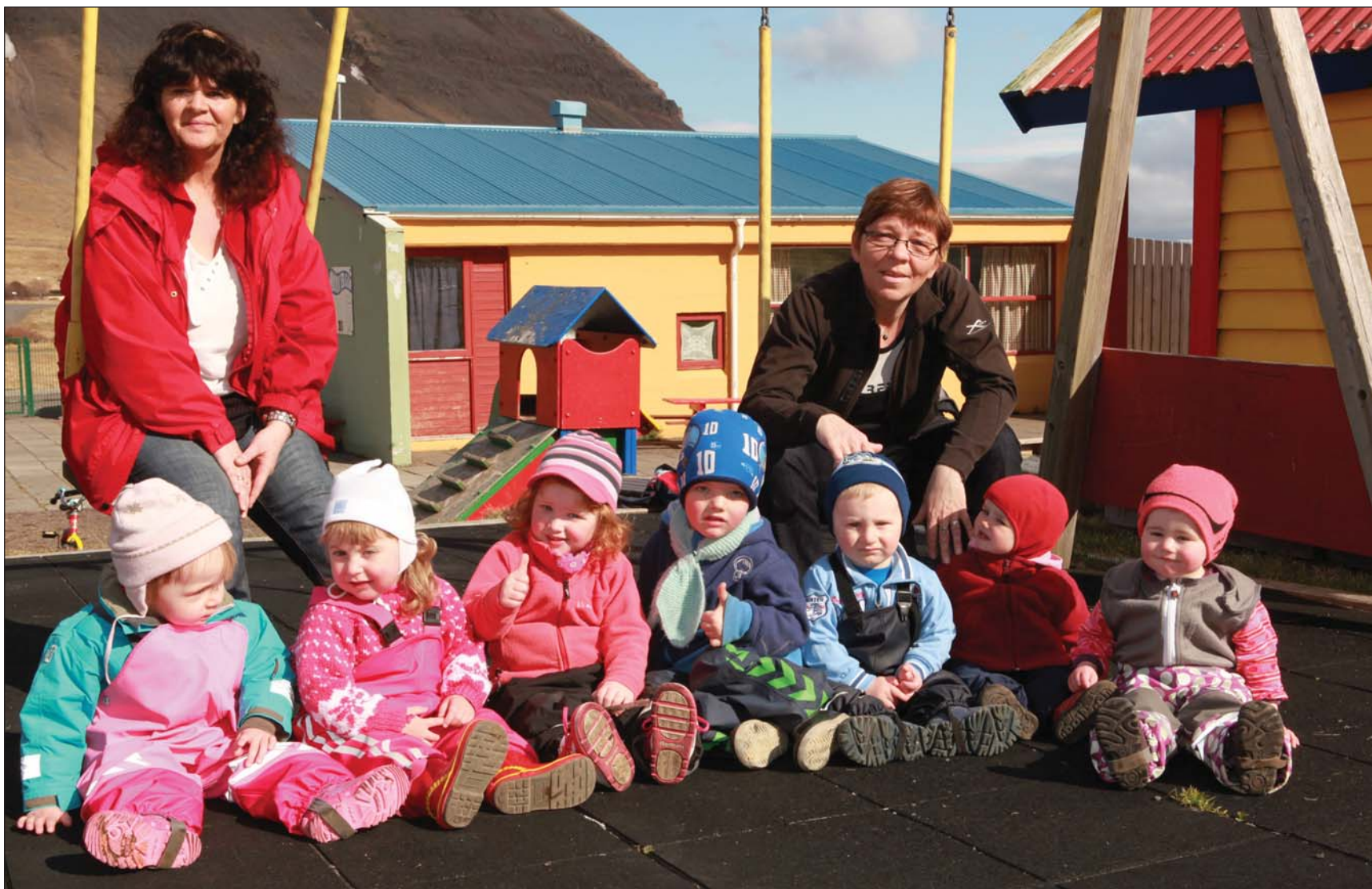
Börn og starfsfólk Bakkaskjólsvorur voru ekki sátt við að segja skilið við skólann.