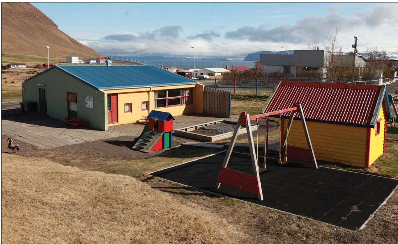
Leikskólanum Bakkaskjólsvorur í Hnífsdal var lokað í síðustu viku.

Bakkaskjólsvorur fagnar 30 ára afmæli í ár en skólanum var komið á kopp fyrir tilstuðlan kvenna í Hnífsdal, sem höfðu þá trú að eftir sameiningu Ísafjarðar og Hnífsdals árið 1971 yrðu Hnífsdælingar látnir sitja á hakanum með leikskóla. Kvenfélagið Hvöt