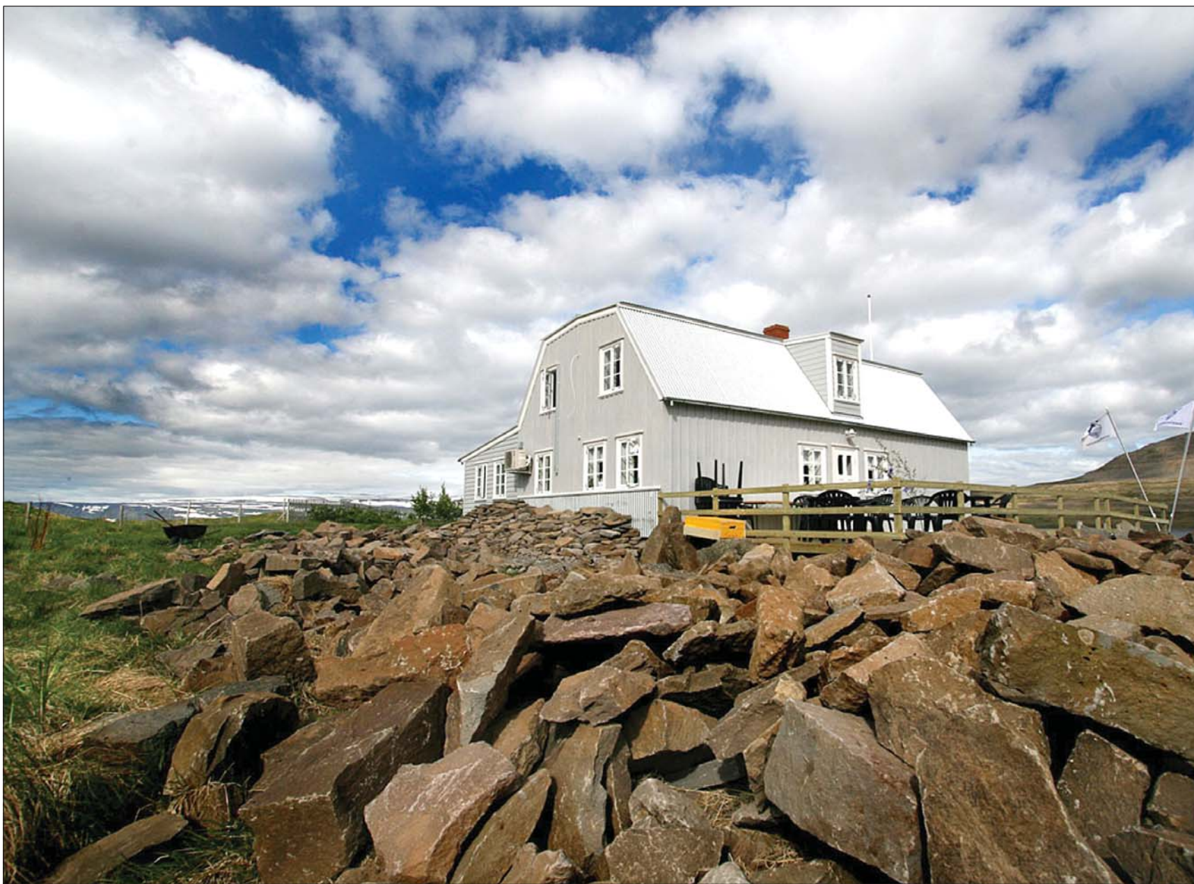
Melrakkasetur Íslands í Súðavík.