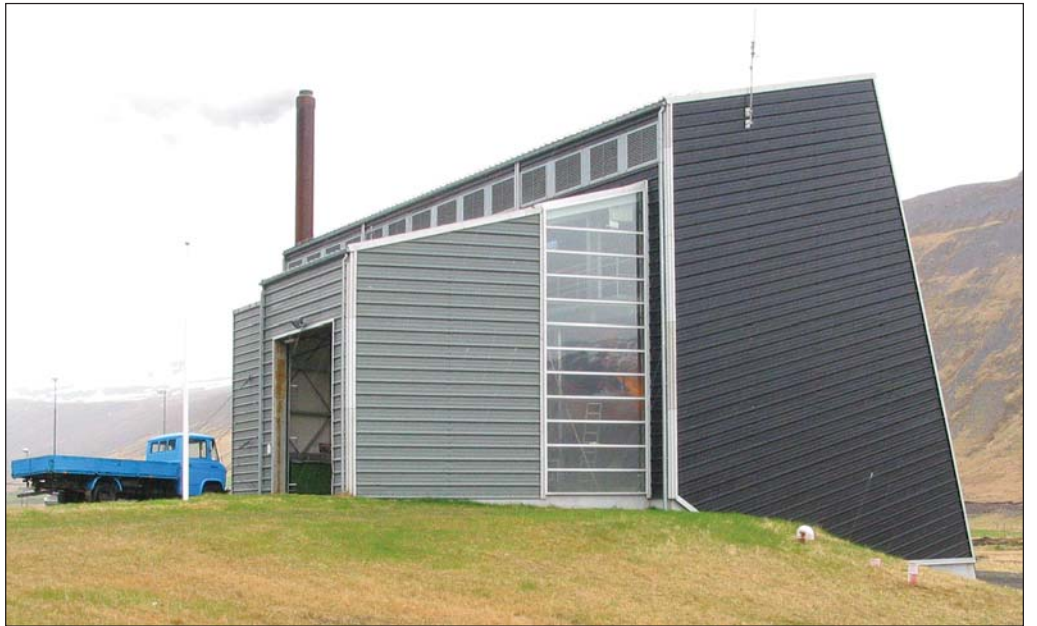
Umhverfissjónarmið og almannahagsmunir komu furðu lítið við sögu bæði þegar sótt var um aðlögun vegna sorpbrennslu og þegar kom að því að fylgja skilyrðum hennar eftir, að mati Ríkisendurskoðunar.

„Ekki var metið hvaða áhættu aðlögunin hefði í för með sér vegna aukinnar mengunar fyrir umhverfi og mannlíf í nágunda við þær stöðvar sem myndu starfa á grundvelli hennar. Engar mælingar á díoxíni lágu til grundvallar fullyrðingum um að mengun væri óveruleg. Engin eiginleg kostnaðargreining var unnin vegna þess kostnaðarauka sem sagt var að rekstraraðilar yrðu fyrir við að uppfylla tílskipunina. Ekki var unnin kostnaðar- og ábatagreining til að meta hvaða kostir væru ákjósanlegastir í úrgangsmálum fyrir landið í heild til framtíðar litið. Þá höfðu umhverfisyfirvöld ekkert frumkvæði að því að kynna niðurstöður díoxínsmælinga sem gerðar voru árið 2007 fyrir íbúum viðkomandi sveitarfélaga eða almenningi al-