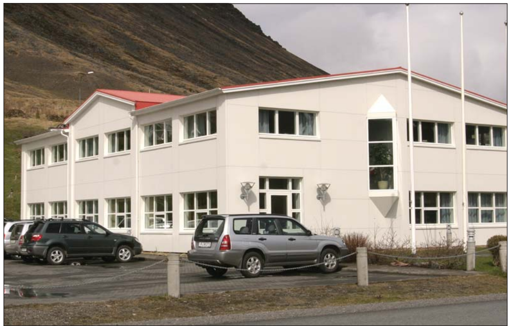
Höfuðstöðvar Orkubús Vestfjarða á Ísafirði.

Á árinu 2009 voru teknar ákvarðanir um virkjunarframkvæmdir og endurnýjun í Mjólkárkirkjun á árunum 2010 og 2011. „Gert er ráð fyrir að kostnaður verði um 1.000 mkr. og stefnir Orkubúinn að því að fjármagna þær með fé frá rekstri á næstu þremur árum, þannig að ekki þurfi að taka langtímalán þeirra vegna. Þetta hefur gengið eftir og var ný 1,2 MW virkjun, Mjólká III, tekin í notkun í lok síðasta árs,“ segir í tilkynningu.