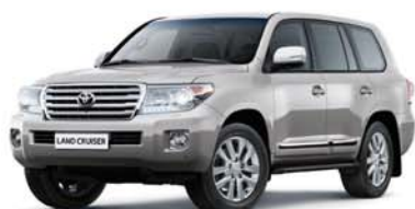
Land Cruiser 200