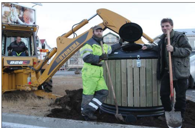
Þegar tunnan var sett á sinn stað á Ísafirði fyrir þremur árum.