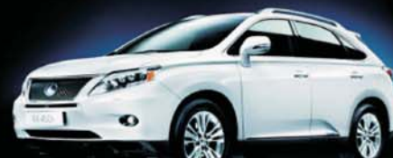
Lexus RX 450h

Laugardaginn 12. maí verður haldin stórsýning á bílum frá Toyota og Lexus í Bílatanga á Ísafirði. Komdu og reynsluaktu vinsælustu bílunum okkar en þar á meðal eru Yaris, Avensis, Land Cruiser 150 og Lexus CT 200h.