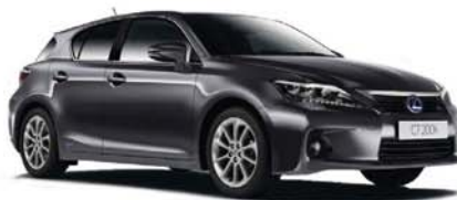
Lexus CT 200h