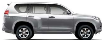
Land Cruiser 150