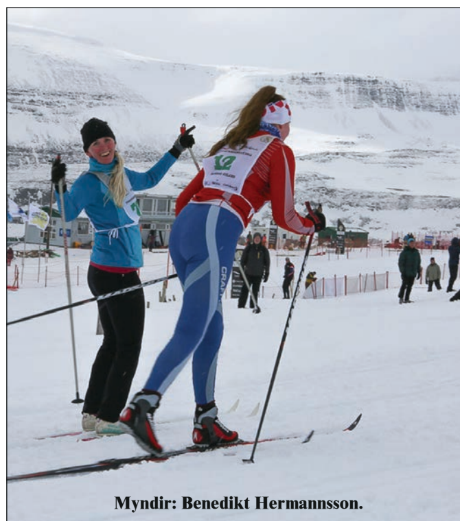
Myndir: Benedikt Hermannsson.