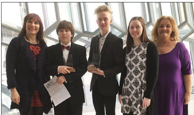
Nemendur með kennurum sínum á Nótunni.