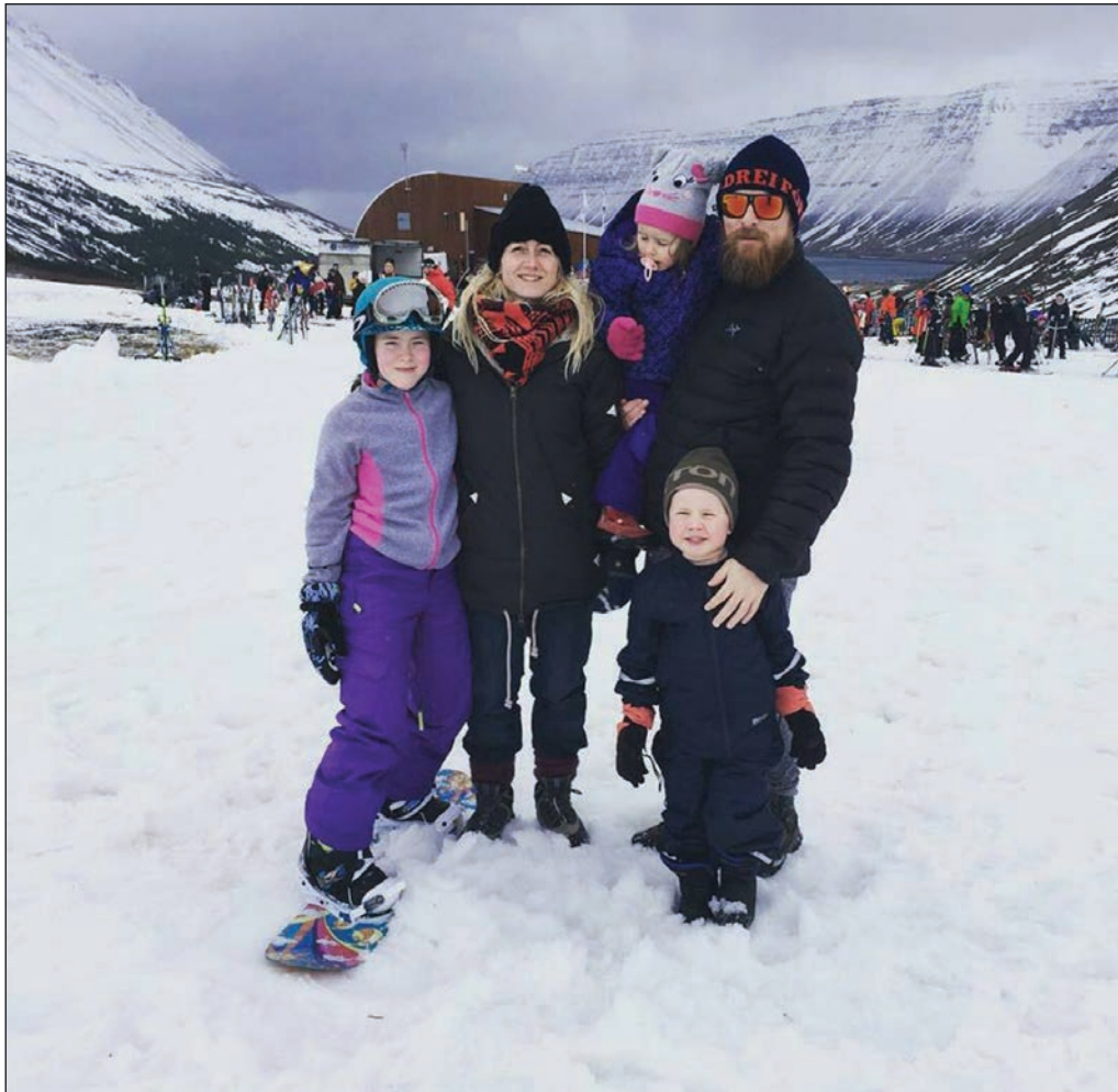
Fjölskyldan í Tungudal um páskana.