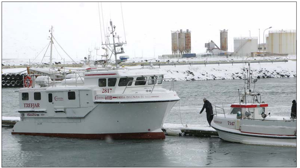
Fríða Dagmar í heimahöfn í Bolungarvík.