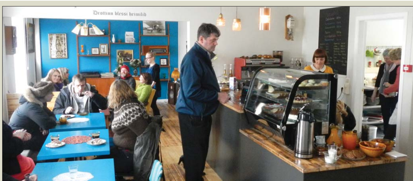
Bræðraborg opnaði á sunnudag.