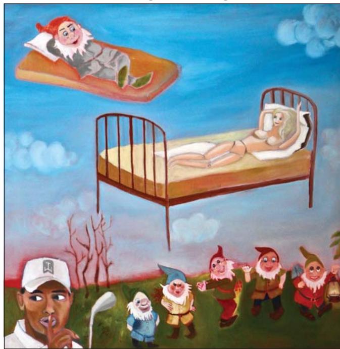
Eitt af málverkunum á sýningunni: Sex undir pari!