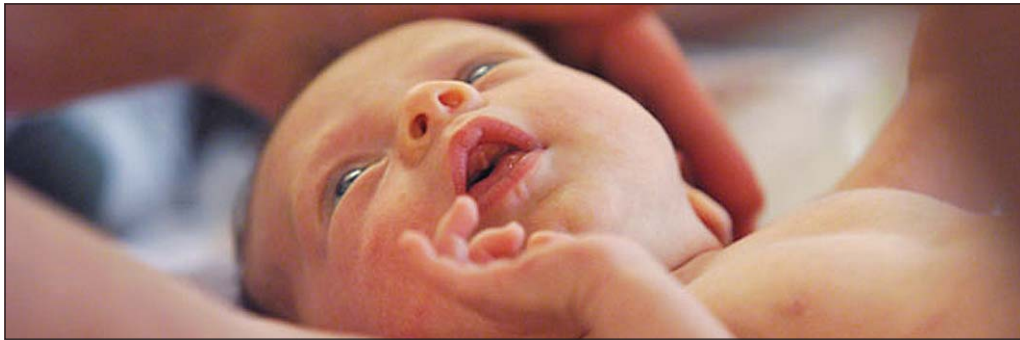
Alls fæddust 98 börn á síðasta ári með lögheimili á Vestfirðum.

Á síðasta ári fæddust 98 börn með lögheimili á Vestfirðum. Um er að ræða fjölgun frá árinu á undan þegar 84 börn fæddust, að því er fram kemur í nýjum tölum Hagstofunnar. Fjöldinn er þó svipaður og síðastliðin 10 ár, því að meðaltali hafi fæðst 96 börn í fjórðungnum á hverju ári á tímabilinu. Flest voru börnin árið 2002 eða 118. Flest barnanna voru með skrásett lögheimili í Ísafjarðarbæ eða 55 og 15 voru með lögheimili í Bolungarvík. Nýfædd börn með lögheimili í Vesturbyggð voru 14 en þau hafa ekki verið svo mörg síðan árið 2005. Þetta nær þó ekki þeim fjölda og var árið 2002 þegar 24 börn fæddust með lögheimili í sveitarfélaginu. Átta einstaklingar fæddust með lögheimili í Strandabyggð árið 2011, þrír í