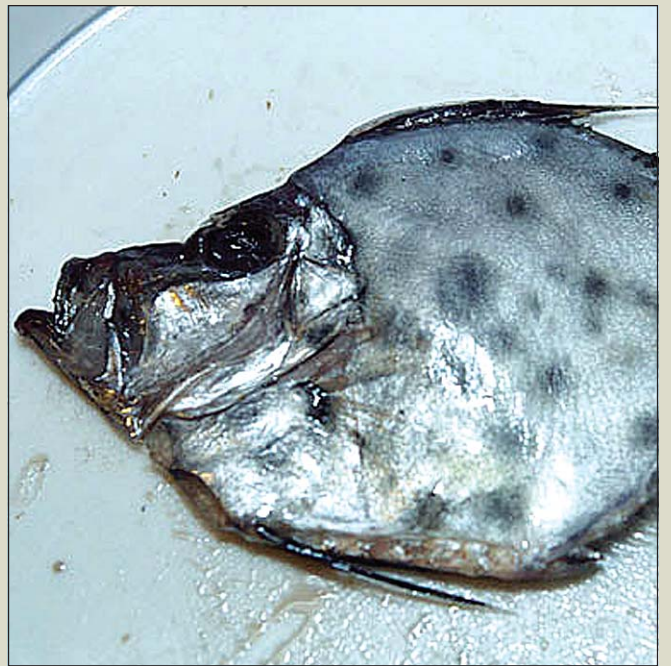
Pálsfiskurinn sem slæddist á land á Ísafirði í venjulegri veiðiferð.

Um er að ræða hávaxinn fisk og mjög þunnvaxinn með allstóran haus og nokkuð stór augu. Kjaftur er mjög stór og þverstæður og geta skoltar glennst vel út. Tennur á skoltum eru smáar til meðalstórar. Bakuggi er tvískiptur og er fremri hluti hans hár og broddgeisl- aður og teygjast fremstu geislar hátt upp en aftari hluti er lægri og með liðgeislum. Þrír fremstu geislar raufarugga eru brodd-