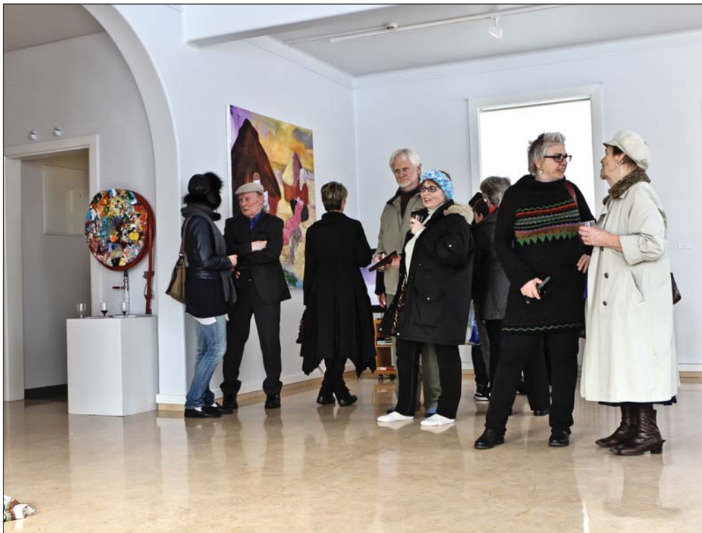
Vel var mætt á opnunina.