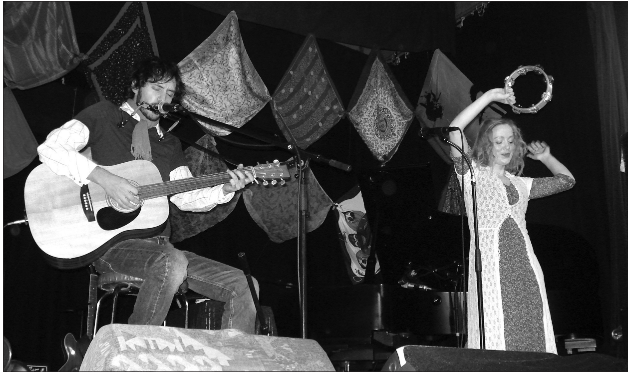
Sviðið var skreytt með „höfuðslæðum“ í öllum litum.

Horfur á föstudag: Breytileg eða norðlæg átt og él eða snjócoma, en léttir til austanlands. Kólnandi veður. Horfur á laugardag: Norðvestanátt og él á Norðausturlandi, en annars léttskýjað að mestu. Frost 0-5 stig. Horfur á sunnudag: Hæg breytileg átt og víða bjartveðri. Frost 0-8 stig en hlýnar suðvestantil.