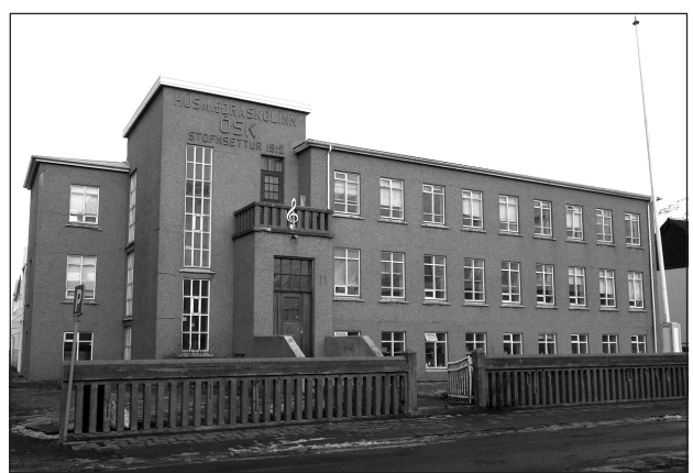
Ráðstefnan verður haldin í Hömrum.