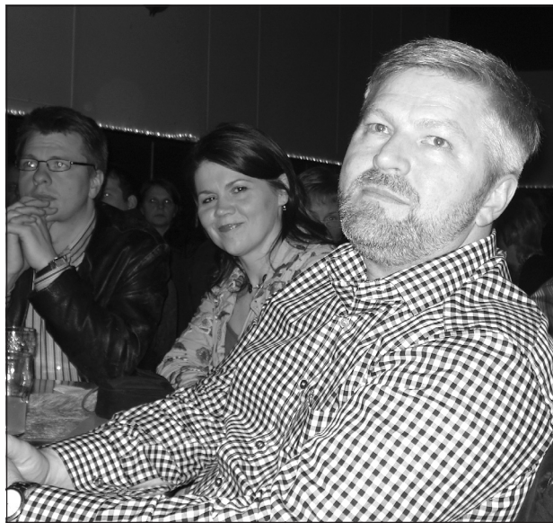
Húsfyllir var á tónleikunum.