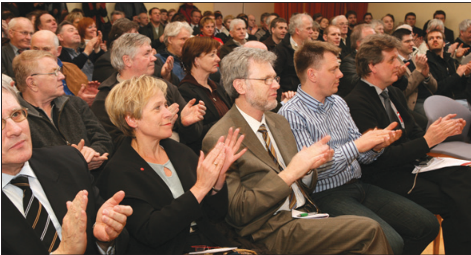
Frá borgarafundinum sem haldinn var í Hömrum á sunnudag.