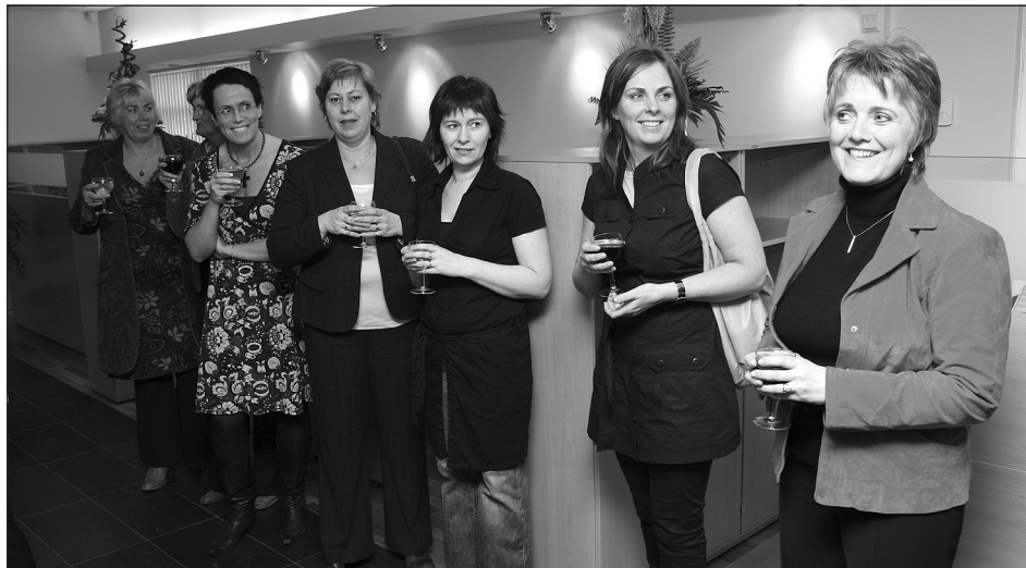
Starfsfólk Sparisjóðs Vestfirðinga var ánægt með flutninginn.