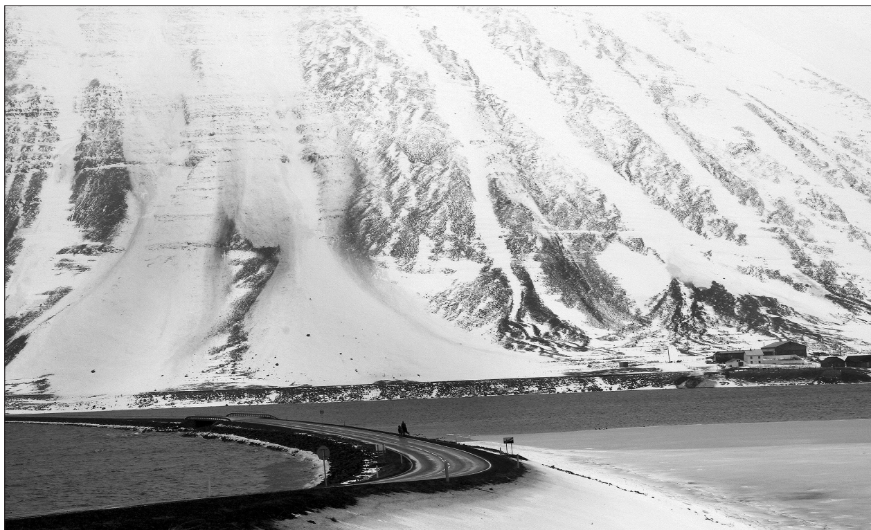
Flóðin tvö sem féllu fyrir utan bæinn Höfða.