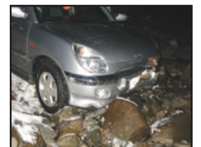
Frá slysstæð á Hnífsdalsvegi

Fundinum lauk með því að viðstaddir þingmenn sam-mæltust um að funda og ræða sameiginlegan tillöguflutning um atvinnumál á Vestfjörðum. – annska@bb.is