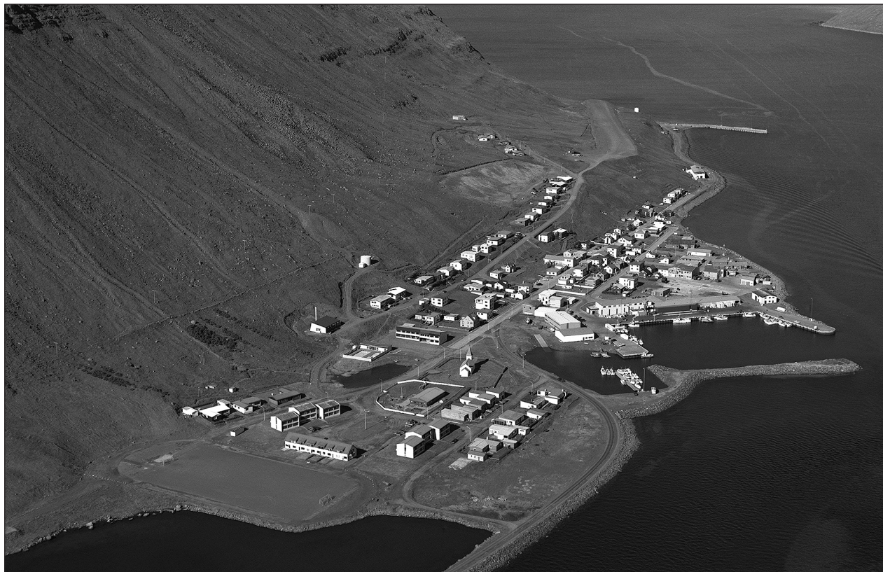
Suðureyri við Súgandafjörð.