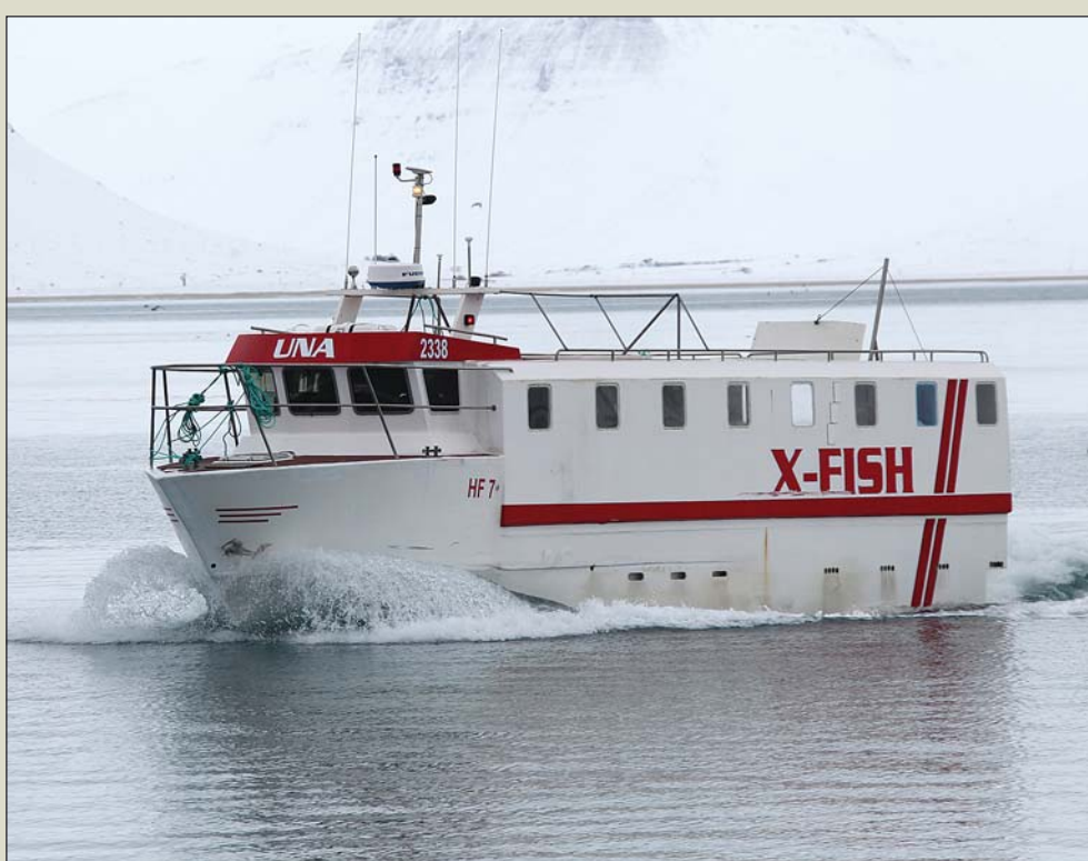
Una HF 7.