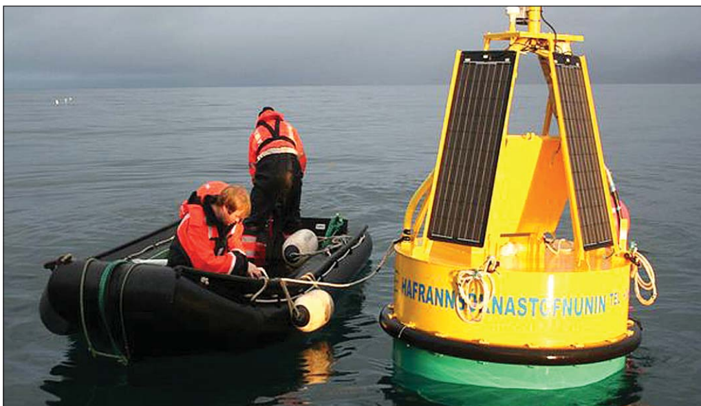
Veidar með ljósum eru mun umhverfsvænni en hefðbundin veiðarfæri og lágmarka til dæmis röskun á sjávarbotni auk þess sem þær draga mjög úr olíunotkun.