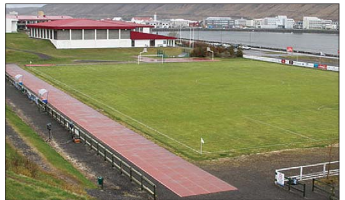
Fyrirhugað er að áhorfendastúka risi við Torfneshöfðuna.

Undanfarin ár hefur sú stefna legið fyrir í Ísafjarðarbæ að HSV leggi stefnuna um áherslur og forgangsroðun í uppbyggingu íþróttamannvirkja. Með það vinnulag til hliðsjónar er eðlilegt að viljrði um fjárframlag Ísafjarðarbæjar í tengslum við stúkubyggingu séu til HSV og þeim falið að leita hagkvæmustu og bestu leiðanna til að leysa þetta mál,“ segir í greinargerðinni.