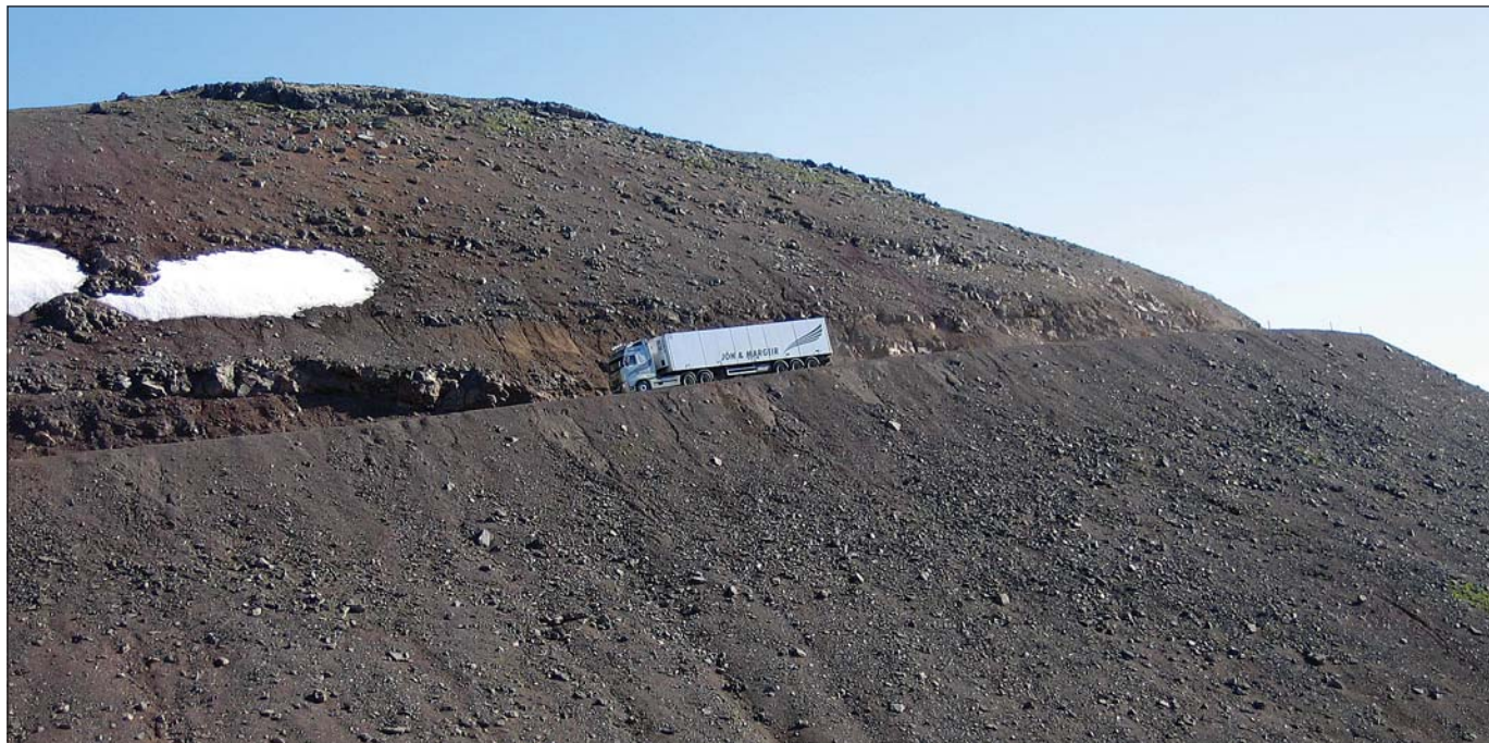
Hrafseyrarheiði hefur verið lokuð frá 12. desember.