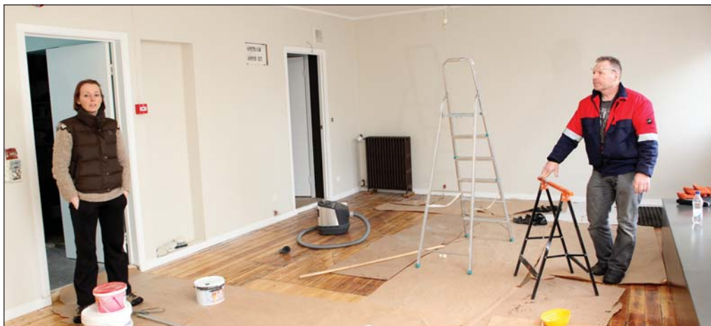
Unnið er hörðum höndum að því að standsetja húsnæðið.