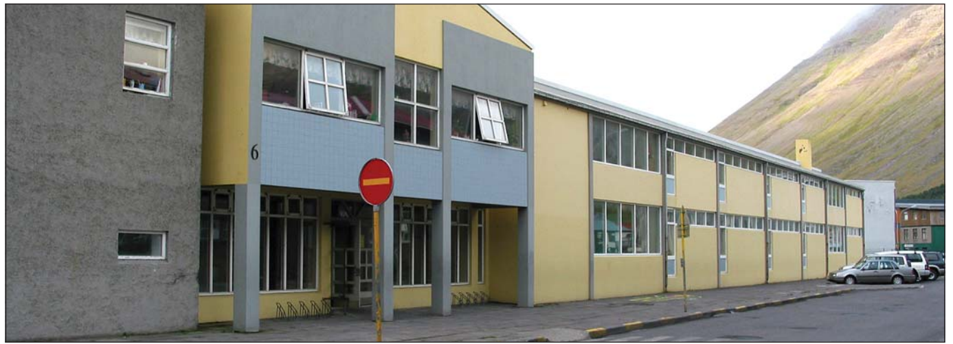
Fyrir tuttugu árum voru fleiri í skólum núverandi Ísafjarðarbæjar en nú er á öllum Vestfjörðum.

Að því er fram kemur í fundargerð bæjarráðs Bolungarvíkur er tilefni bréfa-skriftanna fyrirhugað útboð Ísafjarðarbæjar á almenningsamgöngum þar í bæ.