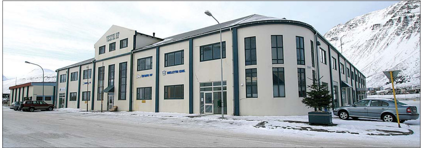
Lagt hefur verið til að Fjórðungssambandið taki yfir rekstur Atvinnuþróunarfélagsins á meðan verið að skoða málin.

Framkvæmdastjóri Fjórðungssambandsins verður jafnframt