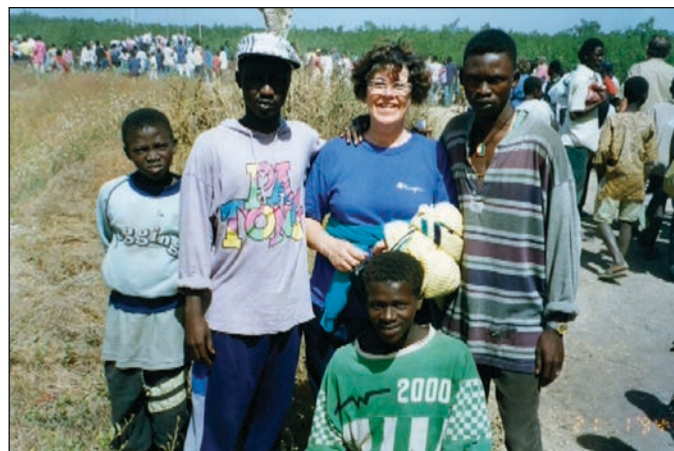
Með innfæddum í Gambíu.

„Þar voru tvö herbergi undir dúkkusafni hennar og ég hugsaði með mér hversu skemmtilegt það væri ef við gætum gert eitthvað svona í einhverju þeirra fallegu húsa sem hér á Ísafirði eru, það myndi gera svo mikið