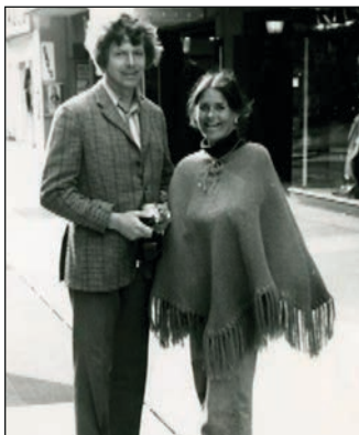
Á ferðalagi í Englandi.