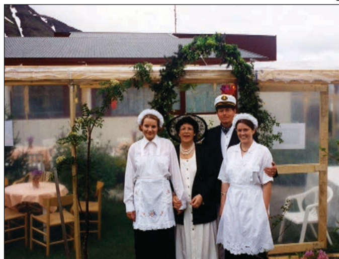
Garðveisla í Sunnuholtinu.

„Mig svo sem grunaði að þetta væri það sem hrjáði mig og svo kom lækurinn með fréttirnar og