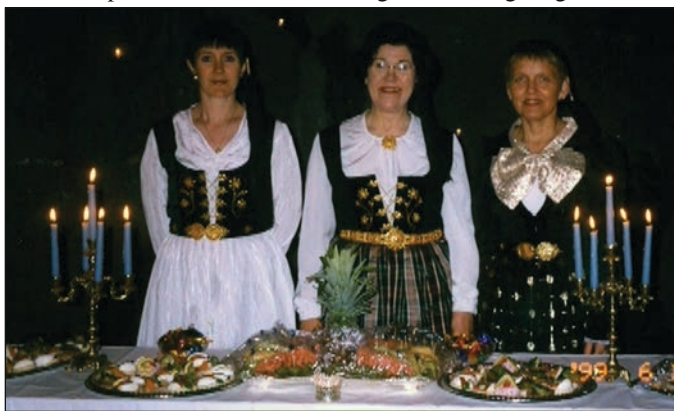
Með veisluborð í Vestfjarðagöngum.

„Ég var lengi vel mjög virk í Hlíf, en svo var það þannig að kvenfélagsstörfin fóru ekki vel með verslunarekstri þar sem ég var svo oft að vinna um helgar. Aldrei gat ég heldur verið í saumaklúbb af sömu sökum, vegna kvöld- og helgarvinnu.