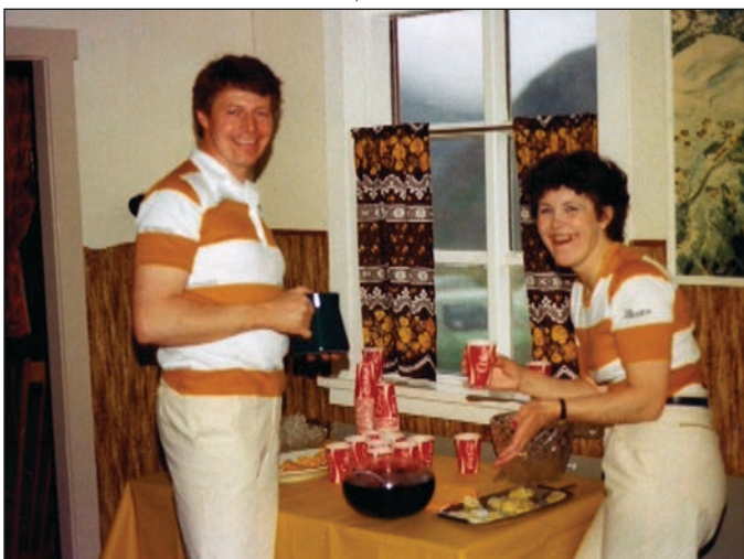
Á ættarmóti í Skíðaskálanum.