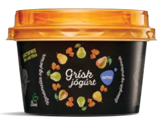
Karamella og perur