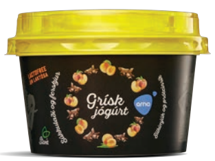
Súkkulaði og ferskjur