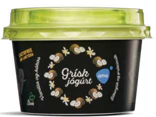
Vanilla og kókos