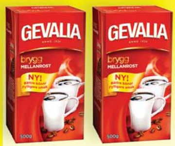
GEVALIA KAFFI BRYGG MELLANROST NÝ GERÐ MEÐ BETRI FYLINGU 495 KR. 500g