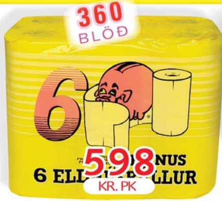
BÓNUS ELDHÚSRULLUR 6x60 BLÖÐ ÍSLENSKUR IÐNAÐUR