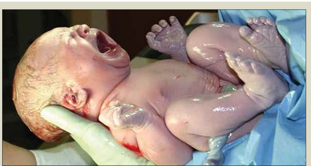
85 börn fæddust á Vestfjörðum á síðasta ári.

„Ég ólst upp í fjörunni og ætlaði mér að verða sjómaður þó svo að ég hafi leitað annað. Eftir stúdentspróf nennti ég ekki lengur í skóla og fór á skrifstofu, leiddist þar og fór á sjó, var smátíma á tveim togurum, einnig á bátum, síld m.a. Ég hef alltaf verið mikið fyrir báta, pabbi átti smátrillu og þegar ég bjó erlendis átti ég alltaf seglskútu, raunar aðeins 16 fet, en svo uppfærði ég þær og sú síðasta var best. Hún brotnaði svo illa í óveðri að ég