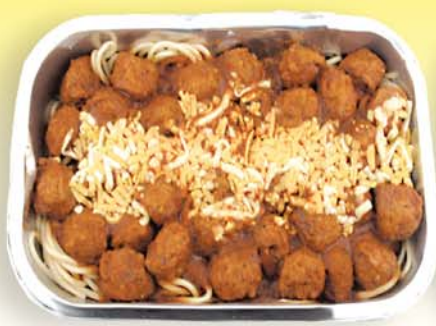
BÓNUS ÍTALSKAR KJÖTBOLLUR