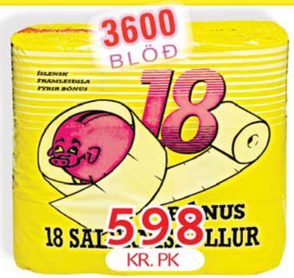
BÓNUS WC PAPPÍR 18x200 BLÖÐ ÍSLENSKUR IÐNAÐUR