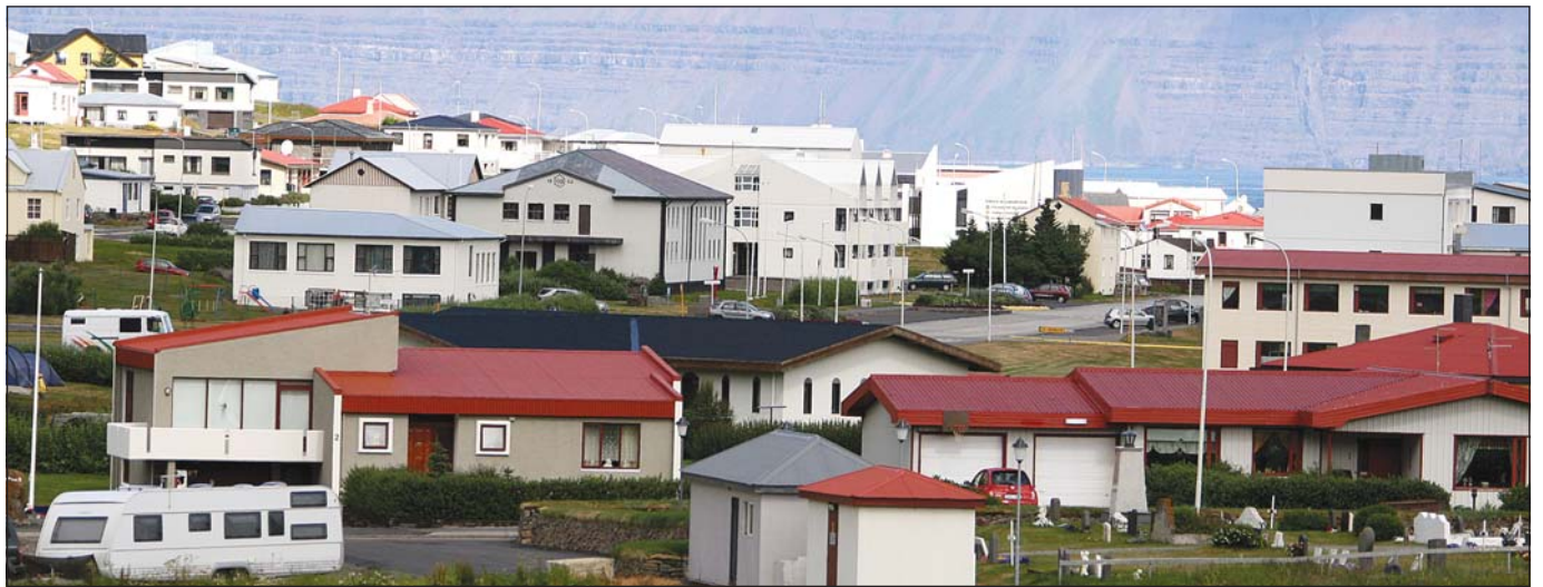
Áætlað er að Vestfirðir fái rúmar 180 milljónir í almenn fjárlög úr Jöfnunarsjóði vegna þjónustu við fatlaða.

Til sölu eða leigu er íbúð að Fjarðarstræti 2 á Ísafirði. Hægt er að skoða eignina nánar á vef Fasteignasölu Vestfjarða. Uppl. í síma 866 9545.