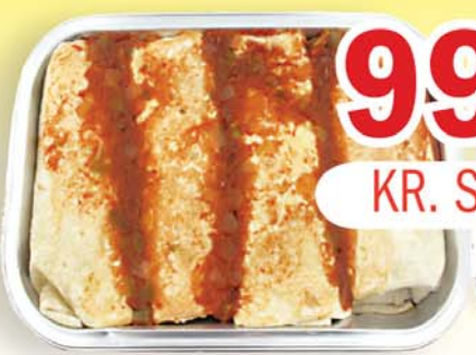
BÓNUS BURRITOS 4 STK.