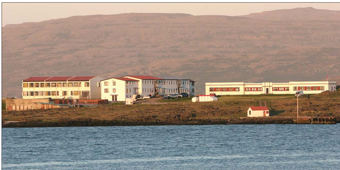
Ferðþjónustan í Reykjanesi fékk 2 milljónir króna fyrir verkefnið Vatn og veisla í Reykjanesi.

Eins og greint hefur verið frá óskuðu ferðþjónustuað- ilar í Bolungarvík eftir því við bæjaryfirvöld að sett yrði upp farþegabryggja í bænum þar sem mjög mikil aukning hefur orðið á farþegafjölda sem fer um höfnina á hverju sumri. Samkvæmt bréfi ferða- þjónustuaðila stefnir allt í að um 4000 manns fari um höfnina í sumar.