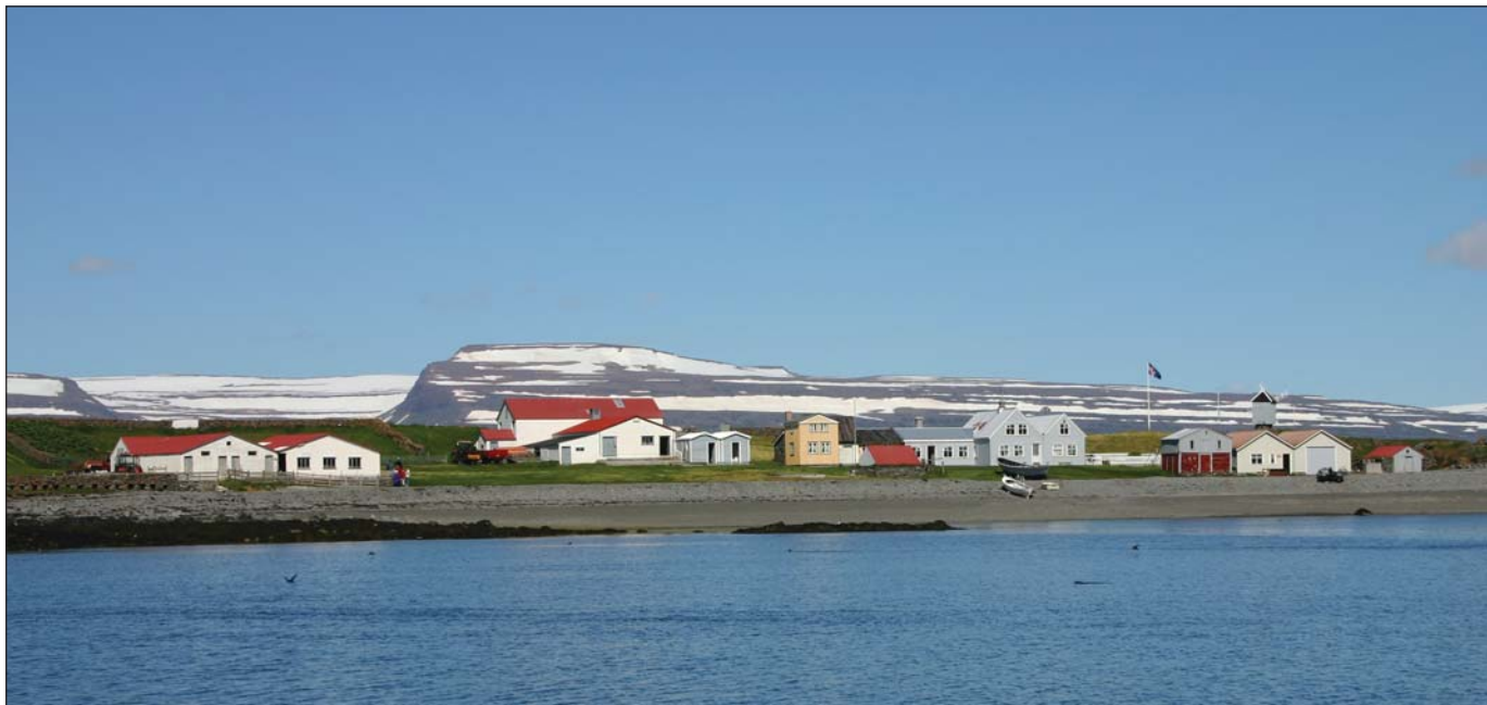
Vigur í Ísafjarðardjúpi.