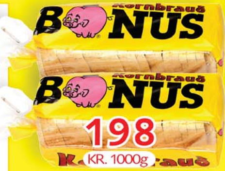
BÓNUS KORNBRAUÐ HEILT KÍLÓ FRÁBÆRT VERÐ 26 SNEIÐAR