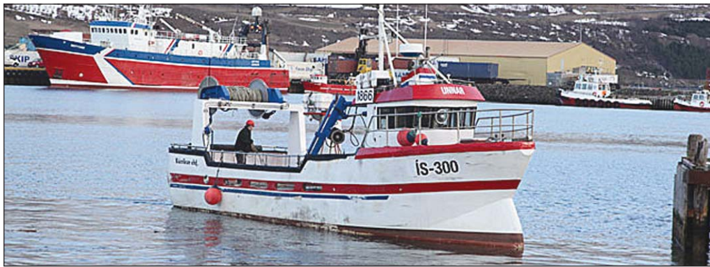
Unnar ÍS 300.