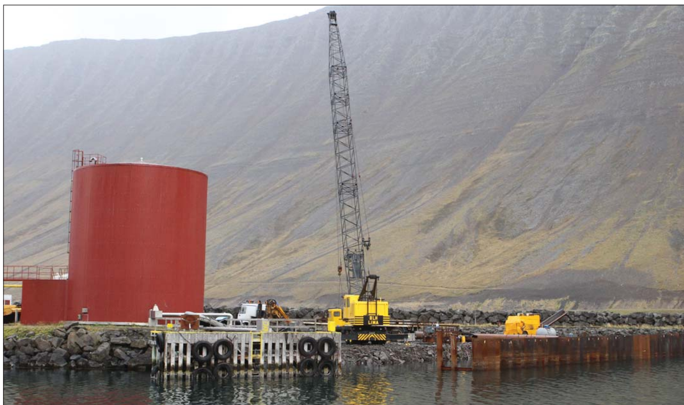
Frá Sundahöfninni á Ísafirði.

„Ég vil benda á að þetta hafnarmannverki verður ekki nothæft nema að það verði dýpkað við Mávagarð (ríkishluti 75%) þó svo að það hafi verið hægt að taka skip upp að við gömlu aðstöðuna (sem nú þegar hefur verið rifin niður) en þess ber að geta að stefnan á þeirri bryggju lá sunnan við suðaustur en viðlegustefna við nýju bryggjuna er töluvert norðan við þá stefnu, inn á