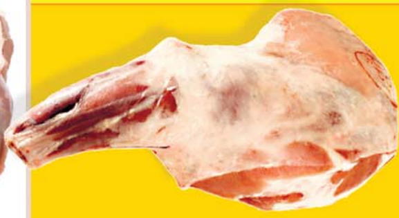
K.S FROSINN LAMBABÓGUR 798 KR.KG.