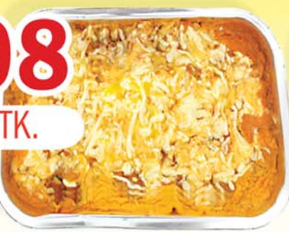
BÓNUS ÍTALSKT LASAGNE