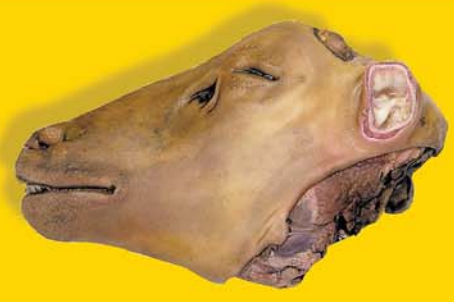
KS FROSIN LAMBASVIÐ 259 KR.KG.