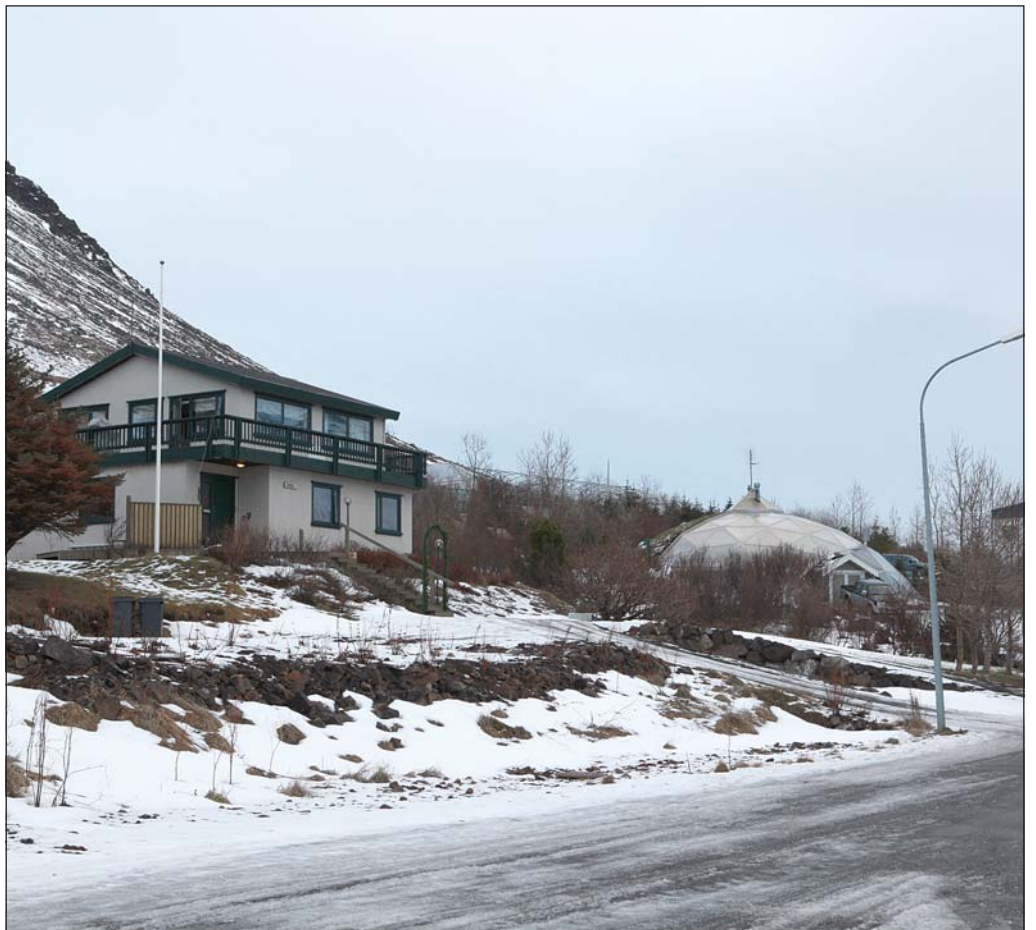
Seljalandsvegur 102 og 100 á Ísafirði.

Þjóðbúningafélags Vestfjarða hefur óskað eftir afnoti af skólaláhúsnæði Grunnskólans á Þingeyri dagana 3.-9. júlí, en á þeim tíma verða starfræktar þar handverksbúðir í samstarfi við Heimilisíðnaðarfélagið og samtök norrænna heimilisíðnaðarfélaga, Nordens Husflidsforbund. Gert er ráð fyrir um 130 – 150 þátttakendum frá Norðurlöndunum. Fræðslunefnd hefur lagt til við bæjarstjórn Ísafjarðarbæjar að styrkur bæjarfélagsins til verkefnisins felst í láni á grunnskólanum á Þingeyri til kennslu, þó þannig að skólinn beri ekki kostnað af verkefnum.