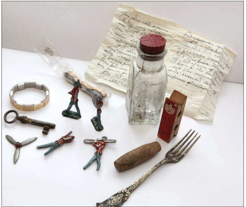
Bréfið var geymt í glerflösku og hefur varðveist vel. Munirnir sem fundust voru m.a. lykill, gafall, tindátar, armbönd og tré tappi.