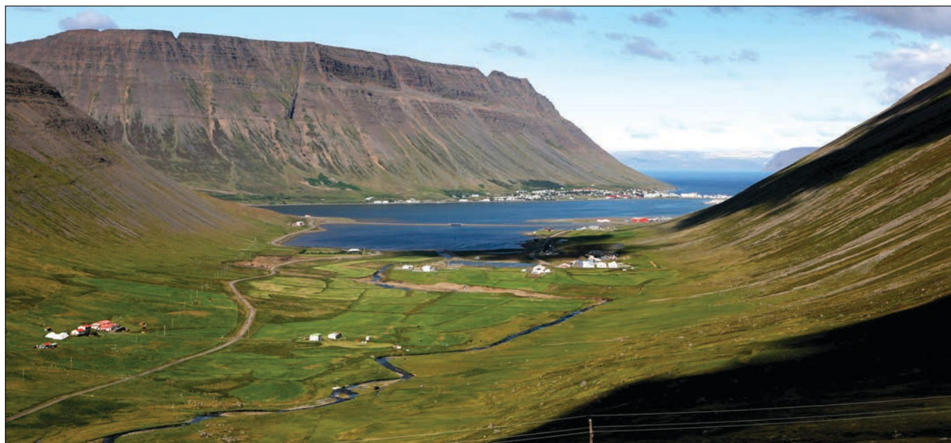
Engidalur í Skutulsfirði.

Bann var sett við sölu allra afurða frá bænum Efri-Engidal í desember 2010, í kjölfar þess að styrkur díoxín í mjólk fór yfir leyfileg mörk, og einnig var sett bann við flutningi á lifandi dýrum frá bænum. Sýni sem tekin voru í upphafi árs 2011 af lambakjöti,