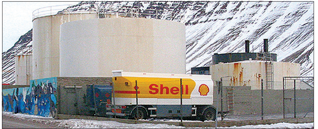
Olíubirgðastöð Olíudreifingar á Ísafirði.