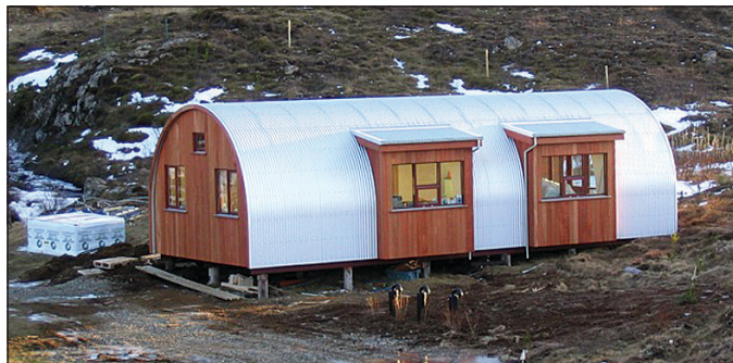
Braggahús á Útnyrðingsstöðum, austur á Héraði. „Ég smíðaði þetta hús árið 2006 en það er 70 fermetrar. Eigendurnir nota það sem heilsárshús.“

Við píláranna hafa verið skornar út rómverskar tölur. „Já, stig-inn verður tekinn í sundur hér í