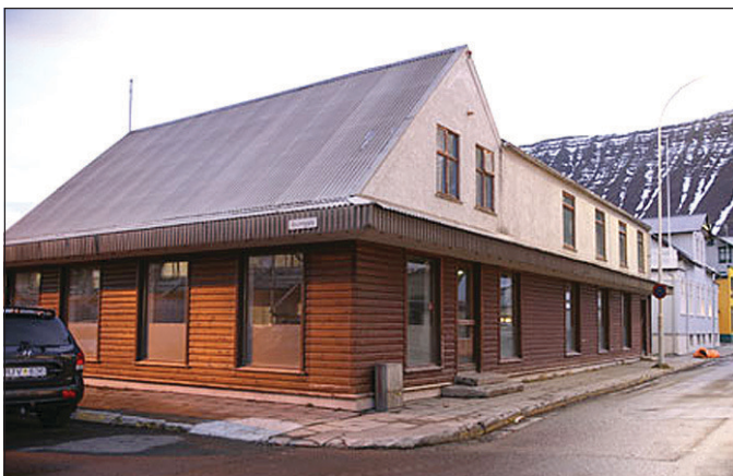
Norska bakaríið svokallaða að Silfurgötu 5.