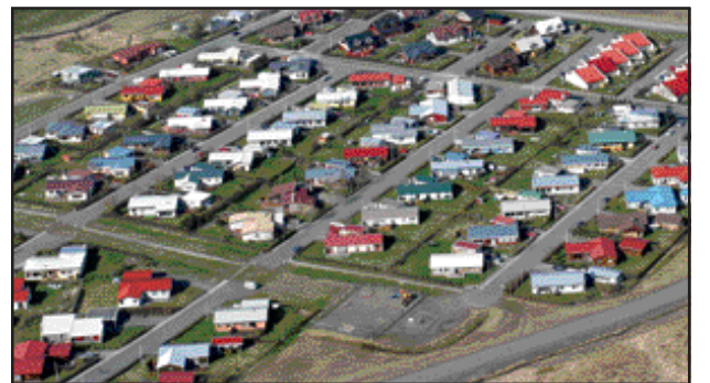
Álögð fasteignagjöld fyrir 2007 hjá Ísafjarðarbæ eru alls 336,6 millj.kr.