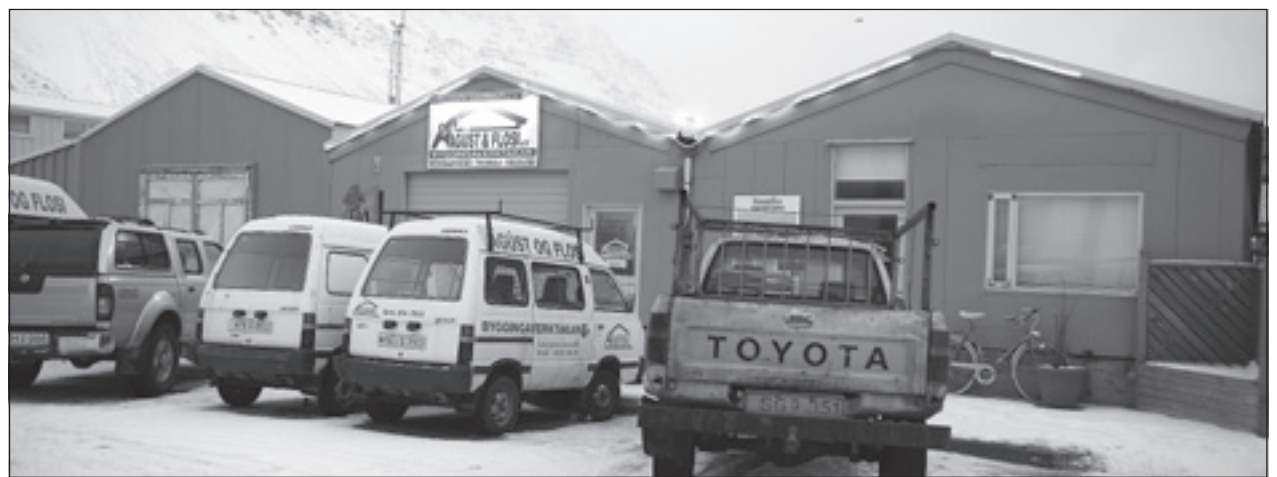
Höfuðstöðvar verktakafyrirtækisins Ágúst og Flosa ehf., sem varð gjaldþrota fyrir stuttu.