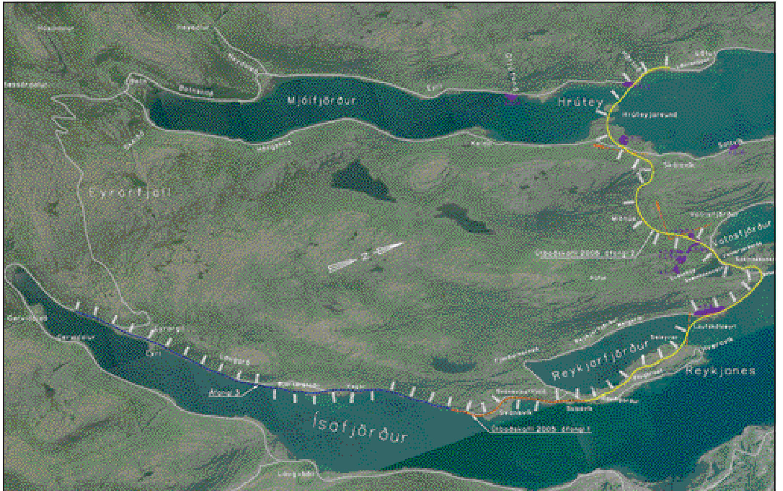
Afstöðumynd af vinnusvæðinu í Mjóafirði og Ísafirði í Ísafjarðardjúpi.

Lögreglumenn í eftirlitsferð óku fram á bílveltuvíð Kaldá í Önundarfirði í byrjun síðustu viku. Ökumaður jeppa, sem var einn í bílnum, hafði misst stjórn á honum í hálfu og jeppinn olti út fyrir veginn. Ökumaðurinn hafði ekki slasast en jeppinn var nokkuð skemmdur og var fluttur óökuhæfur af vettvangi.