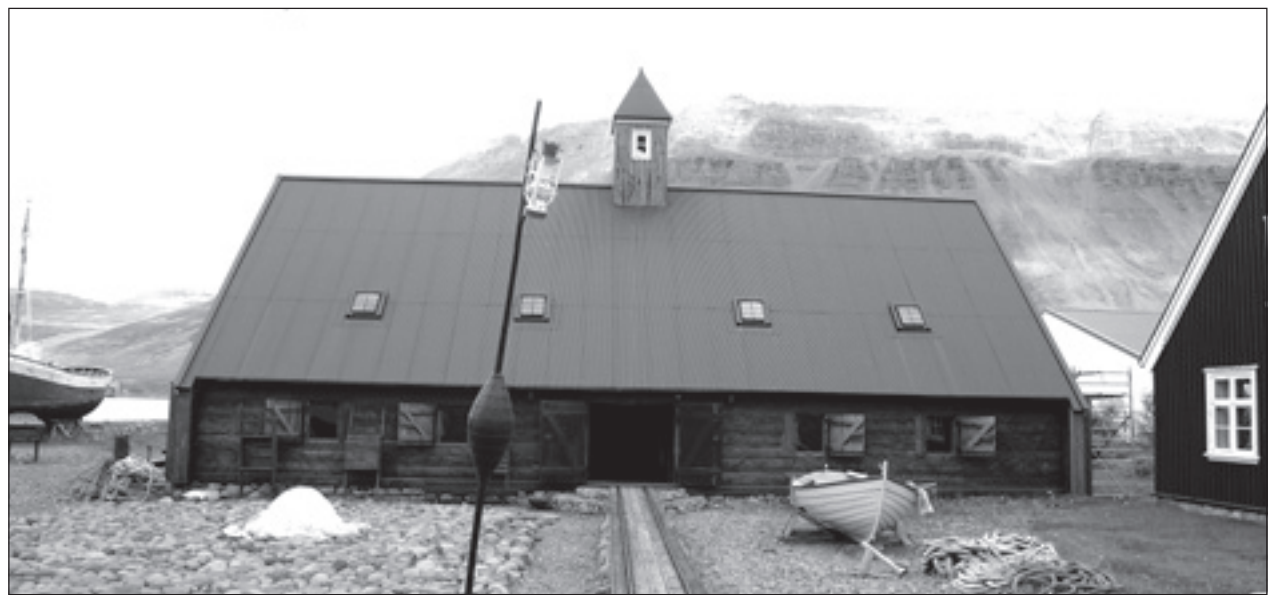
Byggðasafnið í Neðstakaupstað.