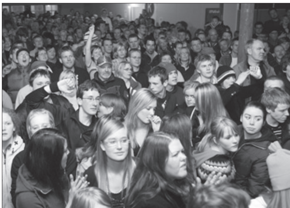
Aldrei fór ég suður er einn af helstu viðburðum ársins á Ísafirði.