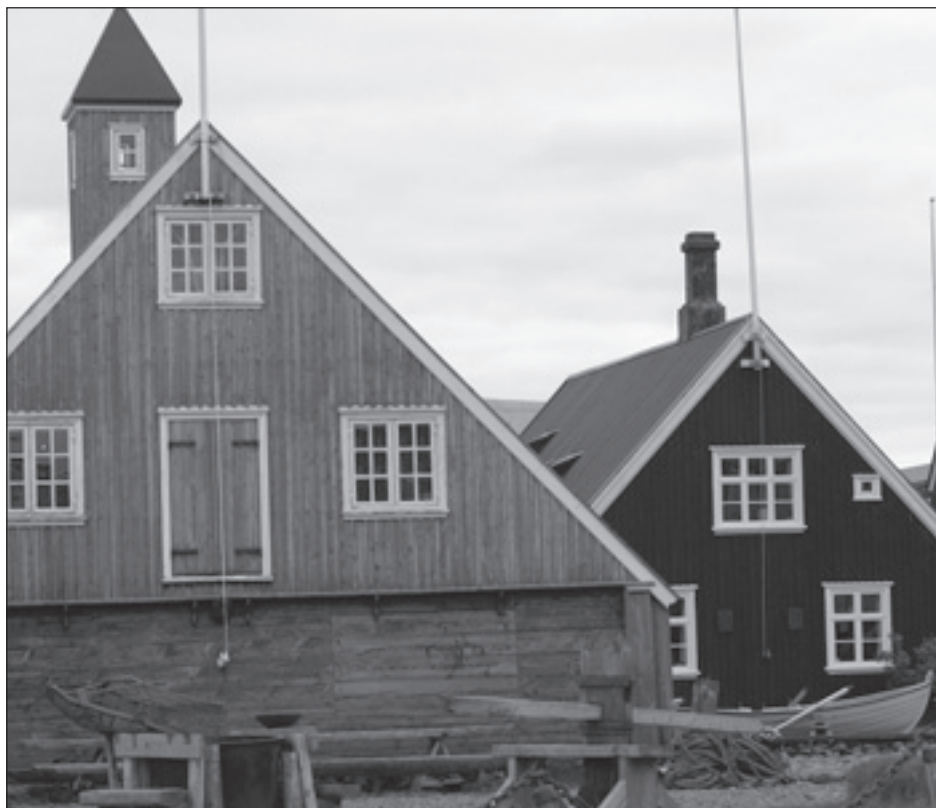
Byggðasafn Vestfjarða er staðsett í Neðstakaupstað.