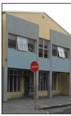
Grunnskólinn á Ísafirði.