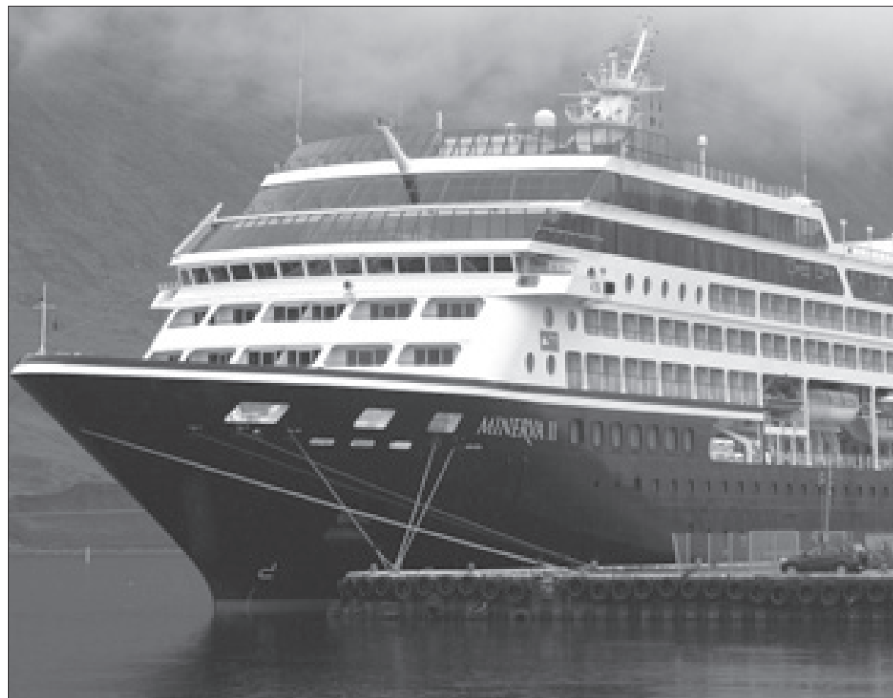
Minerva er fyrsta klassa skemmtiferðaskip sem hafði viðdvöl á Ísafirði sl. sumar.

Fundurinn sátu ferðamálafulltrúi Ísafjarðarbæjar, hafnarstjóri, leiðsögufólk, fulltrúar Vesturferða, Byggðasafnsins, upplýsingamiðstöðvarinnar og Markaðsstofu Vestfjarða. Bæjarráð Ísafjarðarbæjar tók erindið fyrir á síðasta fundi og vísaði því til kynningar í hafnarstjórn og atvinnuámalnefnd. — annska@bb.is