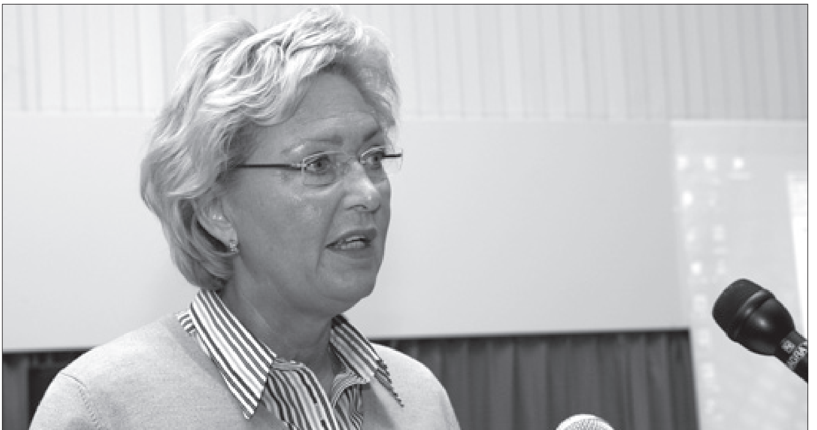
Jónína Bjartmarz umhverfisráðherra á Hornstrandaráðstefnunni.

Jónína sagði að með friðlýsingunni hefði verið tekin ákvörðun um að nýta landið til náttúruverndar, útivistar og annarrar ferðamennsku og segir hún því að skipulagning svæðisins hljóti að taka fyrst og fremst mið að því. Hún segir það hins vegar mikilvægt að gera sér grein fyrir því að landið sé í einkaeigu og þess vegna sé nauðsynlegt að við skipulagningu þess, verði tekið á því hvernig samarhúsabyggingin geti þróast og að skilgreina þurfi verndarmarkmið svæðisins í heild, og