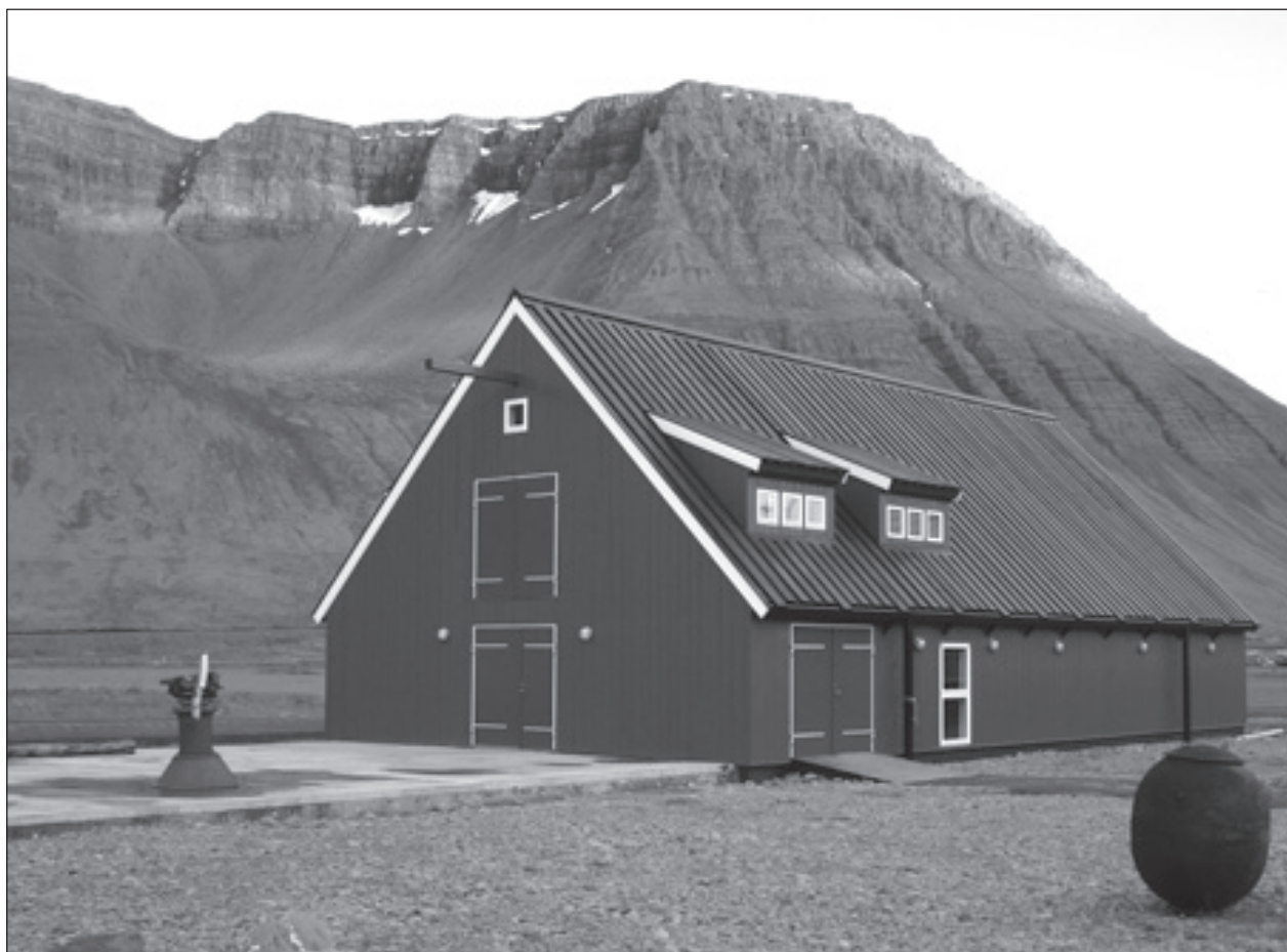
Geymsluhúsnæði Byggðasafns Vestfjarða í Neðstakaupstað.