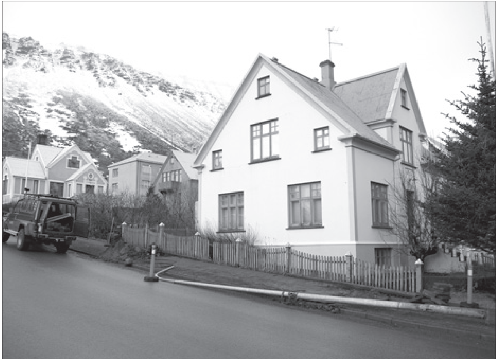
Túngötu 1 og staurinn sem hefur nú verið fjarlægður.