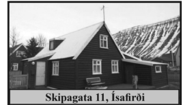
Skipagata 11, Ísafirði

78,4 m 2 einbýlishús úr timbri á tveimur hæðum ásamt eignarlóð, tvö svefnherbergi.