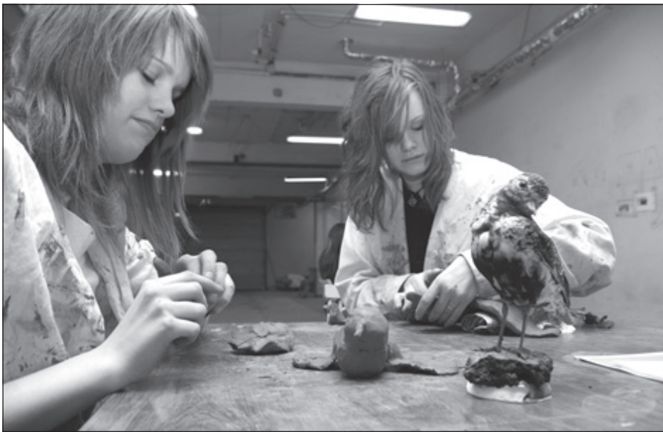
Einbeitingin skín úr svip stúlkanna við listöjuna.

Um síðastliðna helgi var fyrsta vinnustofan af þeim fjórum sem fyrirhugaðar eru í leirlóugerð fyrir nýja altarisöflu Ísafjarðarkirkju. Vinnustofan er í Vestrahúsinu þar sem áður var til húsa meðal annars flóamarkaður JC og vörulager Vífilfells. Í þessari atrennu voru gerðir í kringum 90 fuglar sem koma eflaust til með að sóma sér vel í fyrirhugaðri altarisöflu. Fuglarnir eru merktir og nöfn þeirra, sem þá gerðu er skráð niður og haldið til haga. Næstu vinnustofur verða frá 25. febrúar til 4. mars, og verða þær opnar frá 10-18 alla dagana. Síðasta vinnustofan er svo í dymbilvikunni, þannig að brottfluttum sem koma í heim-sókn á fornar slóðir um páska-ana gefst kostur á að gera sinn fugl. Hugmyndin er að hér um bil 500 fuglar muni prýða