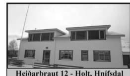
Heiðarbraut 12 - Holt, Hnífsdal

220 m 2 Einbýlishús á tveimur hæðum. Neðri hæð er steipt en efri hæð er byggð úr timbri, bílskúr er ca 21 m 2 .