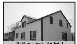
Bakkavegur 6, Hnífsdal

179,2 m 2 klætt einbýlishús á tveimur hæðum ásamt 23 m 2 bílskúr og sólskála.