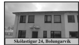
Skólastígur 24, Bolungarvík

140,2 ferm. parhús á tveimur hæðum, sem byggt var úr steinsteypu 1959, fjögur svefnherbergi.