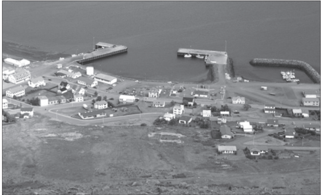
Þingeyri við Dýrafjörð.

Báðar heimstýrjaldirnar var Selfoss í siglingum. Hann var aldrei hraðskreytt skip. En einu sinni komst hann þó upp í 18 sjóm. ferð. Það var í Pentlinum, straumurinn var þá með skipinu. Annars siglir það tæpl. með meiri hraða í góðu veðri en svona 8-9 mílur. Í síðasta stríði er öll skip fóru í lestum, gekk Selfoss oft erfiðlega að fylgja hópnum. Stundum varð skipið hreinlega viðskila við lestirnar, en skilaði sér og skipshöfn heilli á húfi.