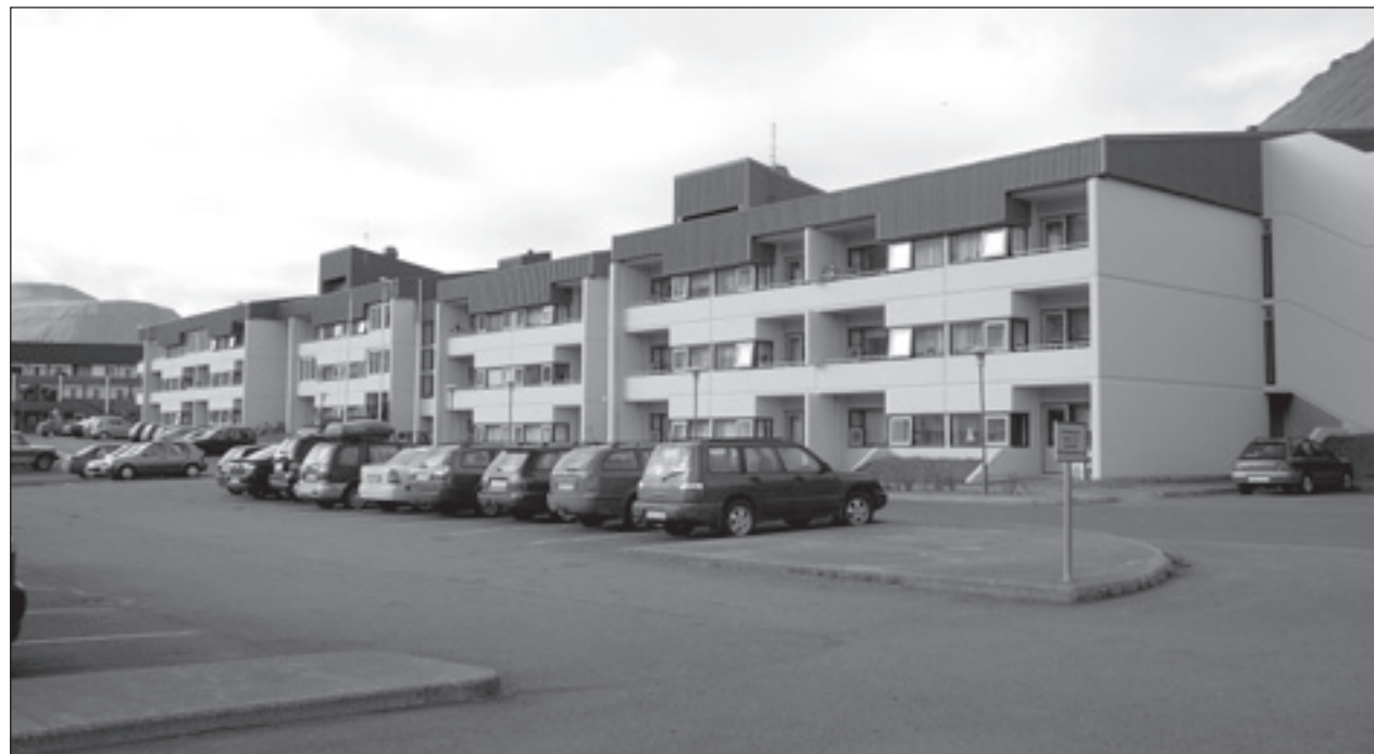
Hlíf, íbúðir aldraðra á Ísafirði.

bólað á starfsleyfinu síðan þá og segir Þór nú sinn eigin slóðahátt og önnur verkefni teifa málið. Hjá Ísafjarðarbæ fengust þær fréttir að Umhverfisstofnun væri að vinna í málinu. – annska@bb.is