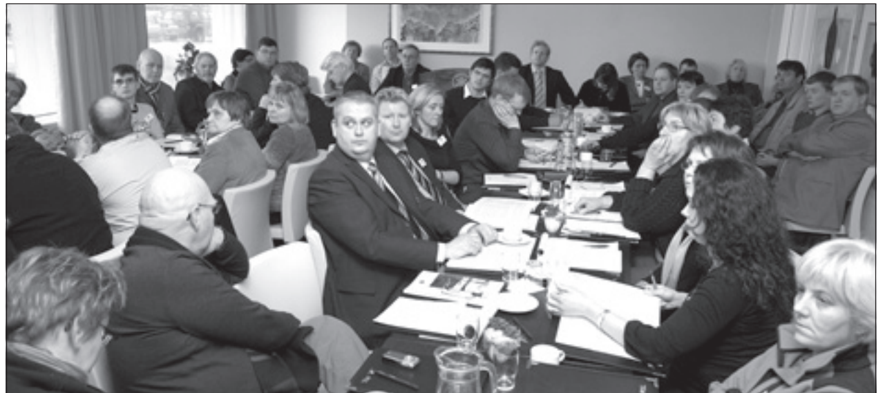
Margt var um manninn á aðalfundi Ferðamálasamtaka Íslands sem haldinn var á Hótel Ísafirði.

Þá gerði samgönguráðgjafi að umræðuefni aukin umsvif í móttöku skemmtiferðaskipa en á síðasta ári höfðu 22 skip viðdvöl á Ísafirði og næsta sumar er gert ráð fyrir komu 28 skipa með um það bil 18 þúsund gestum. „Þjónusta við skemmtiferðaskip og farþega þeirra er mikilvæg búþót. Móttaka farþega frá skemmtiferðaskipum hefur marga snertifleti, í skipulagi og sölumennsku, menningu- og listum, land- og mannlífsskynningum svo eitthvað sé nefnt. Með vaxandi umsvifum á þessu sviði er nauðsynlegt að við séum tilbúin með innviðina á þessum stöðum, að hafa næg-