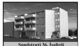
Sundstræti 36, Ísafirði

118,9 m 2 nýjar 3ja herbergja íbúðir í fjölbýli ásamt staði í bílgeymslu, ath aðeins 3 íbúðir eftir.