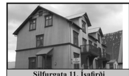
Silfurgata 11, Ísafirði

125 m 2 fjögurra herbergja íbúð á tveimur hæðum í uppgerðu fjölbýlishúsi.