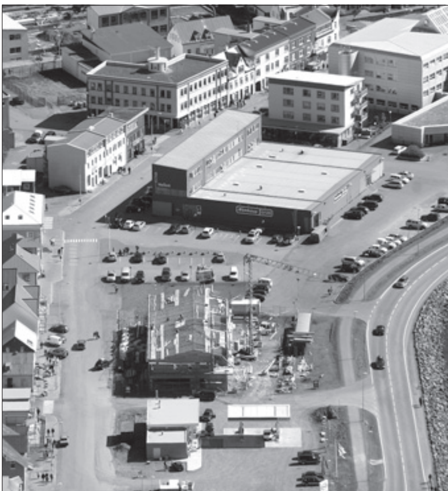
Umrædd lóð er við hliðina á nýbyggingunni við Hafnarstræti.