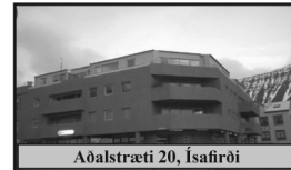
Aðalstræti 20, Ísafirði

100m 2 þriggja herbergja íbúð á 2. hæð í fjölbýlishúsi í miðbænum, ásamt sér geymslu.