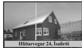
Hlíðarvegur 24, Ísafirði

180,6 m 2 einbýlishús á þremur hæðum ásamt 45,6 m 2 stórum geymsluskúr. Kjallari er steiptur en efri hæðir eru úr timbri.