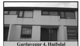
Garðavegur 4, Hnífsdal

117 m 2 steinsteypt raðhús á tveimur hæðum ásamt 28 m 2 bílskúr, þrjú svefnherbergi.