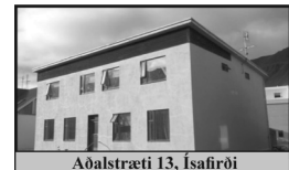
Aðalstræti 13, Ísafirði

Samtals 184 m 2 4-5 herbergja íbúð í tvíbýli í miðbæ Ísafjarðar, geymslur í kjallara og helmingur bílskúrs fylgir.