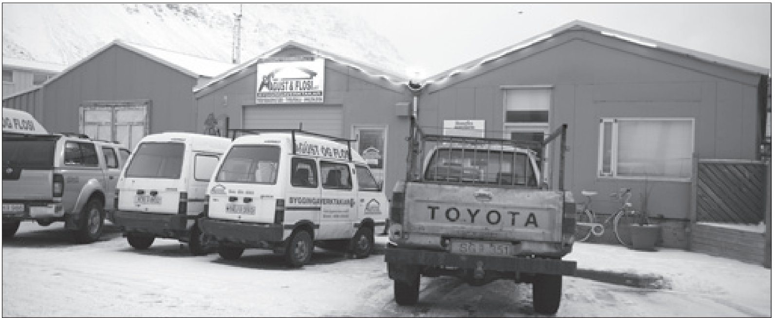
Höfuðstöðvar Ágústi og Flosa ehf., við Árnagötu á Ísafirði.