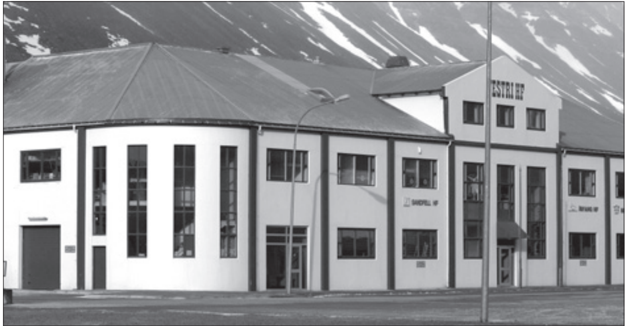
Tímamót verða hjá Háskólasetrinu þegar námskeið í markaðsfræði hefst í febrúar.