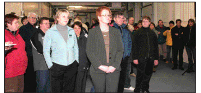
Gestir fylgjast með athygli á ræðuhöldin.

var farið yfir sögu fyrirtækisins í máli og myndum og boðið var upp á hinar ýmsu kræsingar, en um veitingarnar sá veitingastaðurinn Talisman á Suðureyri. Páll Önundarson var í hófinu og tók þar meðfylgjandi myndir.