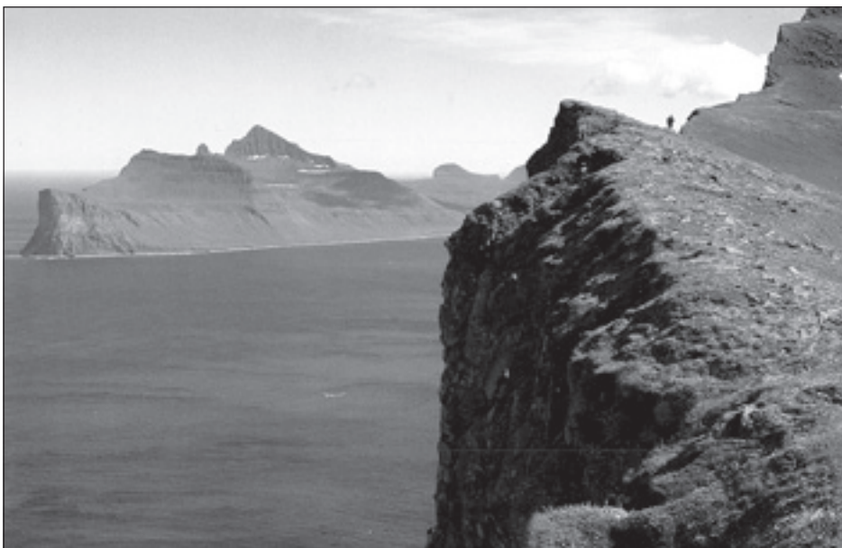
Frá Hornströndum.

ferðaþjónustufyrirtæki verði starfrækt, nokkur bátafélög, nokkrir gististaðir og tvær eða þrjár ferðaskrifstofur sem sinna ferðamönnum sem fara inn á svæðið. „Þar sem ekki eru hús