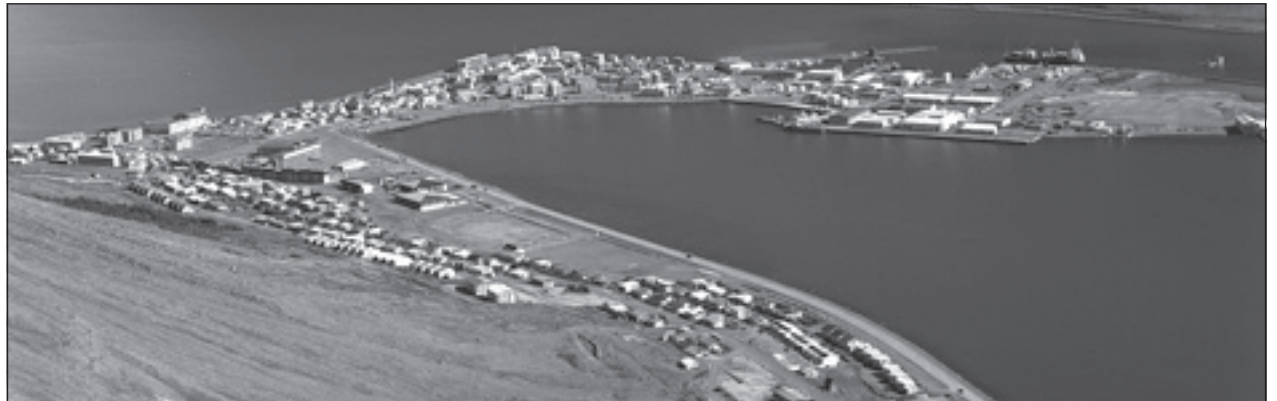
Fasteignir í fjölbýli á Ísafirði hækkuðu í verði á milli ára.

Þessar tölur koma úr verðsjá Fasteignamat ríkisins og miðast við árin 2005 og 2006.