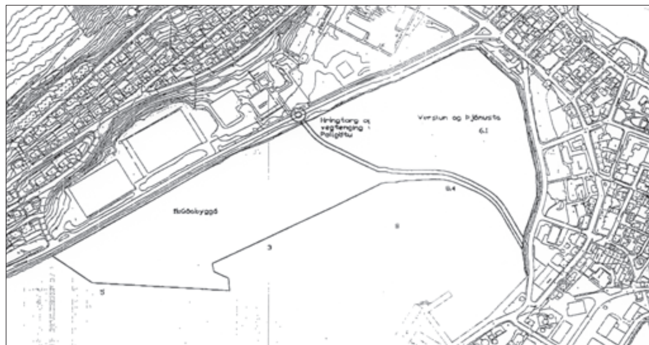
Hluti af uppdrætti Eyrarsteypu að landfyllingu.