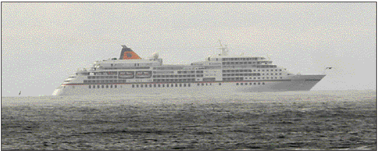
Skemmtiferðaskipið Europa á siglingu undan Vestfjörðum.