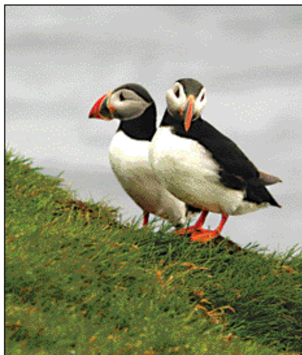
Lundi við Látrabjarg.

Á heildina litið er því nóg um að vera í ferðaþjónustu á Vestfjörðum og ég og aðrir sem störfum í þessum geira lítum björtum augum til framtíðar.“