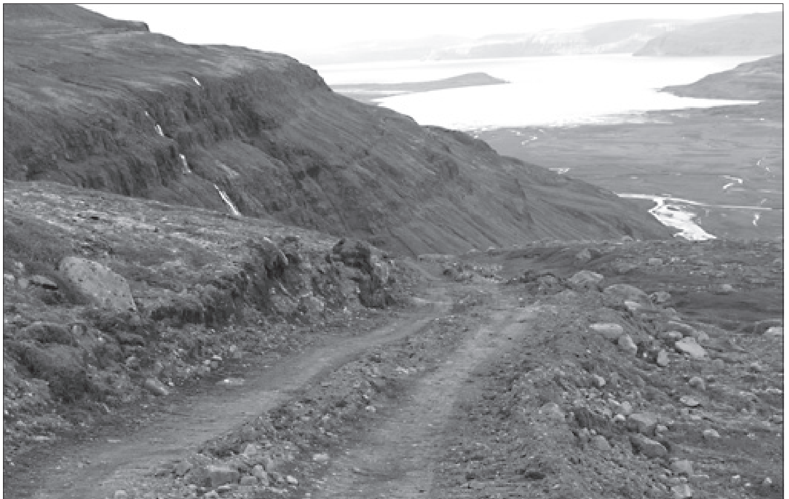
Hinn margumræddi vegarslóði í Leirufjörð.