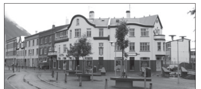
Verð á sérbylí á Ísafirði hefur hækkað mikið.