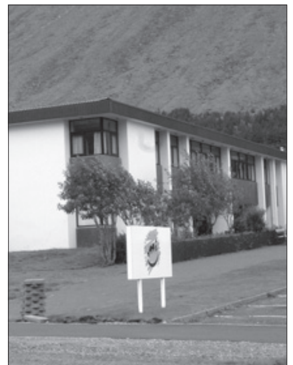
Menntaskólinn á Ísafirði.

landsmenn hafi aðgang að gagnvirku stafrænu sjónvarpi og jafnframt að dreifing sjónvarpsdagskrár RÚV, auk hljóðvarps Rásar 1 og Rásar 2, verði stafræn um gervihnött til sjómanna á miðum við landið og strjálbýlli svæða. Ráðherra fór einnig yfir verkefni sem unnið er að eða er að ljúka í landshlutanum svo sem framkvæmdir við Djúpvæg um Mjóafjörð og Reykjanes. — thelma@bb.is