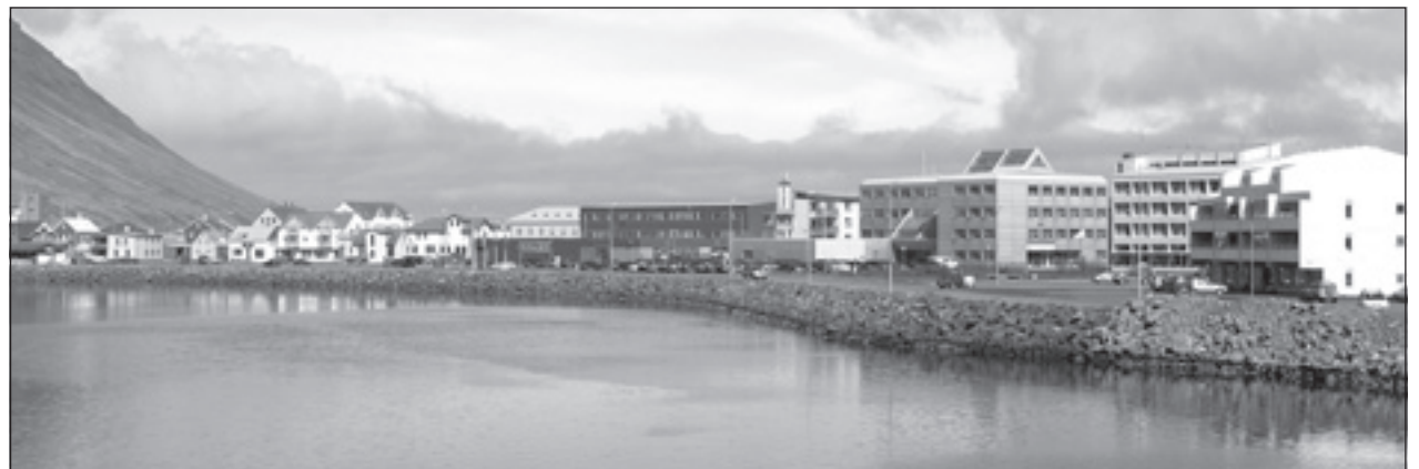
Svæðisútvarp Vestfjarða gerði samanburð á ýmsum þáttum hjá Ísafjarðarbæ og Skagafirði.

Svæðisútvarpið kannaði einnig laun sveitarstjórnarmanna. „Samkvæmt upplýsingum fjármálastjóra Skagafjarðar fær forseti bærstjórnar þar rúmlega 82.500 krónur í föst laun plús tæplega 19.500 krónur fyrir hvern fund. Ef